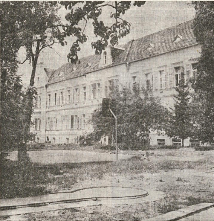
Psihiatrični oddelek Ormož

V petek 21. maja je potekal v večernih urah redni občni zbor Društva medicinskih sester Ptuj — Ormož.