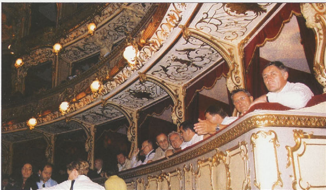
Na koncertu Bambin di Praga