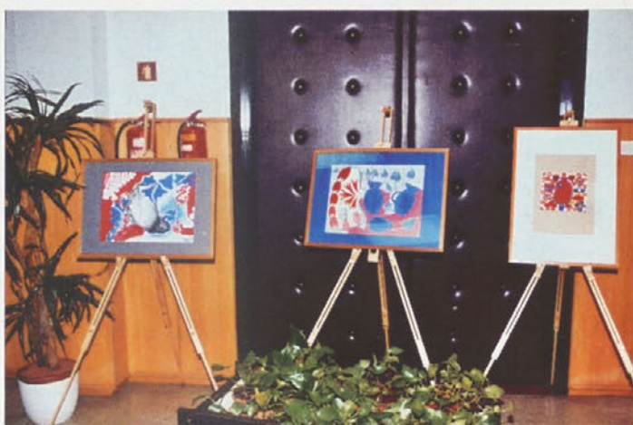
Razstava slik likovne sekcije DPD Svoboda Kidričevo