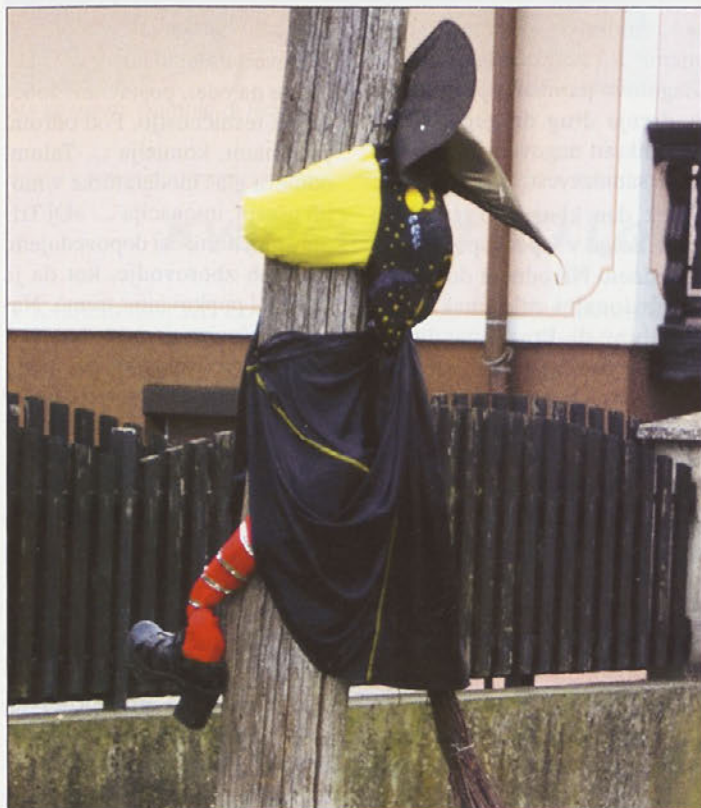
Trd pristanek v Starošincih.