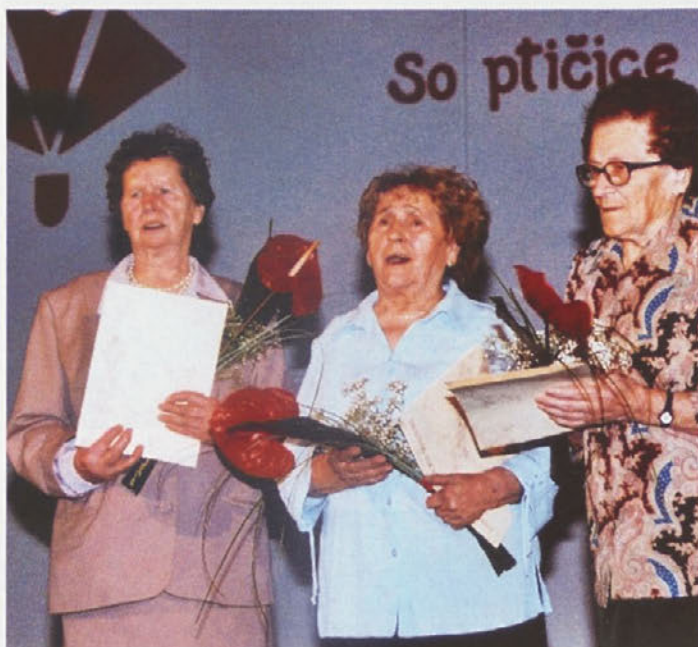
Prejemnice zlatih Gallusovih značk