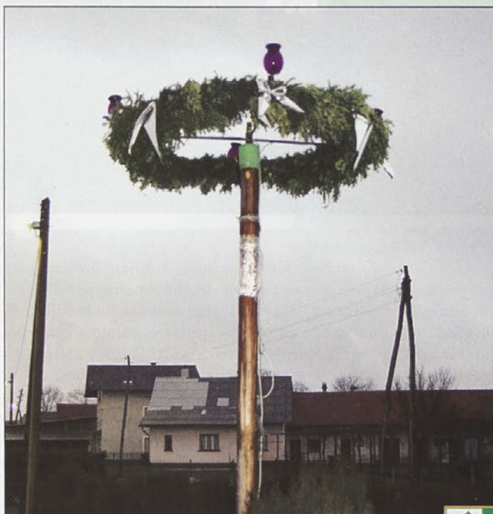
Adventni venček na prostem pri družini Frangež.