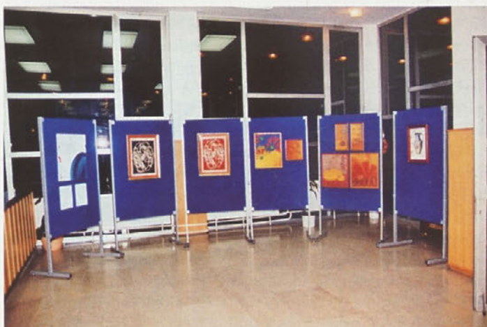
Razstava likovnih del učencev likovnega krožka OŠ Borisa Kidriča Kidričevo