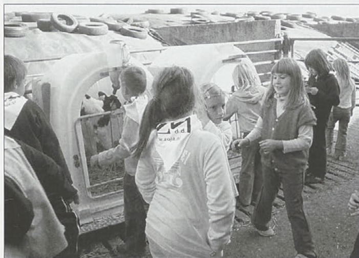
Kmetija Beranič - Telički v iglujih.