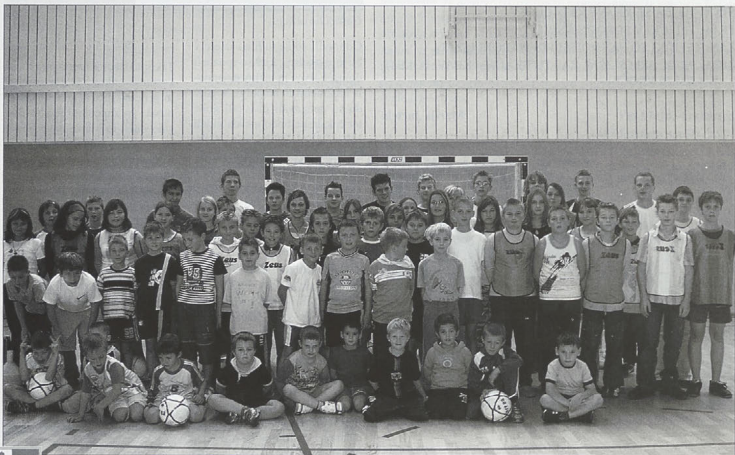
Vsi člani društva.

V soboto 9.12.2006 pa smo se udeležili turnirja Rad igram no-