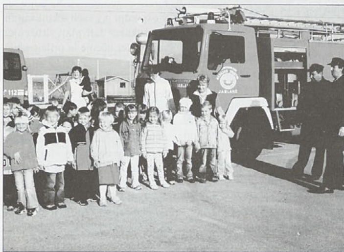
Gasilci na obisku

Obiskali so nas gasilci in otokom razkazali avtomobile z opremo, uniforme in prav prevzeli so jih s prikazom gašenja. Po obisku gasilcev so otroci narisali, kar so videli in doživeli, ter risbice