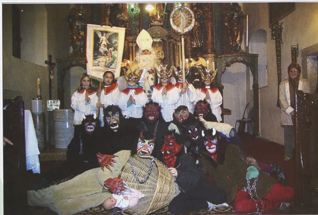
Miklavž v družbi angelov in parkljev.