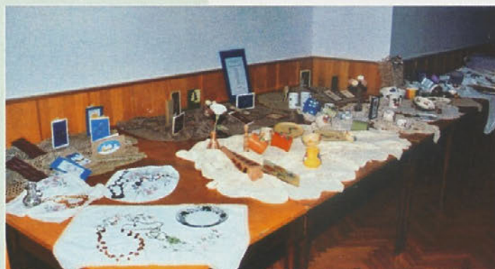
Razstava ročnih del kreativnih delavnic za odrasle DPD Svoboda Kidričevo