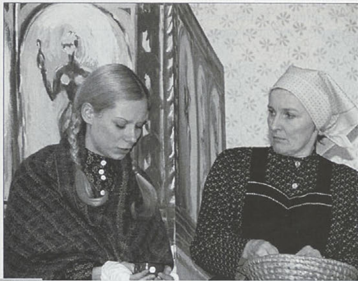
Prizor iz igre Micki je treba moža.