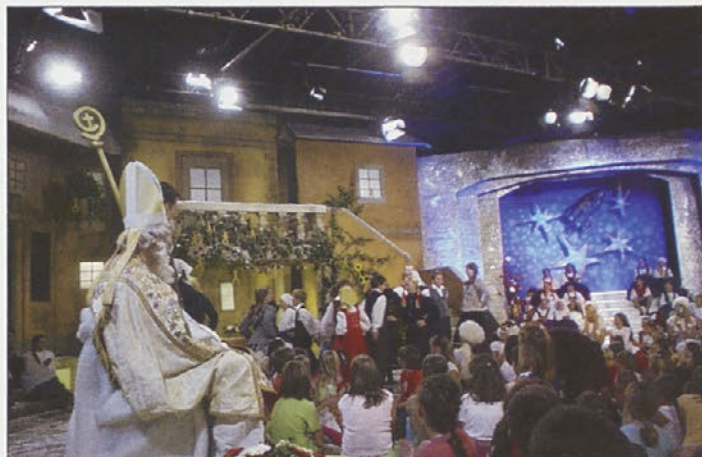
Ples v Raketi.

stavila miklavževanje v domačem kraju in seveda svoje želje. Miklavžu pa smo dali tudi simbolično darilo. Mi smo mu poklonili »korpo buoba pa riepe« in mu razložili, da prihajamo iz krajev, kjer smo jeseni to pobrali in imamo za zimo, želimo si pa »cukre pa vriehe«. Govorili smo, kot se za Cirkovčane spodobi, po cirkovško, zaplesali smo pa ples šotiš.