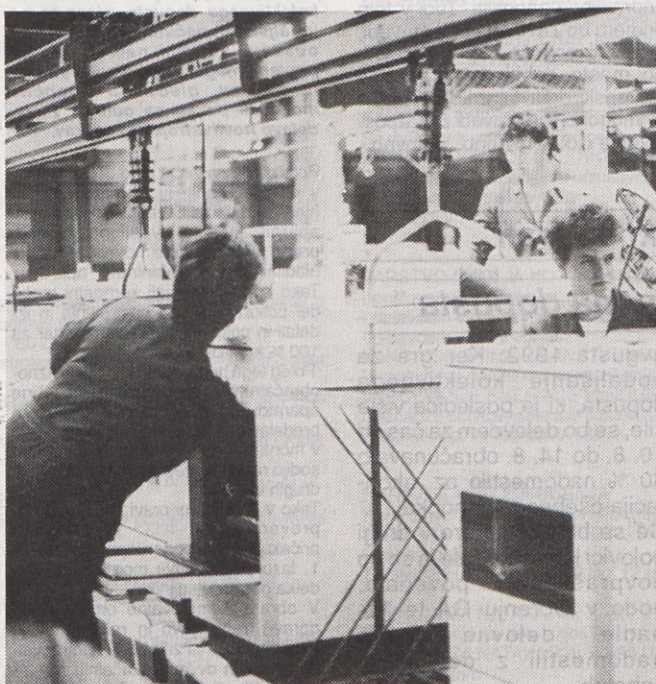
Le še nekaj delovnih dni in napočil bo čas kolektivnega dopusta

Vzemimo samo naslednji primer: Gorenje Gospodinjski aparati izvozi na mesec za 30 do 32 milijonov DEM izdelkov, mesečni devizni presežek pa znaša od 15 do 16 milijonov DEM. Zaradi precenjenosti tolarja izgubi podjetje na mesec od 3 do 3,5 milijone DEM! Poraja se vprašanje, kot je bilo povedano na torkovi novinarski konferenci, ali je smiselno še naprej negovati trdnost tolarja, tudi za ceno ustavitve kolesja slovenskega gospodarstva, posebej seveda izvoznega. V Gorenju Gospodinjski aparati so pripravili več predlogov tudi o tem, kakšni naj bi bili ukrepi ekonomske politike. Zadevajo premoženje slovenskih podjetij v drugih delih nekdanje Jugoslavije in obračun evidenčnih deviznih pravic, plače in proračun naj bi vezali na gibanje deviznega tečaja, prav tako tudi cene komunalnih storitev in javnega sektorja. Zavzemajo se za dodatno stimuliranje izvoznikov pri uvozu opreme, za sanacijo javnih podjetij in za nekatere novosti v zvezi s stečajni. V kolikor v kratkem ne pride do sanacije bank, pa bi bilo treba določiti novo razmerje med DEM in SIT.