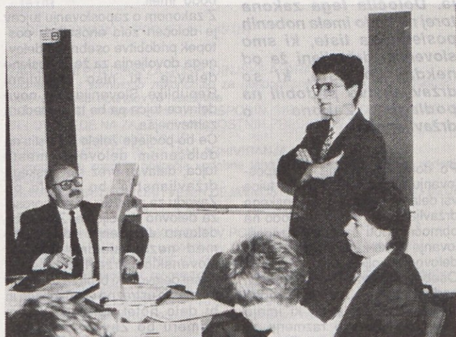
V Gorenju Gospodinjski aparati imajo tudi več predlogov za ukrepe ekonomske politike.

dobaviteljev reprodukcijskega materiala in sestavnih delov so se junija čisti materialni stroški v prihodu že približali 65 % (v prvem trimesečju so znašali 56 %). Skupni stroški obresti dosegajo enomesečni bruto prihodek podjetja, od uvedbe tolarja pa do konca aprila so v Gorenju Gospodinjski aparati pripisali glavnici ali plačali obresti (po obrestni meri R) v višini 1,4 milijarde SIT. V nekdanji Jugoslaviji ima to največje podjetje koncerna Gorenje za blizu 100 milijonov DEM dediščine - premoženja. Pozabiti pa ne gre niti na državo - kot strošek. Kot je bilo povedano na novinarski konferenci, država v vse dajatve vgrajuje inflacijo. Podjetje je do 15. junija letos plačalo več