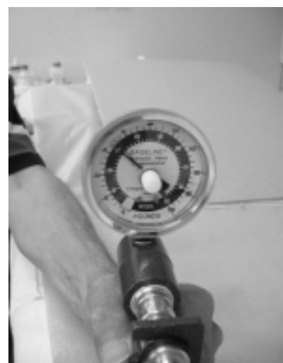
Sl. 8. Moč stiska pesti 15 let po operaciji – 70 kilopondov. Figure 8. Power grip 15 years after surgery – 70 kilopounds.