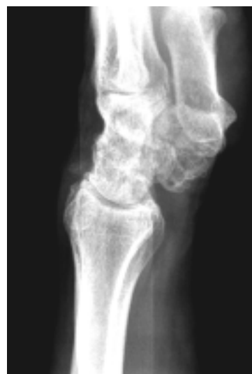
Sl. 5 in 6. Isti bolnik petnajst let po operaciji. Figure 5 and 6. The same patient fifteen years after surgery.