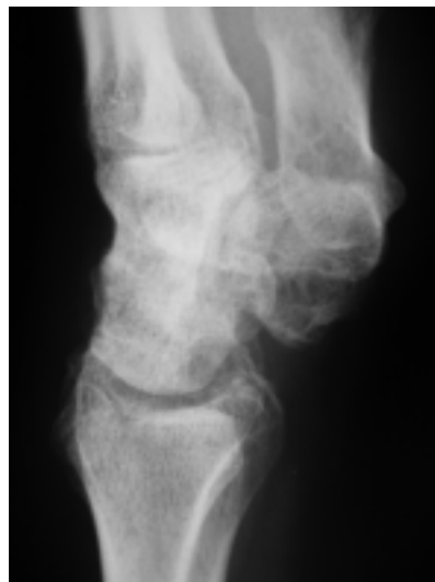
Sl. 3 in 4. Srednja zapestna zatrditev v primeru Preiserjeve bolezni tri leta po operaciji. Figure 3 and 4. Four corner arthrodesis for Preiser's disease three years after surgery.