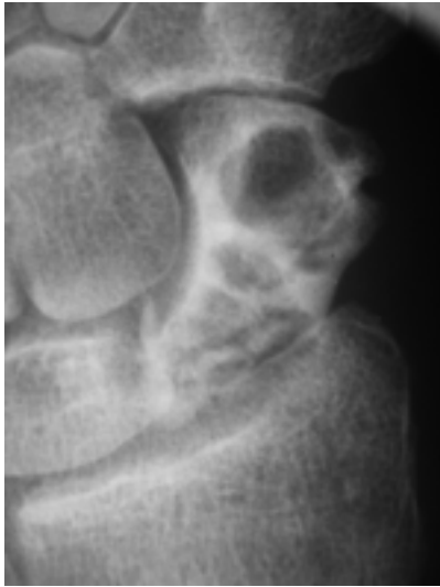
Sl. 1. Preiserjeva bolezen levega zapestja – 3. stopnja. Figure 1. Preiser's disease of the left wrist – stage 3.