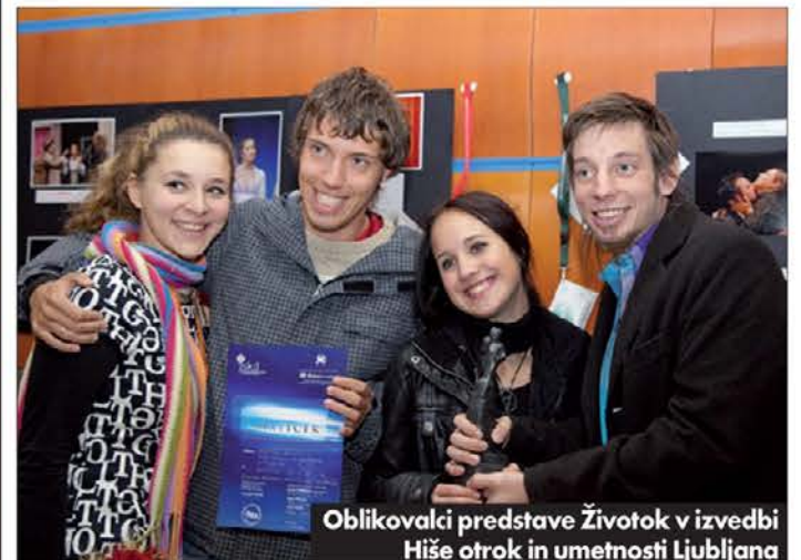
Oblikovalci predstave Životok v izvedbi Hiše otrok in umetnosti Ljubljana