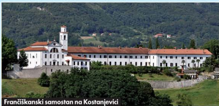
Frančiškanski samostan na Kostanjevici