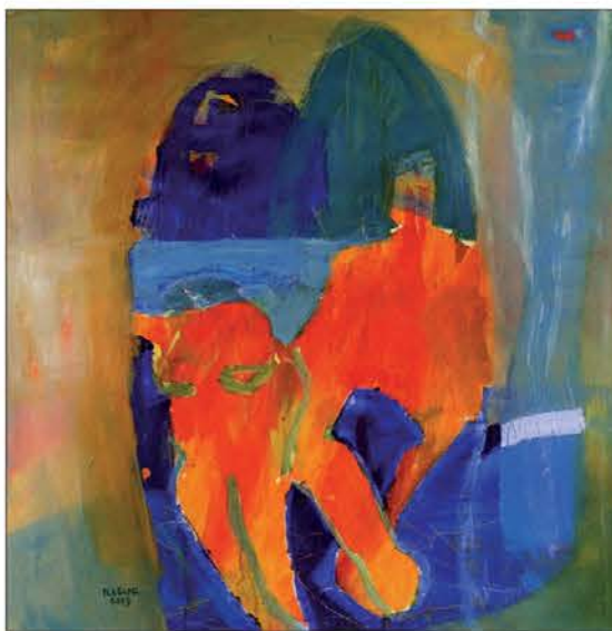
Spomin na jutri II, 2003, akril na platno 100 x 100cm

doživeto in na trenutke tudi že izživeto". Avtorica izhaja iz svojih