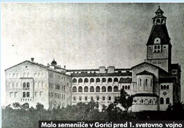
Malo semenišče v Gorici pred 1. svetovno vojno