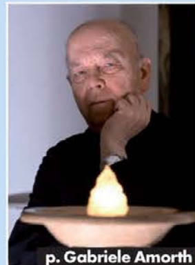
p. Gabriele Amorth

Pravzaprav niti ne dosti drugačen od vsakdanjika, ki ga živimo.