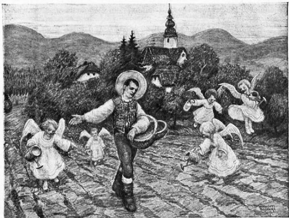
Sv. Izidor seje, angeli pa zalivajo.