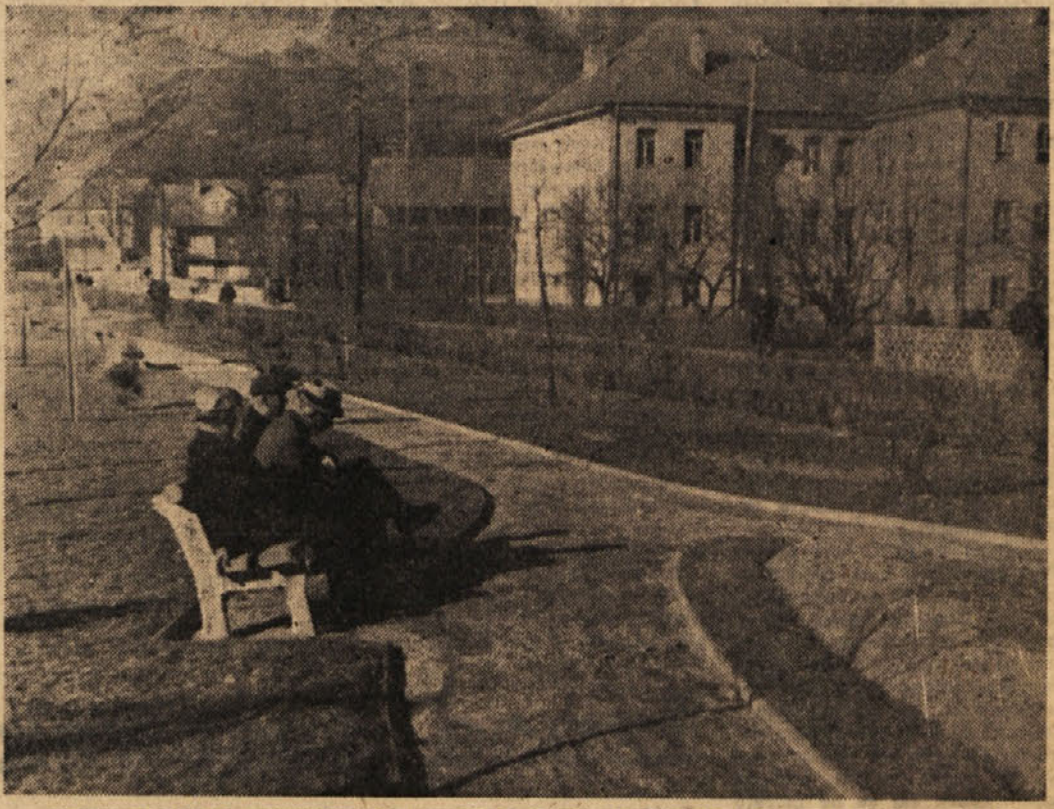
KONEC JE LEPIH JESENSKIH DNI, KLOPI V PARKU V ZAGORJU PA SO OSTALE PRAZNE

Na koncu je treba le še poudariti, da nimamo za vse obsežne priprave niti kdo ve koliko časa. Čas praznovanja se naglo bliža; na naš vseh je, ali bomo letos res skrbno pripravili to praznovanje, ki bo našim otrokom napravilo nekaj dni resničnega veselja.