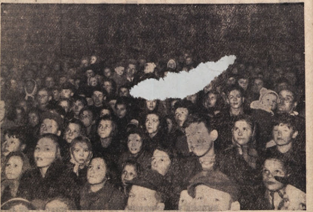
TAKO SI BODO TUDI LETOS NAJMLAJŠI Z ZANIMANJEM OGLEDALI PRIPREDITVE IN PRIBOD DEDKA MRAZA V OKVIRU NOVOLETNE JELKE

Povemo pa lahko to, da bo prihod dedka Mraza v slavnos-