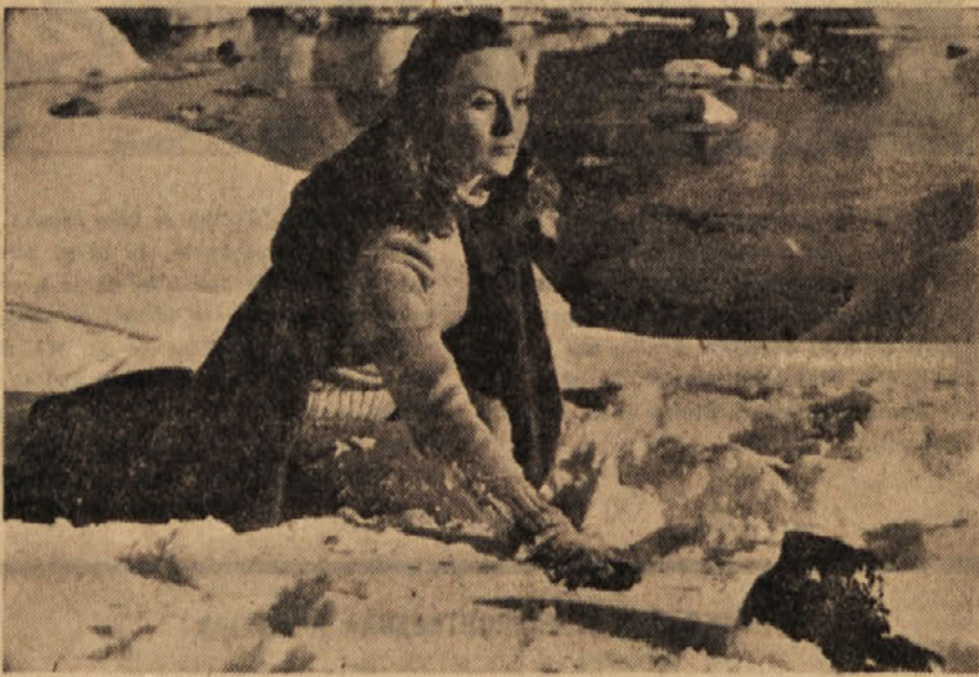
PRIZOR IZ FRANCOŠKEGA FILMA »PASTORALNA SIMFONJA«