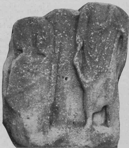
Slika 9. Reliefna plošča z možem in ženo

men je moral imeti ta prostor, da je na njem sredi aktivnega službovanja umrl oficir? Mislim, da nam je z njim zagotovljen aktivni vojaški uradnik, ki ga smemo v Noriku časovno opredeliti šele v obdobje po markomanskem vdoru, ko je dobila provinca redno vojaško enoto v zaščito. Vojaški uradnik, ki je bil tu naseljen in tudi pokopan, bi bil mogel opravljati razne funkcije, na primer tudi upravo manjše