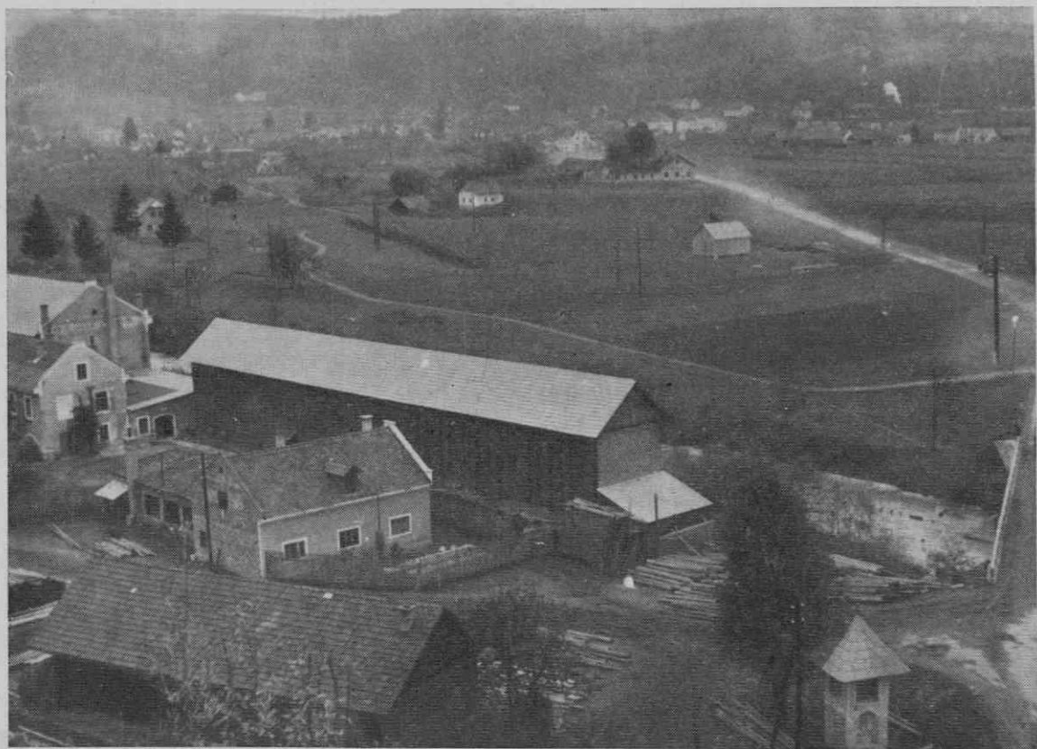
Slika 1. Zágrad, tovarna za lepenko

dolini. Cesta, ki je iz Starega trga vodila v Podjuno — oba kraja sta bila v antiki lokalni poštni postaji z imeni Colatio in Iuenna —, je tekla po hribovitem in utenjenem svetu, ki se le ob Meži, med Ravnami in Prevaljami, razširi v dokaj rodovitno, čeprav ne ravno veliko dolino (sl. 2). Dolina sama se nekako v sredini zoži, desni breg Meže se vzpne in tam leži, poleg Dobje vasi, zaselek Zágrad, kjer je na zemljišču tovarne za lepenko naključje odkrilo važne rimske starine (slika 1).