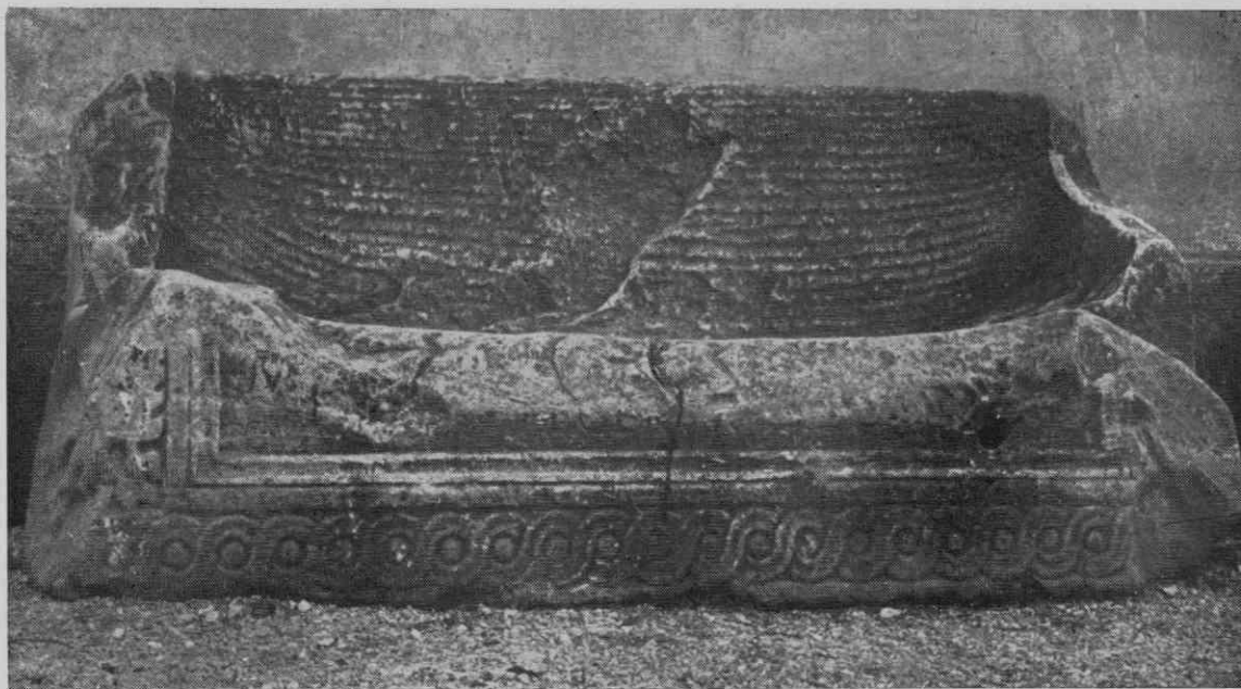
Slika 8. Marmornat sarkofag

čedalje več privilegijev za tako naseljevanje, bili so na primer oproščeni trgovske carine in mitnine, odlikovani s podelitvijo rimskega državljanstva, a včasih so jim odkazali tudi posestva z domačini kmeti.