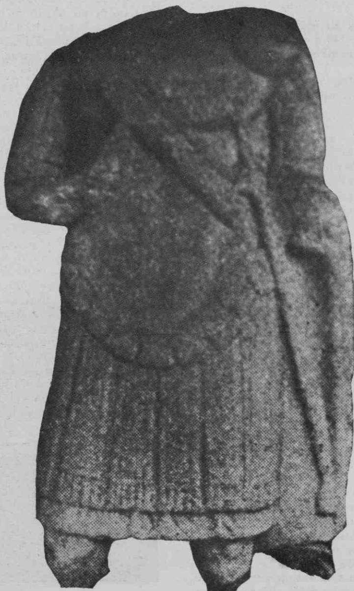
Slika 7. Torzo rimskega oficirja (reprod. iz Eggerjevega vodiča)

so bili naši kraji, na primer ob progi Celje—Stari trg pri Slovenjem Gradcu — Podjuna, prava divjina. Zato je tudi neverjetno, da bi se kdor koli, ki je imel možnost za naselitev v visoko civiliziranih predelih Italije ali bližnjega Orienta, prostovoljno naseljeval tod. Če so se pa po teh predelih vendarle naselili prebivalci, vajeni tudi boljšega in klimatično prijetnejšega življenja, jih je k temu silil ali poklic (trgovci, uradniki, nekateri obrtniki) ali pa se niso mogli naseliti drugod (dosluženi vojaki z odkazanimi posestvi in provincialno-uradniško funkcijo). Pa še tem, posebno doslužnemu vojaštvu, je morala vlada dajati