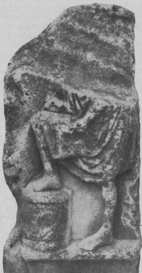
Slika 11. Odlomek reliefa s pisarjem

z ozidjem), v njih so stali sarkofag, reliefi in pridevki. Grobov menda ni bilo zelo veliko, bili so pa bogato okrašeni in najbrže obsajeni z žalnim drevjem. Morda je imela ena grobnica med njimi okrogel tločrt — če smemo zaupati ljudskemu izročilu.