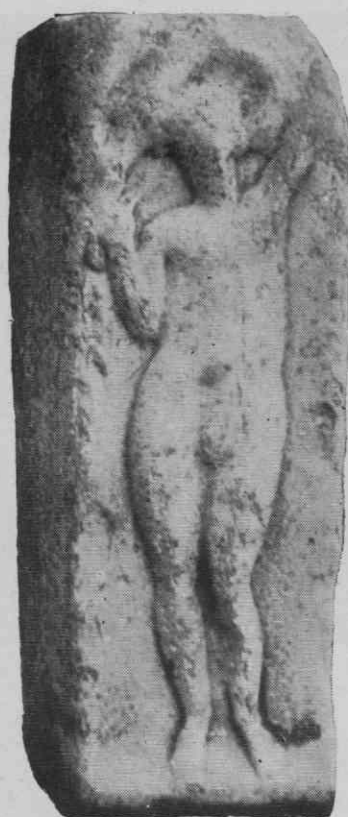
Slika 10. Relief s simbolično predstavo mladosti

Misel, da je bil Zágrad pri Prevaljah v tistem času nekaka državna podeželska postaja, krepko podpirajo trije ohranjeni reliefi funkcionarjev (slike 7, 9, 11); kajti