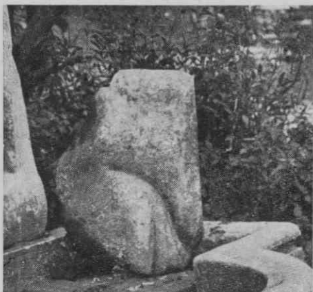
Slika 5. Odlomek z ramenom

Corpus inscr. lat. III 6522. Jabornegg I. c. ČZN XXIX 1954, 140 s sliko. AIJ 2. Sedaj služi pred Brančurnikovo gostilno v Dobji vasi kot klop.