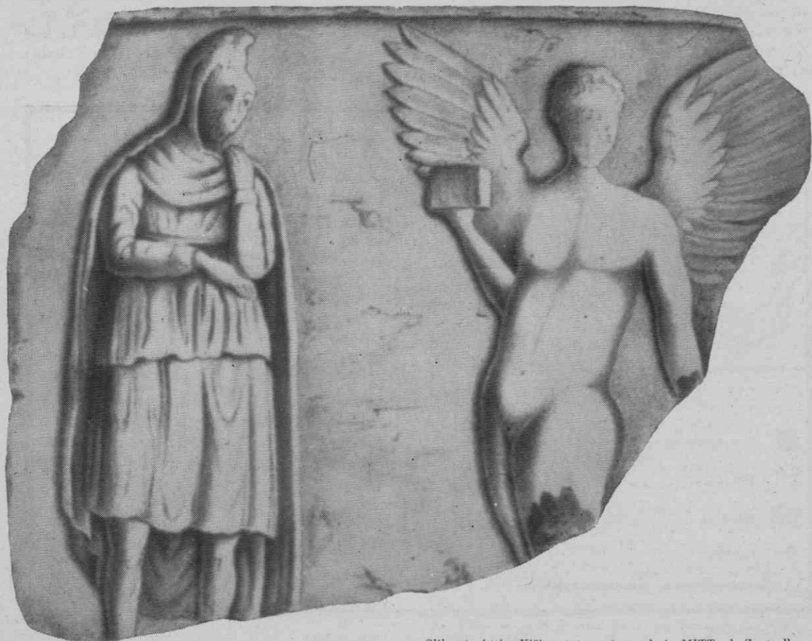
Slika 4. Attis. Višina 111 cm

Mitteil. d. Zentralkomm. III F. 1902, 55 (najden nekaj niže od Brančurnikovega mostu preko Meže); 293 s sliko; 1903, 242.