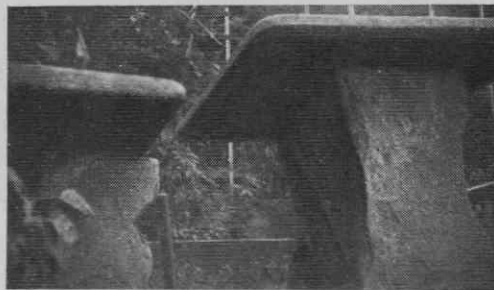
Slika 6. Nekaj gradbenih členov in oblog iz marmora

Človeka nekako preseneča obilica na enem mestu najdenih rimskih stavbnih ostankov. Navadno namreč opažamo razumljivo dejstvo, da so novi naseljenci v obdobju visokega srednjega veka porabljali rimske ruševine kot stavbni material za svoje zidave. Zato pri raziskavah antičnih selišč največkrat ne najdemo drugega kot vkopane temelje zgradb, v sloju ruševin pa niti ene cele opeke ali kamenitega bloka, kaj šele drugih porabnih in koristnih predmetov. A v srednjem veku niso porabljali samo material iz rimskih naselbinskih ru-