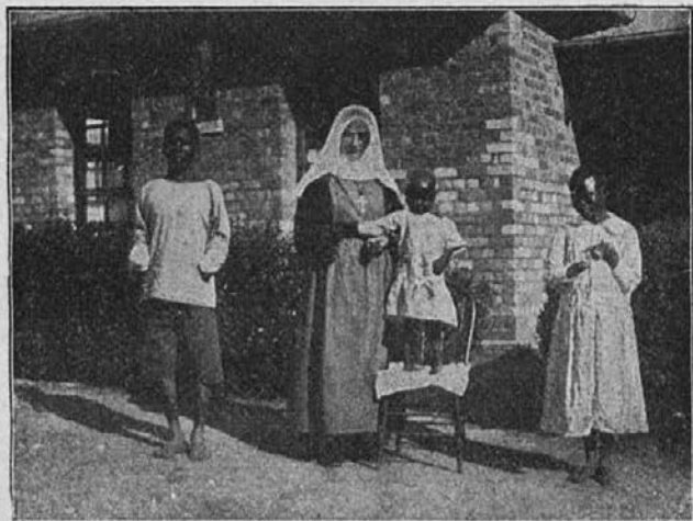
Misijonarka z bolnimi varovanci.