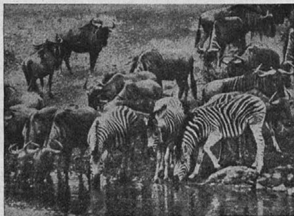
Čreda bivolov in zeber ob vodi. Take zverjadi je v afriških pragozdih vse polno.

ko bo večji, bo hodil v šolo. Zopet ena ovčica več v božjem hlevu!