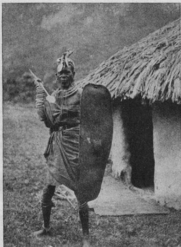
Veliki čarovnik — se spreobrne.

Tukaj je malo takih, ki bi misijonarja na zadnjo uro odklonili. Poprej so se misijonarja bali, zdaj nas sami kličejo. Naj povem primer iz zadnjih dni. Bilo je kmalu potem, ko sem nekemu umrlemu govoril na grobu. Zbolel je neki pogan, ki je bil trdno prepričan, da bo ozdravel, kakor hitro se da krstiti. Poklicali so katehista, ki je tam mimo šel, in ta ga je krstil. Res je bolnik ozdravel. Danes je vsa njegova družina katoliška.