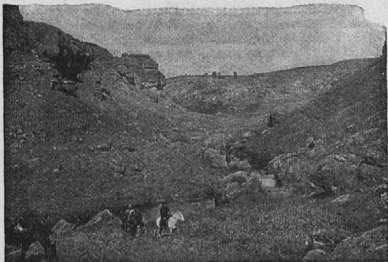
Misijonarji na apostolskih potih preko hribov in dolin.

pozdravljam! Vsakemu posebej podam roko, ker dobri prijatelji smo si: jaz in moji črni semeniščniki.