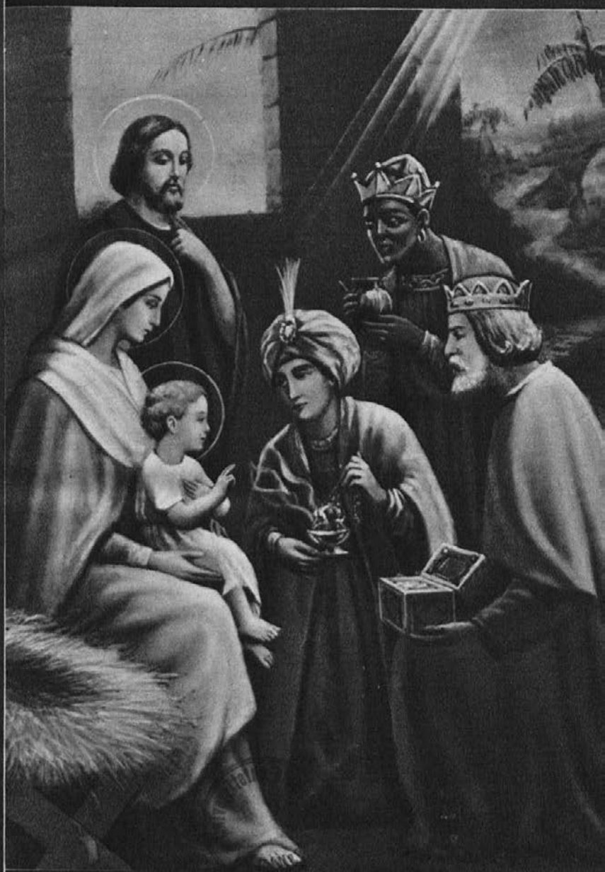
Sveti Trije kralji, zastopniki poganskih narodov, molijo novorojenega Zveličarja.