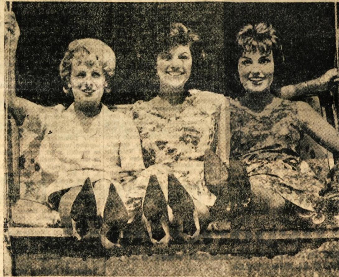
Tri hollywoodske lepotice niso na sliki zaradi obraza ali zaradi čedne postave, temveč zaradi pet na čevljih, ki so privedle do svetovnega spora. Neki nemški inženir je iznašel posebne prožne pete, ki se dajo zamenjati in zaradi vzmeti ne utrujajo nog

Italijanski statističarji trdijo, da vsak Italijan letno popije 133 litrov vina. Francozi imajo prvenstvo v potrošnji vina. Italijane prekašajo za 1 liter letno. Nemce smatrajo za najskromnejše pivce vina. Povprečno popijejo Nemci 10 litrov vina na prebivalca, Avstrijci pa dvakrat več. V ca, Avstrijci pa dvakrat več. V zlati sredini so Svicarji s 36 litri vina na leto, Grki z 42 litri, Spanci z 49 litri in Portugalci s 83 litri vina.