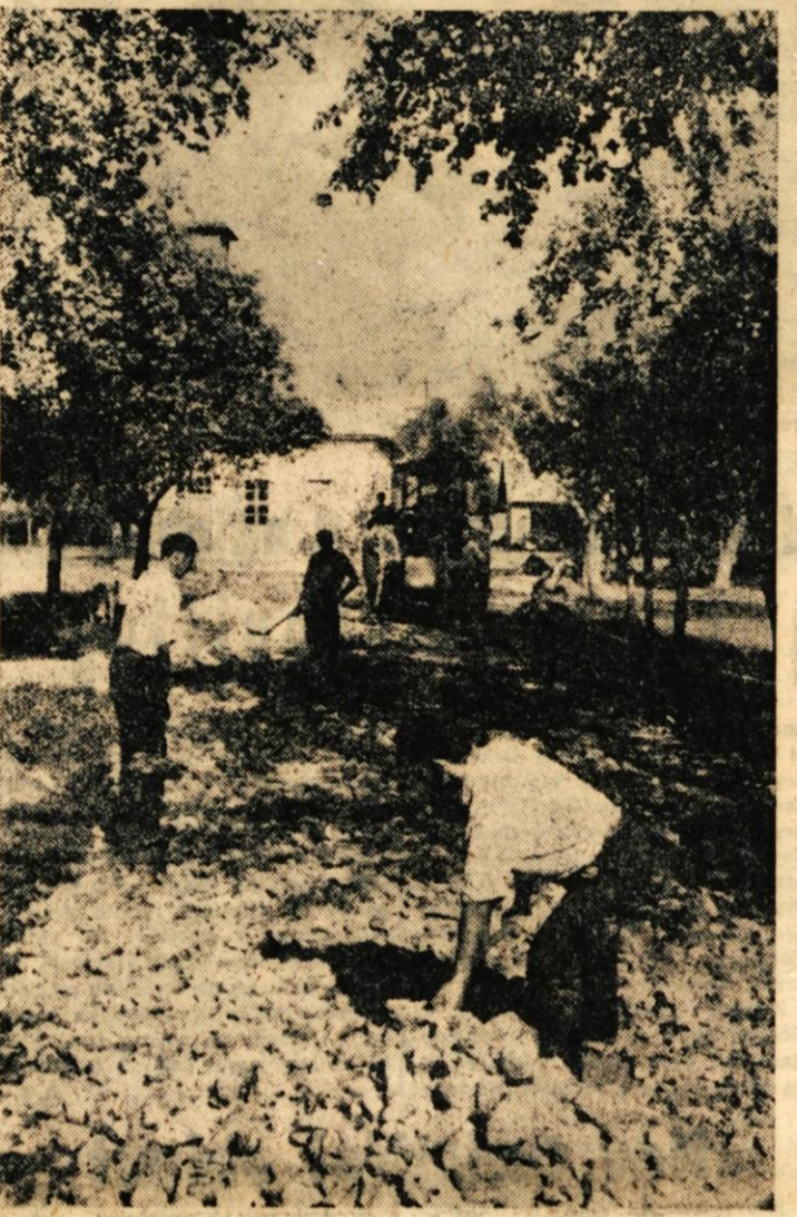
Asfaltiranje ceste Bled-Ribno

Tržič (n. n.) - Tukašnja organizacija ZROP pripravlja za prve dni v oktobru kolektivni izlet svojih članov. Na izlet bodo šli verjetno v Ankaran in si spodobno ogledali Postojnsko in Skočjansko jamo.