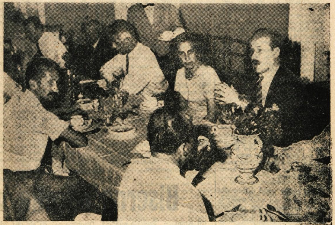
Poljska sindikalna delegacija med obedom na Blejskem gradu

Poljska sindikalna delegacija obiskala Gorenjsko