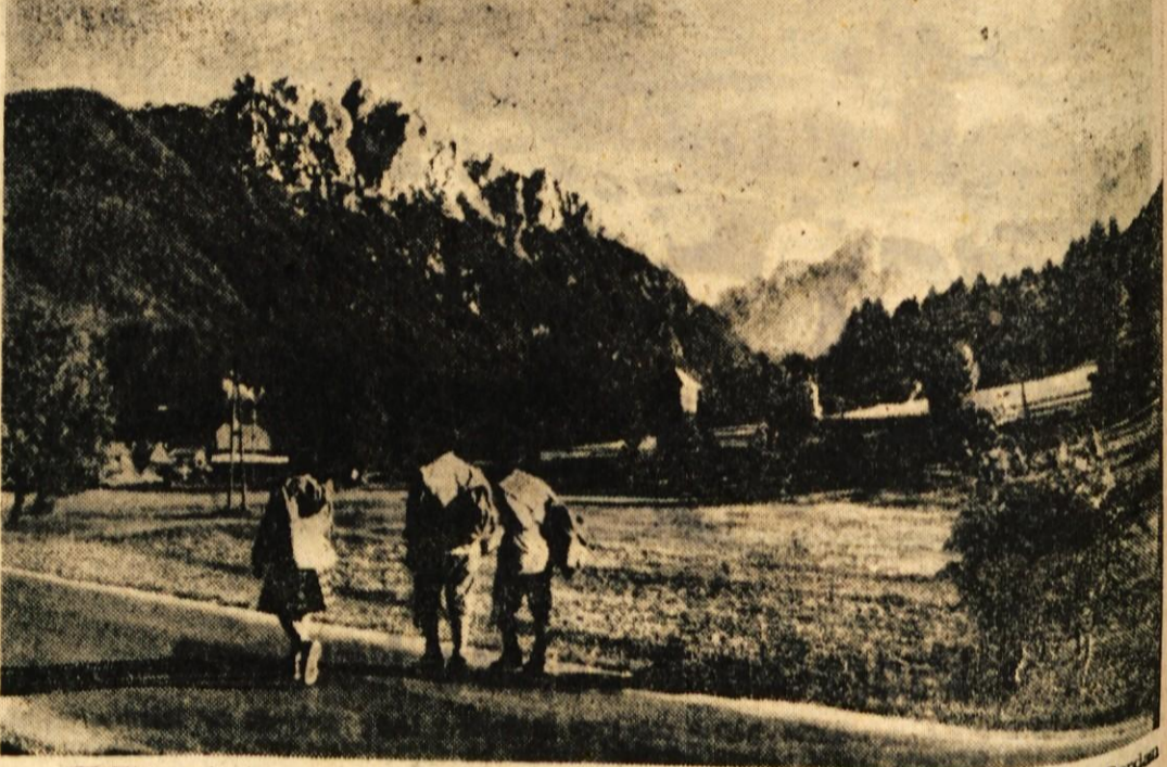
Fosno polje motiv