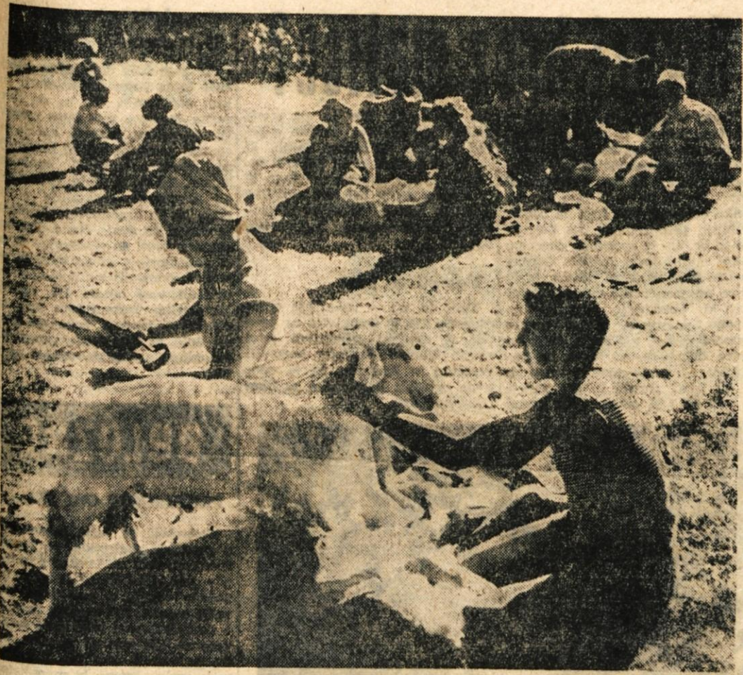
V Podkozemu na Gorenjskem se tako družno zberejo k striženju ovac