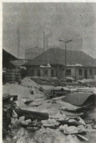
Kakšne zaloge pa so to?

Velike perspektive ima cinkotit pločevina, ki se zelo dobro prodaja, posebej na tujem trgu. Odpirajo se celo nova tržišča v zahodni Evropi, doma pa jo prodamo manj kot en odstotek.