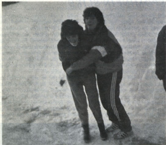
V sneg z njo. Močnejši pač zmagujejo...

bledikasti maski mojega prejšnjega obraza so razorane brazde, ni krvi. Ostane mi le še... - samomor?!