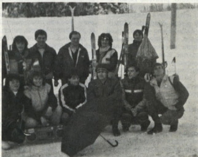
Z Jocinim kasetofonom »na čelu«, ki nas je spravljal v dobro voljo

spremljati, pomagati in organizirati delo koordinacijske konference osnovnih organizacij in komisij ter odborov, ter jim pomagati pri sestavljanju programa dela. Za vse svoje postopke je odgovoren KK ZSMS