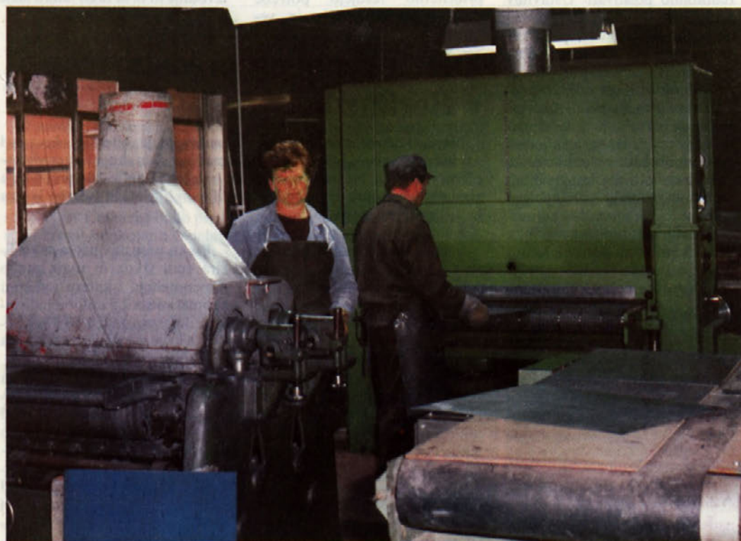
Proizvodnja v tiskarskih ploščah TOZD Grafike