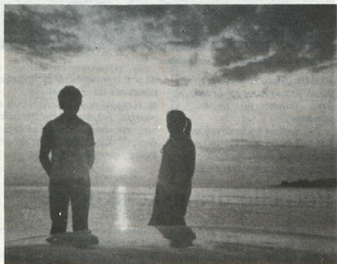
Mladost v sončnem zatonu

Tvoji dotiki so me spravljali iz tira, rada bi, da bi se me dotikal dan in noč, noč in dan... O bog, kaj so še kje na svetu tako slastne ustne, kot so bile tvoje? Električna me je tresla po vsem telesu, ko si me z njimi spravljal vedno v nove