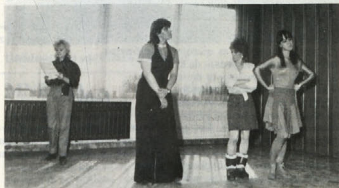
Prizor iz skeča »MISS devalvacije«

smo pripravili pester kulturni program za naše sodelavke. Sodelovali so: 33-članski godalni orkester, ki ga sestavljajo učenci glasbene šole iz Celja. Moški pevski zbor nam je zapel dve pesmi. Predstavili so se nam člani folklorne skupine France Prešeren iz Celja, s plesi iz Bosne in Hercegovine in Štajerske. Člani dramskega krožka, ki deluje v okviru ZSMS Cinkarna so nam predstavili prijeten skeč