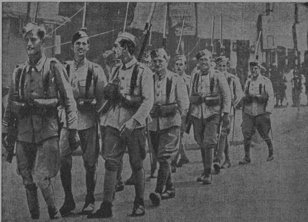
Vojaška diktatura kot obramba proti komunističnim prevratnim nakanam na Grškem.