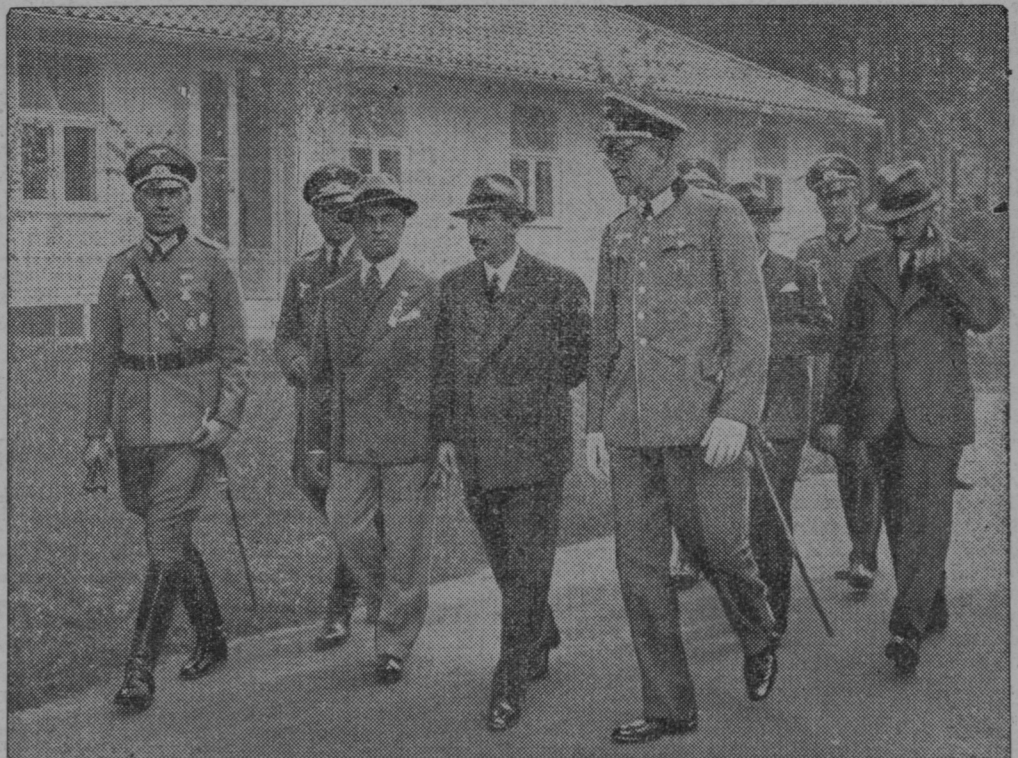
Bolgarski kralj Boris (na sredini v civilu) je obiskal olimpijsko vas pri Berlinu, kjer so bivali športniki iz celega sveta, ki so tekmovali na olimpijadi od 1.—16. avgusta.