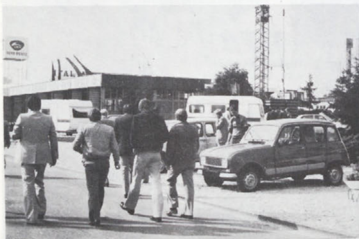
Le kvaliteta in solidna servisna mreža bo odločala o tem, koliko od teh obiskovalcev našega paviljona na zagrebškem velesojmu se bo oglasilo tudi v naših prodajalnah.