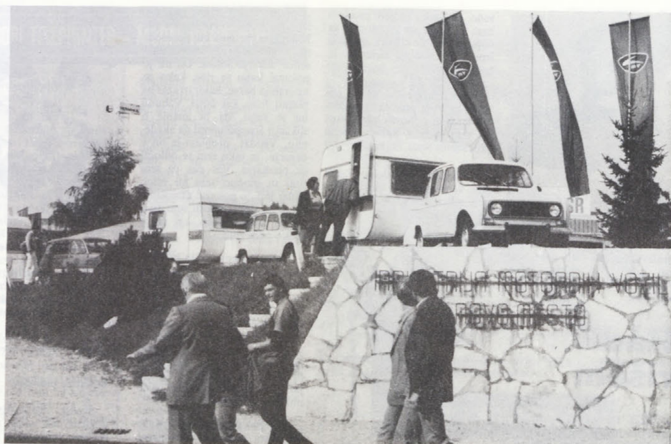
Zanimanje za naše avtomobilске prikolice je vsako leto veliko. Morda ne bi bilo slabo, če bi obiskovalcem jesenskega velesejma predstavili že kolekcijo za naslednje leto.