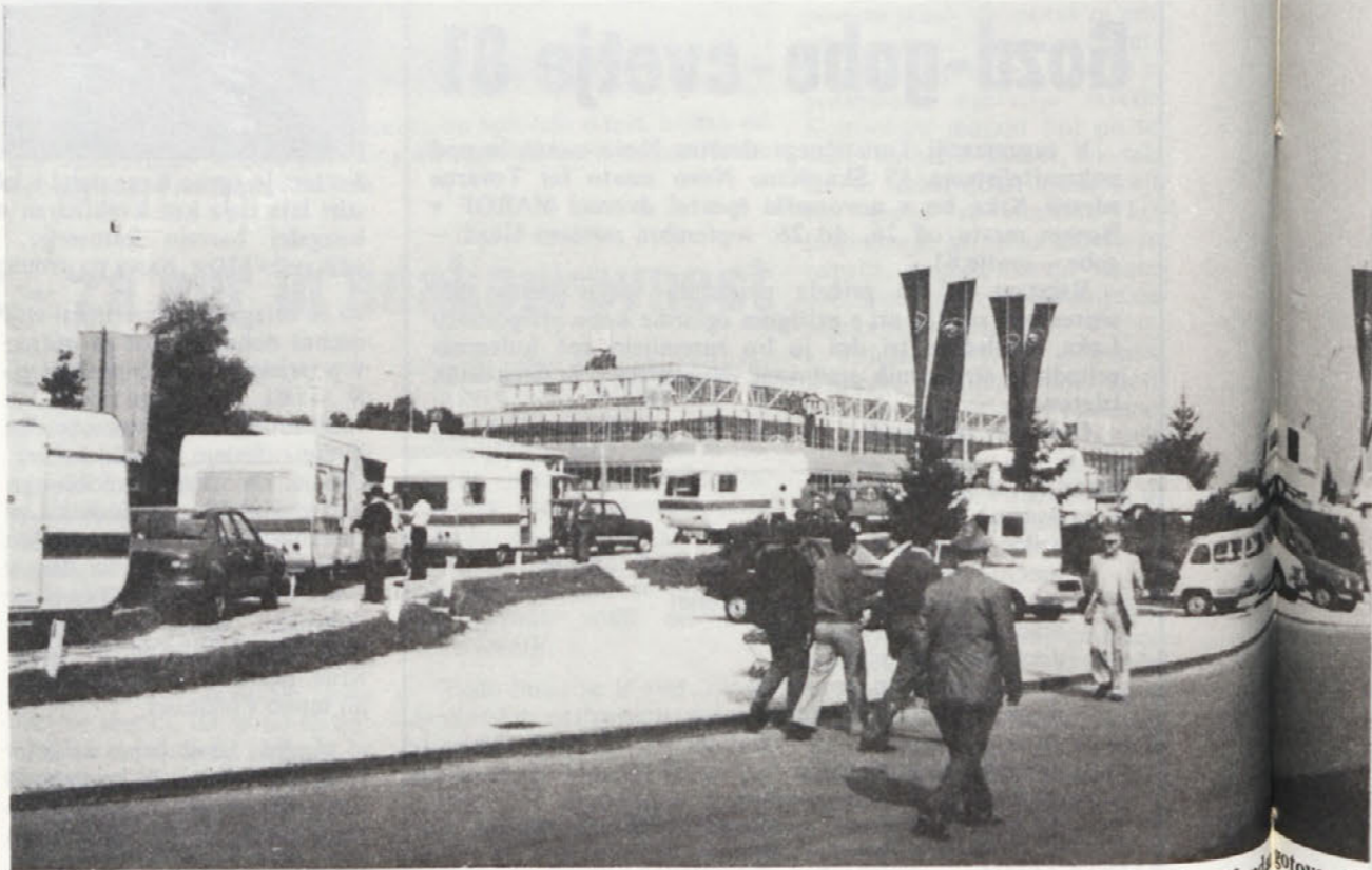
Naš razstveni prostor sodi na Zagrebškem velesejmu med ene najbolj urejenih in privlačnih. Vse pripravljeno to ni edina privlačnost, ki vabi obiskovalce.

Jesenski zagrebški velesejem. Zagreb v tem času postane še bolj dinamično mesto, množice ljudi z vseh koncev in krajev, tako iz naše domovine kot tujine, hitijo na razstavišče. Zanimanje za sejem je vsako leto večje, o tem zgovorno pričajo številni obiskovalci.