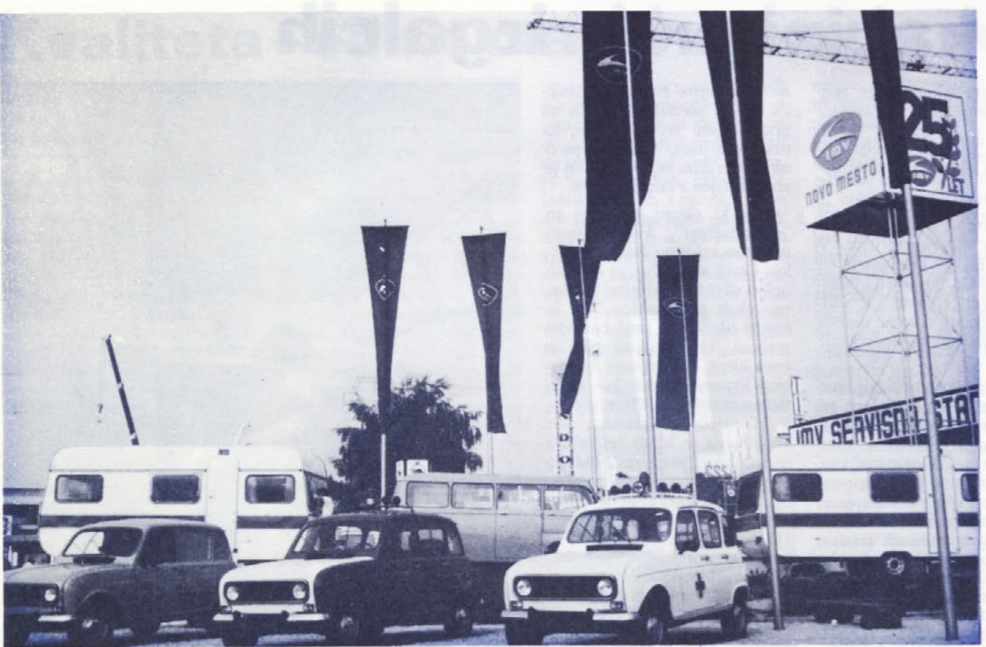
„Katra“ je tisti izdelek, ki na naš razstveni prostor privabi največ ljudi. Bodoči kupci si jo tu lahko dodobra ogledajo in dobijo vse potrebne informacije. Ker je uvedeno obročno plačevanje, kupci tudi v zvezi s tem želijo dobiti podrobnejše informacije.