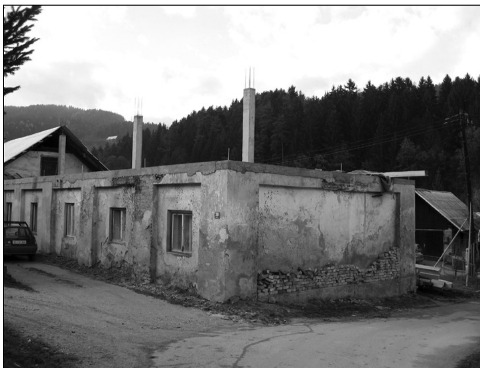
Stavba bolnice na Lešah danes.

vozička na dveh kolesih), odkoder so jih z vlakom prepeljali v Celovec. 33 Veliko bolnikov naj bi se v bolnici zdravilo leta 1919 zaradi epidemije griže. V zvezi s prenehanjem delovanja bolnice se omenja več letnic; to naj bi se zgodilo leta 1919 oziroma v letih 1921/1922. 34