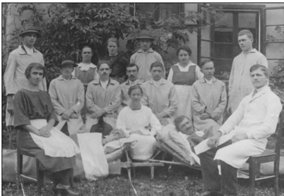
Osebe in bolniki v črnjanski bolnici po letu 1918 (Koroški pokrajinski muzej, Enota Ravne na Koroškem, fototeka).

za njihovo prehrano, obleko in stanovanja. Deželni zdravstveni inšpektor ni imel pripomb. 60