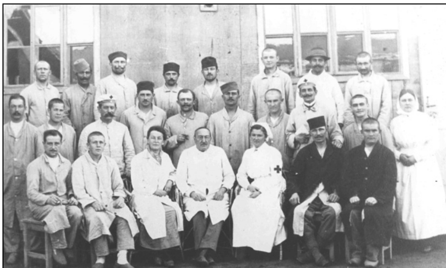
Osebe in bolniki v črnjanski bolnici leta 1914 (Koroški pokrajinski muzej, Enota Ravne na Koroškem, fototeka).