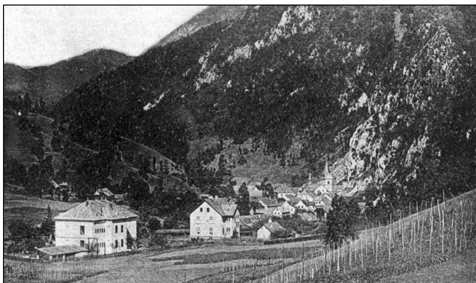
Bolnica v Črni pred drugo svetovno vojno – druga stavba z leve proti desni.