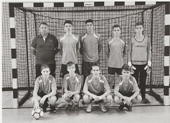
Ekipa osnovne šole Videm v nogometu