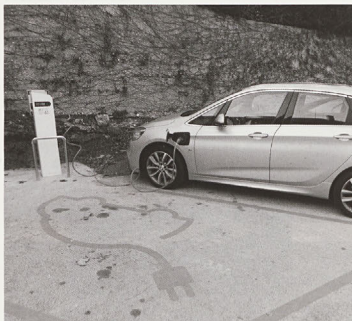
Električna polnilna postaja na parkirišču ob športnem objektu v Vidmu (za cerkvijo).