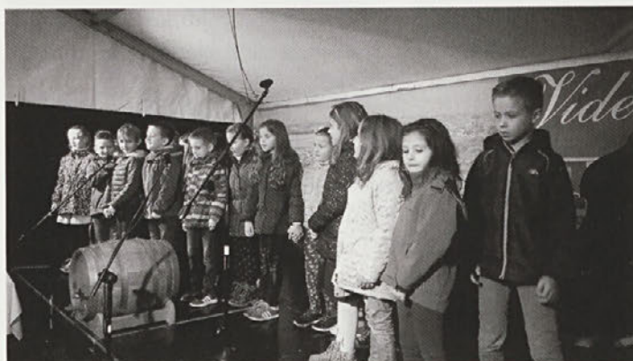
Utrinki iz letošnjega osrednjega martinovanja na Kočarjevi domačiji v Pobrežju.