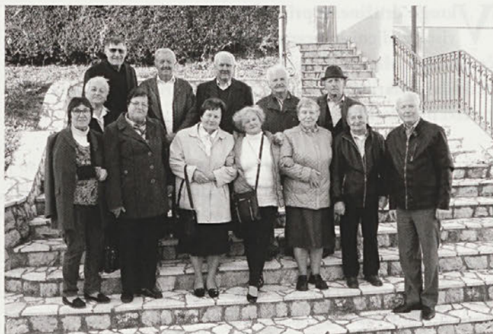
V oktobru so se v Vidmu srečali nekdanji sošolci.