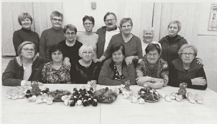
Skupinska fotografija večine članic, ki so obiskovale jesenske delavnice, z mentorjema.

Jesenski ponedeljkovi popoldnevi so bili spet namenjeni ustvarjalnim delavnicam. Izdelovale so izvezene božične voščilnice, adventne venčke (velikega tudi za cerkev sv. Dru-