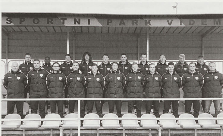
Članska ekipa NK Videm.