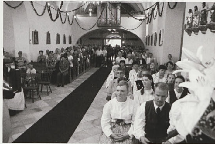
Notranjost Vidove cerkve po letošnji prenovi.

Leto, ki je za nami, je bilo leto mnogih sprememb. Preživeli smo trojne volitve: minoritske, ki so udarile v našo vidovsko skupnost. Hvala Bogu, da se zadeve urejajo. Na državni ravni se ni zgodilo nič novega, razen davkov, ki nas bodo udarili.