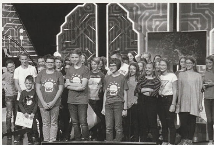
Videmska ekipa v oddaji Male sive celice

Že dejstvo, da smo se med približno 500 ekipami uvrstili med 36 najboljših, je pohvale vredno, na dejstvo, da smo se uvrstili še v nadaljnje tekmovanje, pa smo res ponosni.