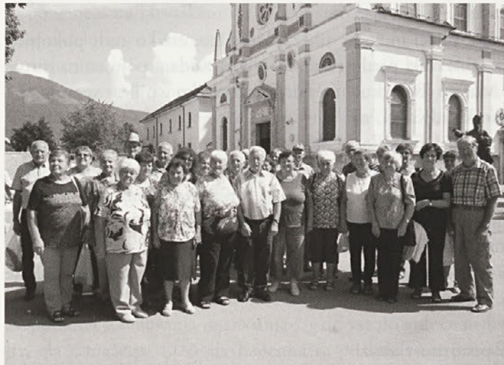
Skupinski posnetek pred Marijinim svetiščem na Brezju

Upokojenci smo v oktobru sodelovali tudi pri čiščenju doma krajanov v Doleni. Dom je namreč dobil nov nadstrešek. Delovna akcija je obsega čiščenje notranjosti in zunanosti doma ter okolice.