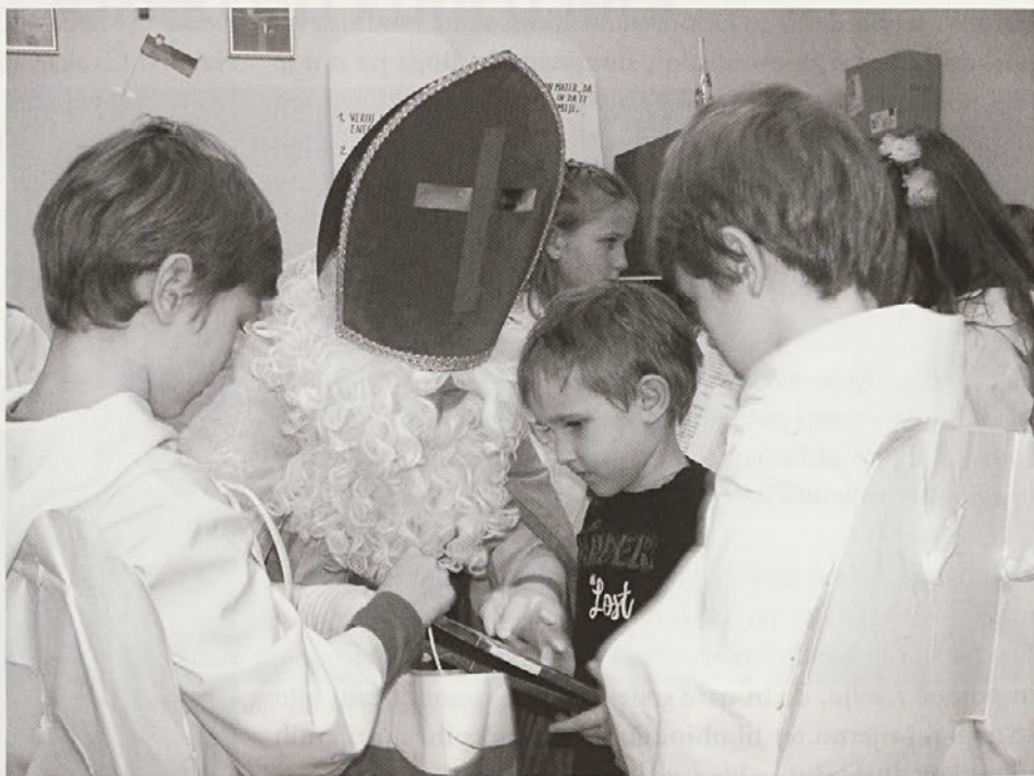
Snidenje s sv. Miklavžem na Selih