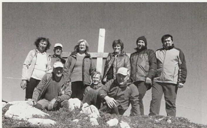
Veliki Zvoh.