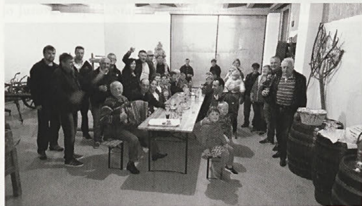
Letošnje martinovanje v Šturmovcih

L etošnja letina grozdja je bila tako bogata, da smo se zelo veselili martinovanja, ki smo ga v okviru martinovanja v občini Videm organizirali prvo novembrsko soboto.