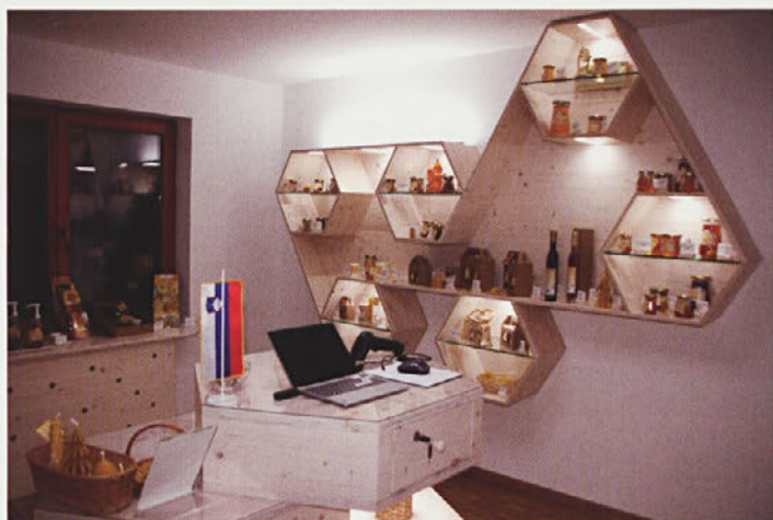
Prijeten pogled v prodajni kotiček Čebelarstva Šibila, ki je v prazničnem decembru bogato založen.

Prodajni kotiček so uredili zelo modno, posebej pa so se pri urejanju prostora posvetili izbiri naravnih materialov. Smrekov les je ena od posebnosti, ki daje prostoru pridih domačnosti. Police so že napolnili s svojimi izdelki, v ponudbi pa imajo več vrst medu, matični mleček, cvetni prah, vosek, propolis, medene pijače, sveče iz čebeljega voska in še kaj. Vse izdelke Čebelarstva Šibila je mogoče dobiti v najrazličnejših