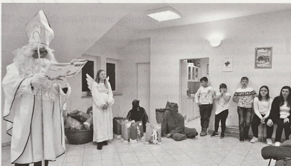
Utrinek z miklavževanja v Lancovi vasi

Dvorana je bila tudi letos dobro zasedena, saj so na srečanje prišli številni otroci iz domače in sosednjih vasi. Najmlajši folklorniki FD Lancova vas so se pod mentorstvom Katje Brodnjak najprej predstavili z nekaterimi ljudskimi plesi, nato pa so skupaj medse priklicali dobrega moža. Ta je na pot tudi letos vzel svoje spremstvo, angela in parklje. Najbolj pogumni so se mu pridružili in mu tudi kaj zapeli ali zmolili, spet drugi so iskali varno zavetje svojih staršev. Sledilo je obdarovanje otrok, skupno