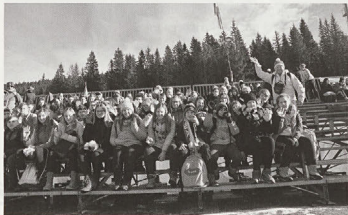
Na ogledu tekem svetovnega pokala v biatlonu na Pokljuki