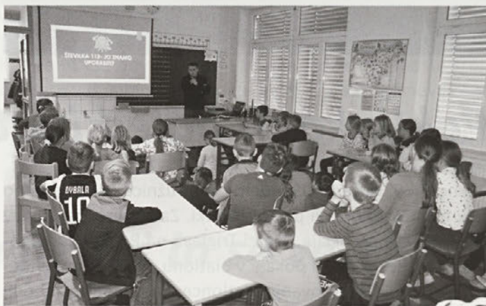
Učencem OŠ Sela so letos na kratkem predavanju spregovorili o klicu na številko 112.