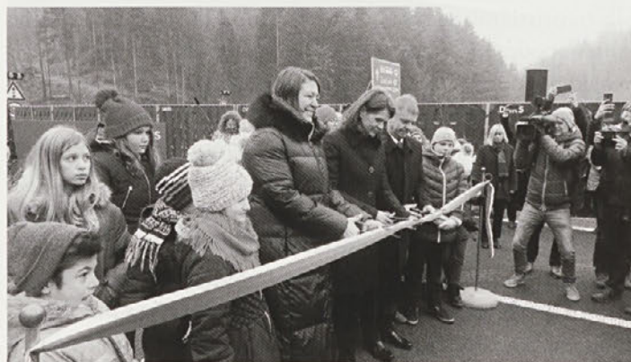
Slavnostni trenutek na novi podravske avtoceste.