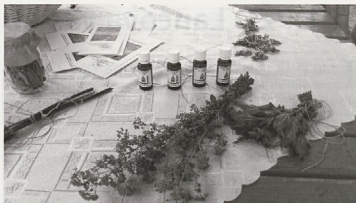
Naši čaji in drugi zdravilni domači izdelki iz leta 2018 ...