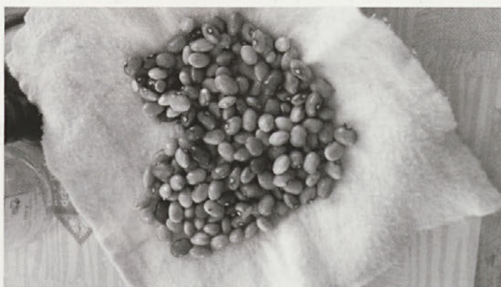
Mladi fižol je v naših krajih zelo dober in polnovreden obrok ...