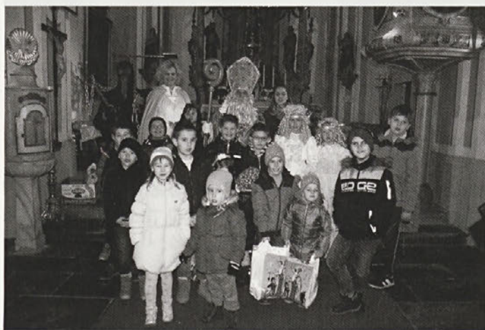
V družbi sv. Miklavža