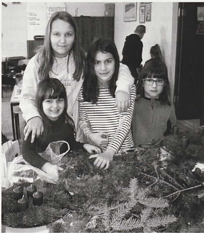
Na prvi delavnici so otroci izdelovali adventne venčke.