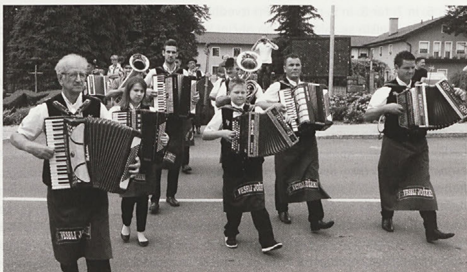
Veseli Jožeki na letošnji Vidovi nedelji.

Spoštovani člani mnogih društev v naši občini Videm, Veseli Jožeki vas prosimo, da poskušate svoje dejavnosti prilagoditi temu datumu, saj boste s tem marsi-