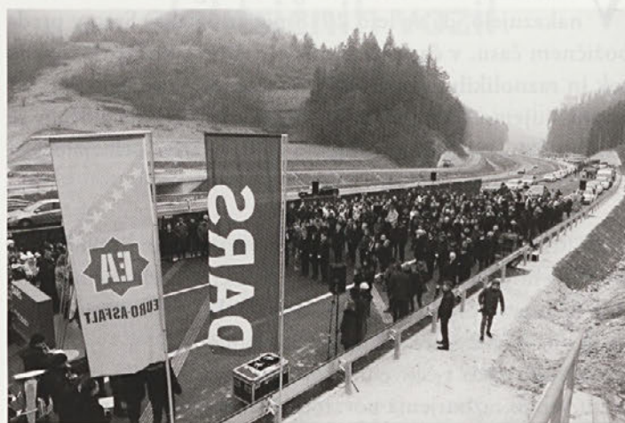
Dokončan je še zadnji del podravske avtoceste od Podlehnika do Gruškovja.

Pogodbeni izvajalec del na odseku med Podlehnikom in Gruškovjem je bil sarajevski Euro-Asfalt, pogodbeni vrednost del