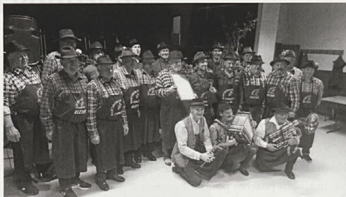
Z letošnjega pobreškega martinovanja, ko je prisegel novi kletar in prevzel ključ pobreške kleti.