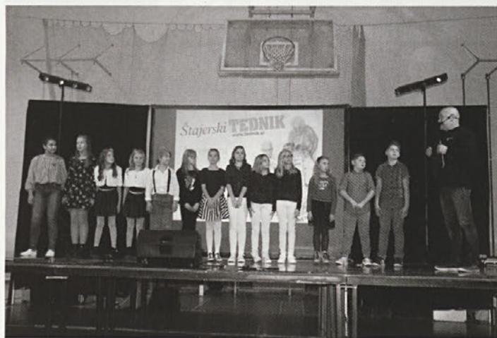
Na prireditvi Otroci pojejo slovenske pesmi in se veselijo

V četrtek, 15. novembra, smo v sodelovanju z Občino Videm in družbo Radio-Tednik Ptuj v športni dvorani šole Videm, ki je bila nabito polna, izpeljali že 5. prireditev Otro-