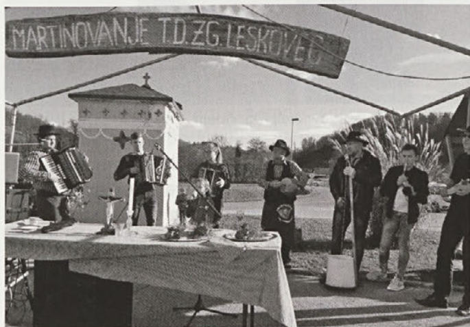
Turistično društvo je uspešno izpeljalo tradicionalno leskovško martinovanje.