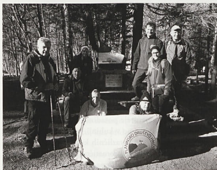
Kekes (1014 m), najvišji vrh Madžarske