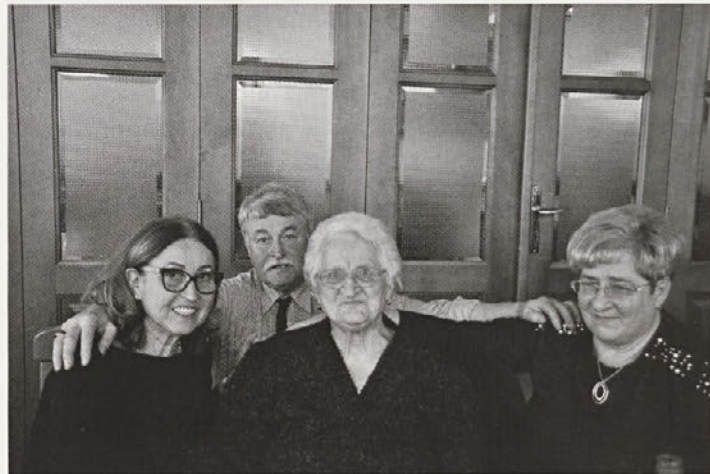
Slavljenka v krogu svojih najdražjih.

Slavljenki tudi naše iskrene čestitke in dobre želje!