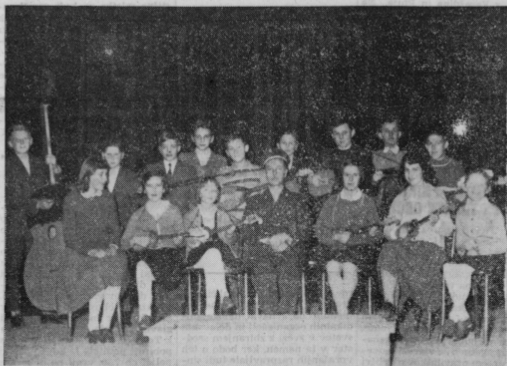
Tamburaški zbor v Majšperku po koncertu