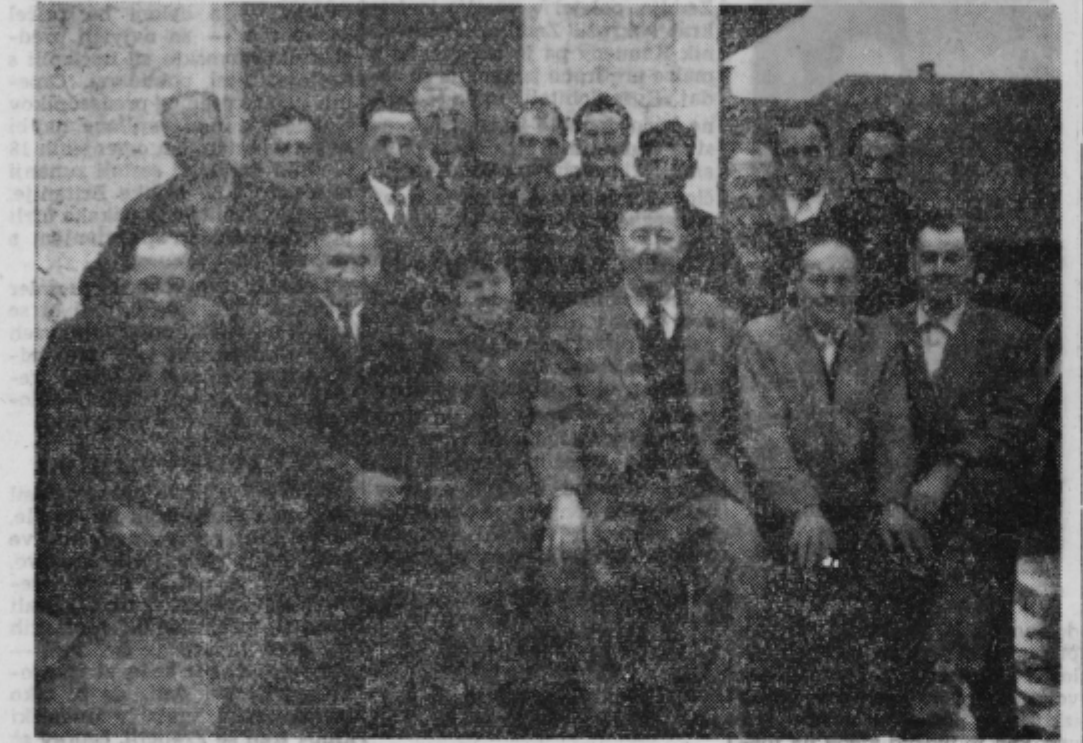
Enajsto leto jim že teče pri podjetju »Gradnje«. Za desetletnico službovanja so prejeli nagradne ure

no, samo potrdijo, kar so trije ali štirje predlagali, tako da razen teh treh ali štirih članov, sklepov urbanističnega sveta nikdo drug ne more ovreči ali kakorkoli premakniti.