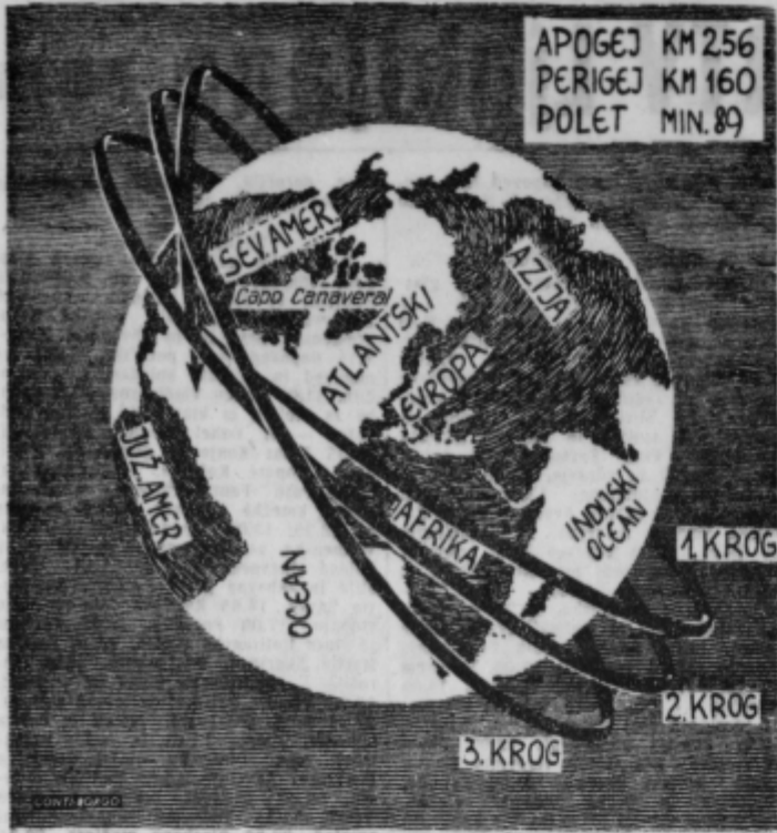
Prvi ameriški vesoljski potnik John Glenn je 20. februarja z raketo 3-krat obkrožil Zemljo. Risba kaže pot njegove rakete