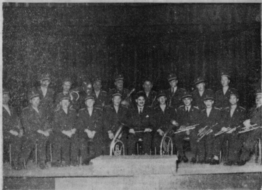
Gouna na pihala DPD »Svobode«