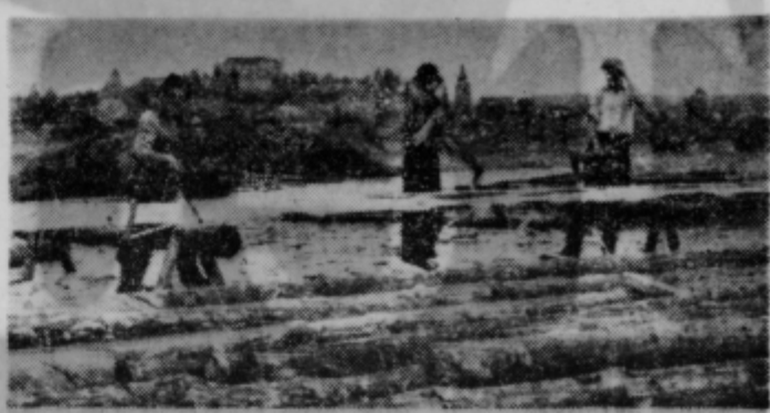
Dela pri graditvi perutinarskefarme še vedno v polnem teku.