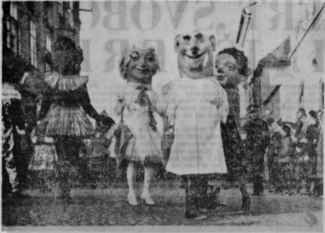
Pet zanimivih »leptic« na lanskem ptujskem karnevalu