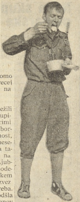
▲ Po napornem pohodu tekne tudi enolončnica ali kaj podobnega

Za nami je že vrsta uspešnih akcij. Udeležili smo se tradicionalnega pohoda »Ob žici okupirane Ljubljane« z eno tekmovalno in s štirimi ekipami v manifestativnem pohodu. Naši taborniki so pokazali res izredno požrtvovalnost, hkrati pa poželi tudi lepe uspehe. Pred mesecem dni smo se udeležili tudi republiškega taborniškega športnega tekmovanja v šahu, na mižnem tenisu in streljanju, ki je bilo v Ljubljani. V skupni uvrstitvi smo bili tretji. Sodelovali smo tudi na drugem taborniškem festivalu na Bledu. Udeležili smo se še zveznega orientacijskega pohoda v okolici Zagreba. Na akcijo »Po poteh AVNOJA« v Jajce je odšla pred desetimi dnevi večja skupina članov naše organizacije. Tam taborijo skupaj z drugimi jugoslovanskimi taborniki. Taka oblika stikov z vrstniki iz drugih bratskih republik je zelo primerna za izmenjavanje izkušenj in za medsebojno spoznavanje. Konec tega meseca bosta odšla na štirinajstdnevno taborjenje