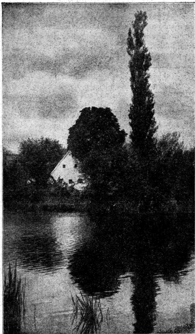
Pokrajina v poletju.

Prišla je babica. Vsi hkrati so jo zagledali na pragu. Velika je bila, da je pokrila ves prostor v vratih. V otrokih je vstalo čustvo, kot vstane, kadar zaslišijo posebno hupo reševalnega avta, kadar zdrči mimo hiše po cesti. Svoje poglede so zapičili v podolgovati kovčeg.