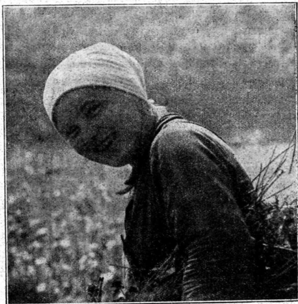
Na cvetočem travniku.

Mnogobojne so sanje: otroško nedolžne, dekliško čiste, fantovsko drzne. Sanje sladkih upov, sanje prerrojene iz spominov, iz hrepenenj, sanje iz že