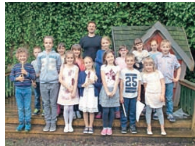
Nastopajoči učenci Glasbene šole Skalar

Učenci Glasbene šole Skalar so osvojeno znanje predstavili zbranim na zaključnem nastopu.