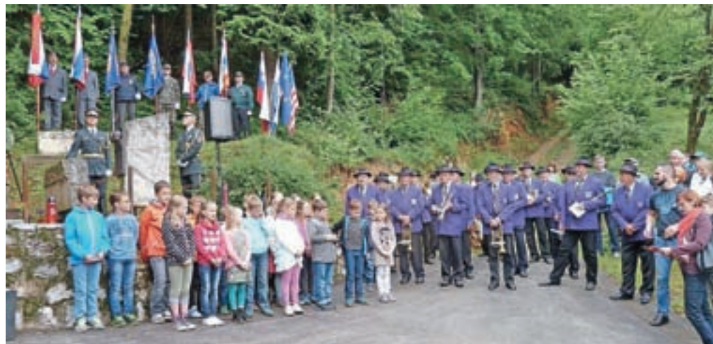
V kulturnem programu so nastopili učenci Podružnične šole Zgornji Tuhinj in člani veteranske sekcije Mengeške godbe.