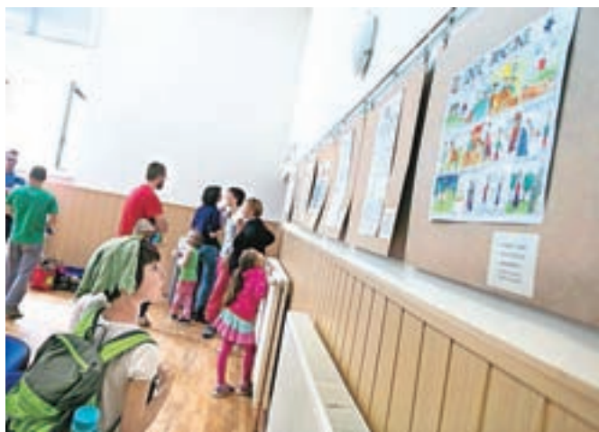
Na letošnjem likovnem natečaju na temo Križnikovih pravljič je sodelovalo kar 180 otrok.