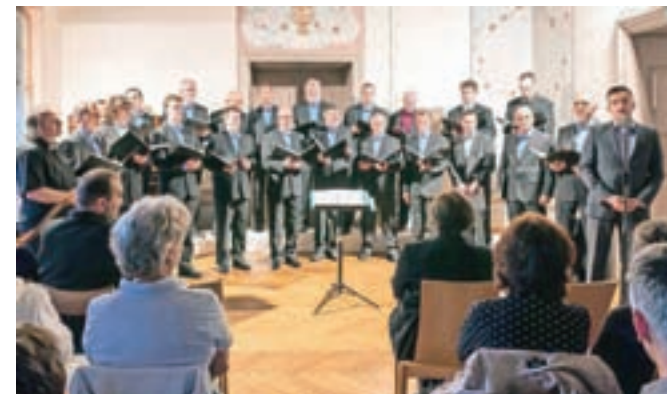
Pevci PSPD Lira so z lepo pesmijo in rujno kapljico na gradu Zaprice predstavili letošnjo pevsko sezono.

Že tradicionalno pripravljajo pevci PSPD Lira letni koncert na gradu Zaprice. Letos so zaradi slabega vremena ubrani glasovi lirašev namesto pod lipo zadoneli v grajski dvorani.