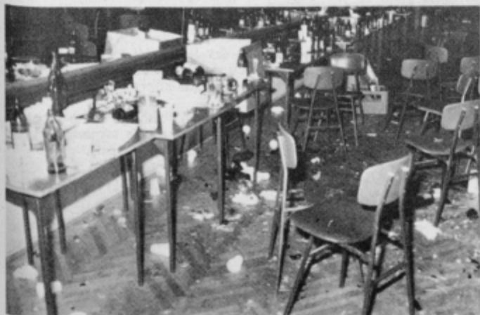
In še pogled na dvorano Narodnega doma, ki je zadnje čase postala osrednji veseljski prostor v Ptuj. Tako je bila videti po zaključni proslavi maturantov, vendar so vse kmalu počistili in škodo v celoti povrnili.