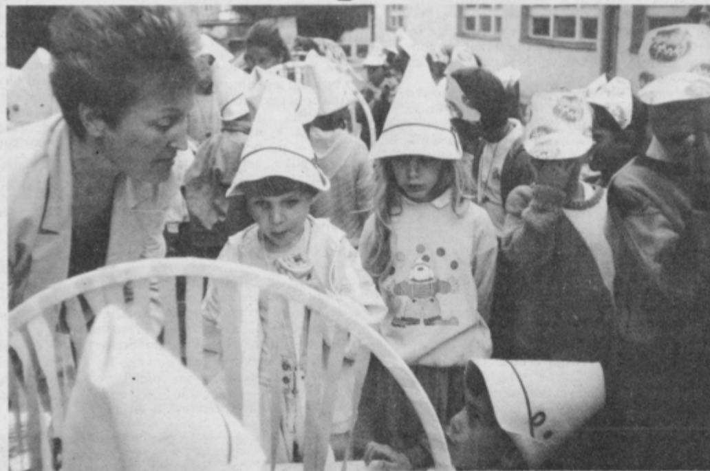
Nikoli več vrtec...

Nasvidenje vrtec, živela šola, bi lahko rekli temu živahnemu, breskrbnemu sprevedu mini maturantov in enot ptujkega vrta. Odrasli pa so verjetno razmišljali in jim želeli, da bi se naše razmere v prihodnjih letih, ko bodo drsali šolske klopi,