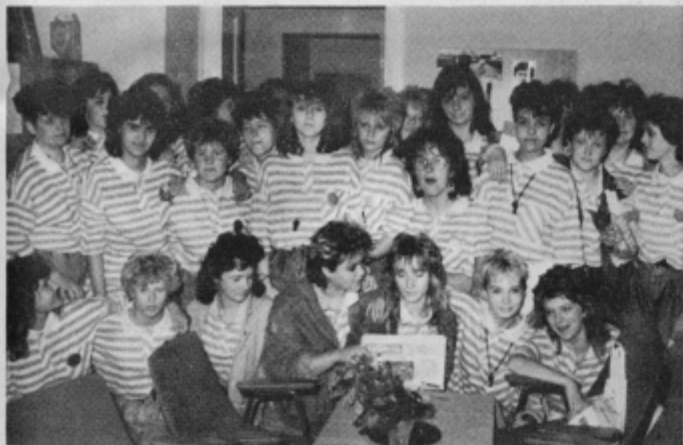
Med svojim pohodom se je skupina maturantk oglasila tudi v našem zavadu (glej Tednik v roki).

Naš stari Ptuj je bil spet poln maturantov, ki so s svojim življenjem in pohodom po mestnih ulicah izražali gnev nad dejstvom, da se poslavljajo od srednje šole. Kot smo izvedeli, je letos v zaključnih razredih Srednješolskega centra Ptuj okoli 400 učencev. Tokrat objavljamo nekaj razglednic z njihovega veseljačenja.