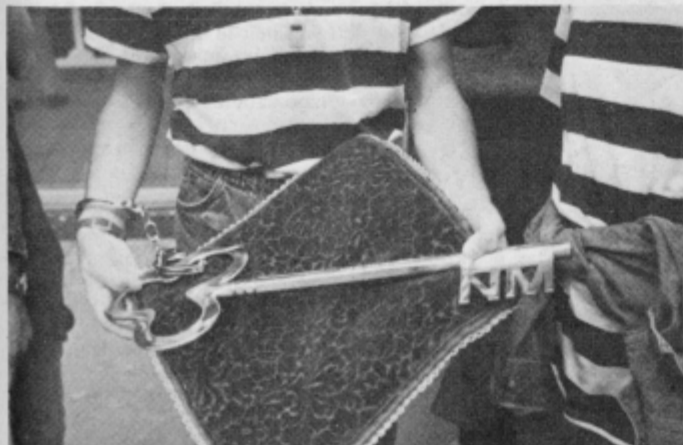
Ključ je treba skrbno varovati, zato si ga je eden od četrtošolcev na roko pripel kar z lisicami.