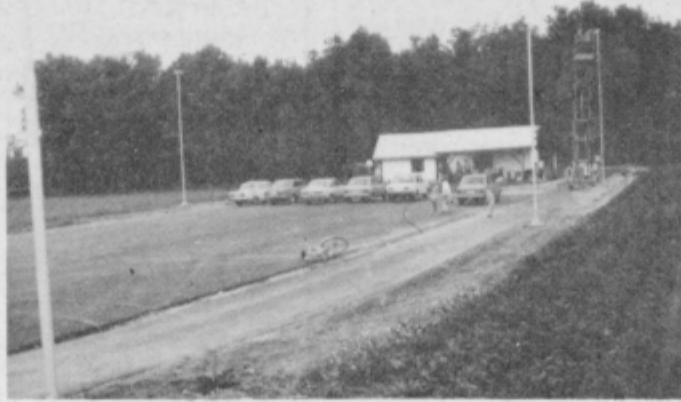
Novi objekti — ponos zagnanih Gorišniččanov

Prijave z dokazili o izpolnjevanju pogojev sprejema Kadrovska služba delovne organizacije 8 dni po objavi. Prosilci bodo dobili odgovore v 15 dneh po izvršeni izbiri.