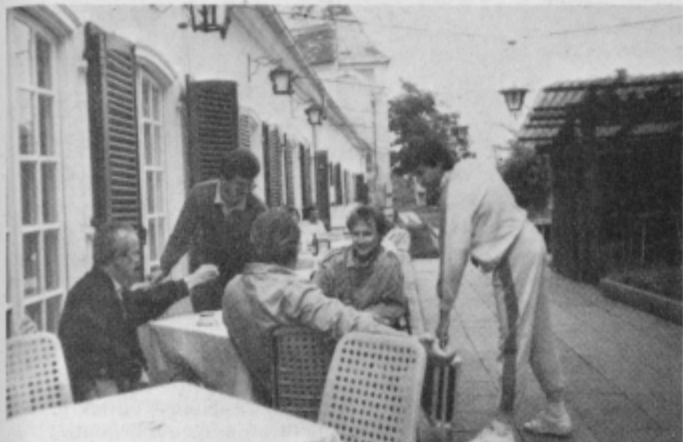
Posvet pred akcijo — za moč in pogum.

V tretje gre rado, smo pomislili v sredo (21. junija), ko smo se po končani oddaji zbrali na gradu, da bi preselili studio v nove prostore, ki so sedaj v naši hiši. Ampak o »dnevu X« smo tokrat raje molčali, ker smo se doslej že dvakrat po radijskih valovih bahali s preselitvijo, pa ni bilo nič. Tokrat je uspelo, kot ste se lahko na svoja ušesa prepričali v četrtek, 22. junija, ko ste nas slišali iz novega studia. Kako pa je akcija potekala, pričajo fotografije.