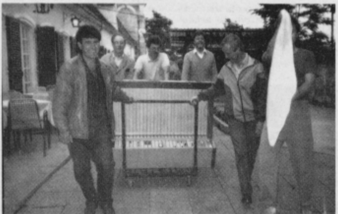
Ob mrmranju žalne koračnice in s krpo na pol droga smo popeljali mešalno mizo na njeno poslednjo pot.