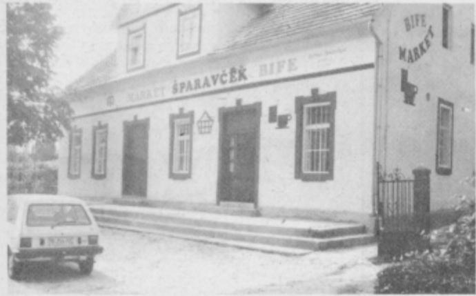
Hiša je kljub obnovi ohranila nekdanjo podobo