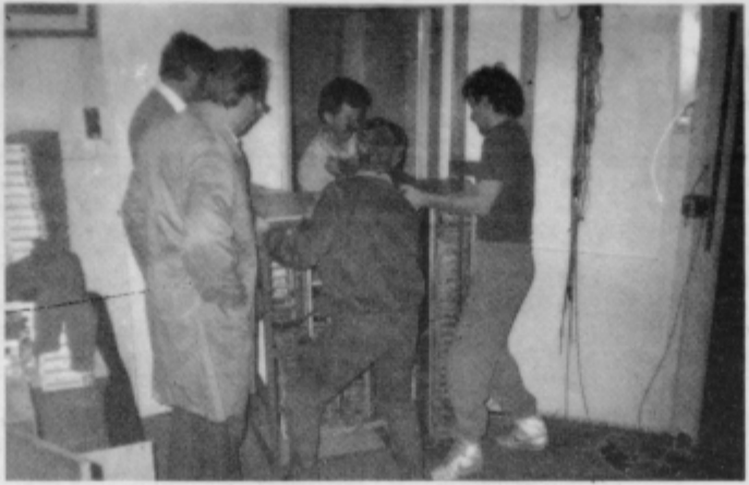
Le kdaj so se vrata tako skrčila?