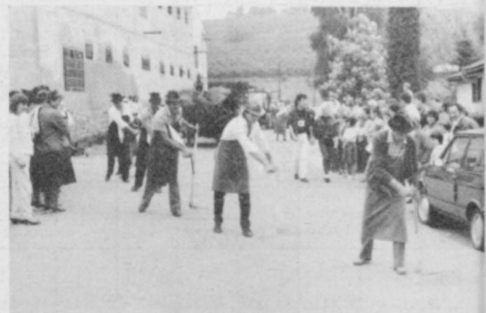
Prikaz starih kmečkih običajev — kosci