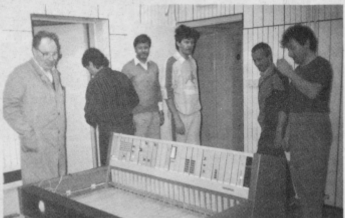
Misli v selitvi sodelujočih: