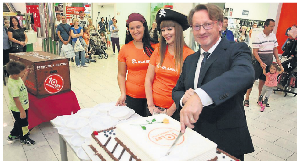
Odlično jubilejno torto so spekli v Sladkem butiku.