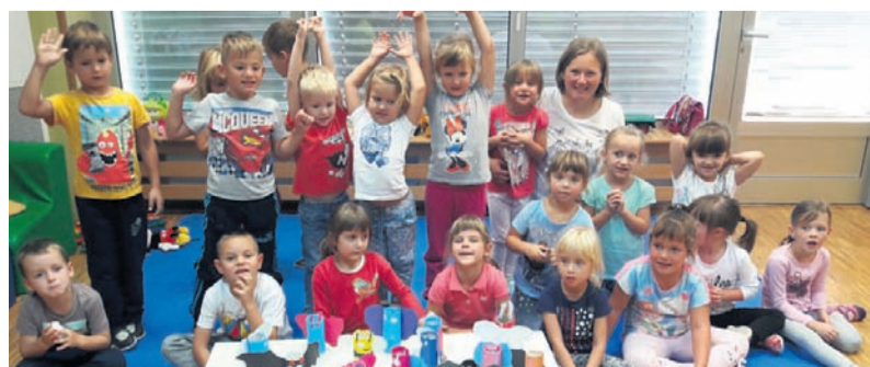
Otroci cirkulanskega vrtca so spoznavali rastlinski in živalski svet Haloz.

Mariborska območna enota Zavoda RS za varstvo narave (ZRSVN) je v Vrtcu Cirkulane pripravila delavnice z naslovom Haloze – Naravna in kulturna dediščina z roko v roki, pred gradom Borl pa predstavitev projekta Življenje traviščem.