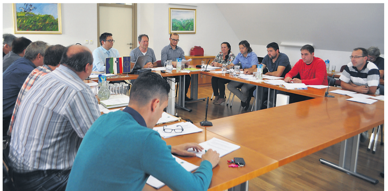
Občinski svet se (še) ni odločil za zmanjšanje števila svetnikov.