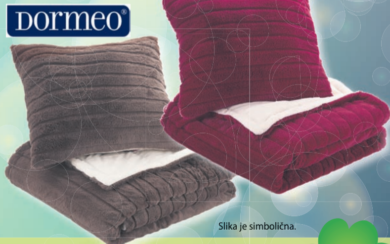
Slika je simbolična.

Nov set odeje in vzglavnika Dormeo Warm Hug bo hitro postal vaš najljubši spremljevalec v hladnejših dneh, saj ponuja prav vse: prijetno toploto ter razkošen in izjemno udoben objem. Ta prijeten in trendovski set v trenutku ustvari udoben kotiček za počitek in je na voljo v kombinaciji dveh barvnih odtenkov, ki se prilagata vsakemu prostoru. V njegovo mehko udobje se boste zaljubili že pri prvem objemu!