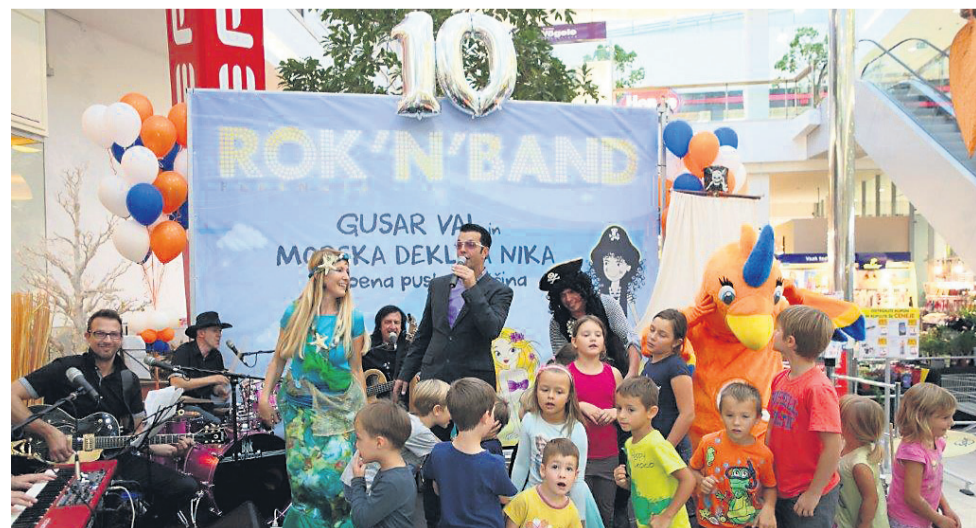
Rock'n'band je zabaval vse generacije, pomagala pa sta tudi gusar Val in morska deklica Nika.

skovalce in kupce, ki so na petkovo slovesnost prišli od drugod, pa povabil, naj se še vračajo v najstarejše slovensko mesto, ki ima veliko pokazati. (MG)