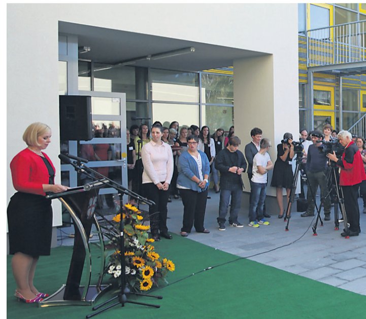
Nova šola je uradno odprla svoja vrata.