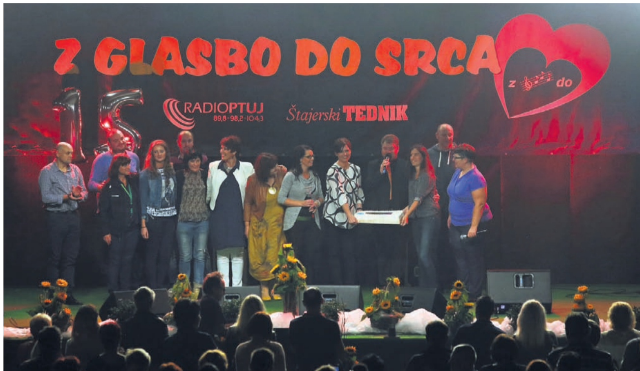
Sodelavci družbe Radio Tednik so poskrbeli za torto presenečenja.

oddajo Z glasbo do srca, v kateri predstavlja slovensko zabavno glasbo in zabavno glasbo iz držav bivše skupne države oz. glasbo, ki je v drugih radijskih oddajah čez dan ni slišati.