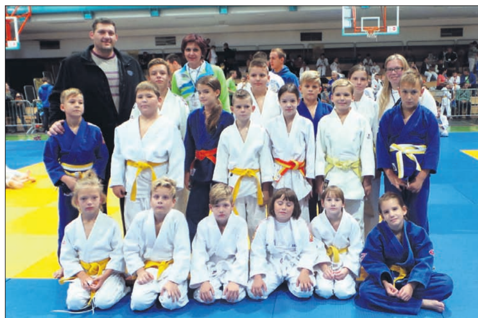
Številčna zasedba JK Drava Ptuj na tekmovanju v Oplotnici