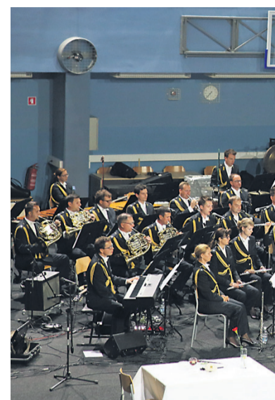
Orkester Slovenske vojske je navdušil.