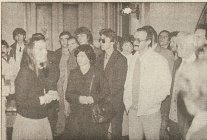
Na ogledu Narodne galerije