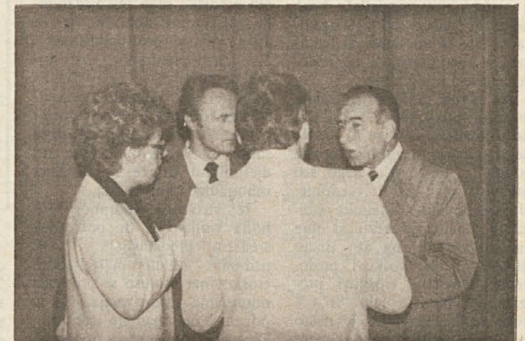
Del Pionirjevega zastopstva med pogovorom