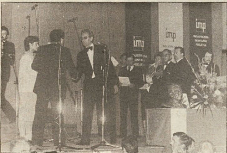
Dirigent našega pevskega zbora sprejema priznanje