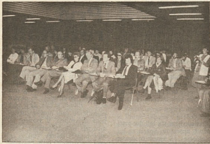
Sprejem v domu DPO Ljubljana-Bežigrad