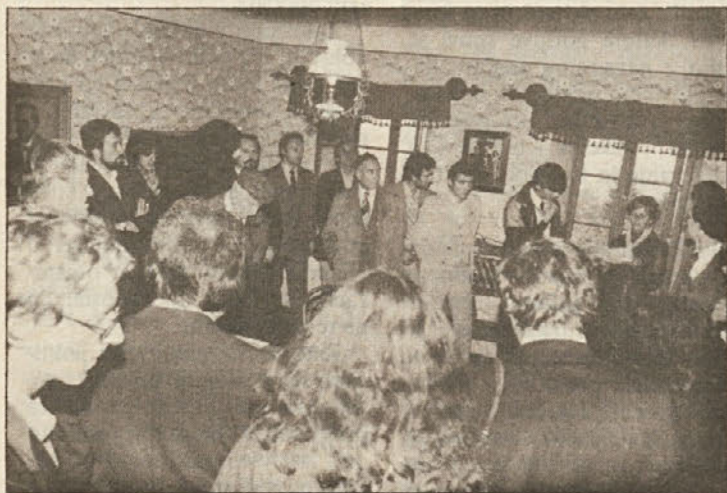
V Cankarjevi spominski sobi na Rožniku