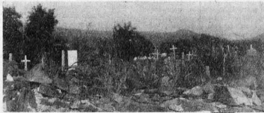
POGLLED NA PORCINJSKO POKOPALIŠČE. TUDI TU SE ODRAZA VELIKA ZAOSTALOST IN ZAPUŠČENOST.

Komun bi se muoru kar naprej interesirat par kompetentnih autorita, da bi se začela pogajanja s tozačevnimi organii sosednje države, zaki samo takuó se bo moglo rešiti pereče vprašanje vode v dreškem komun.