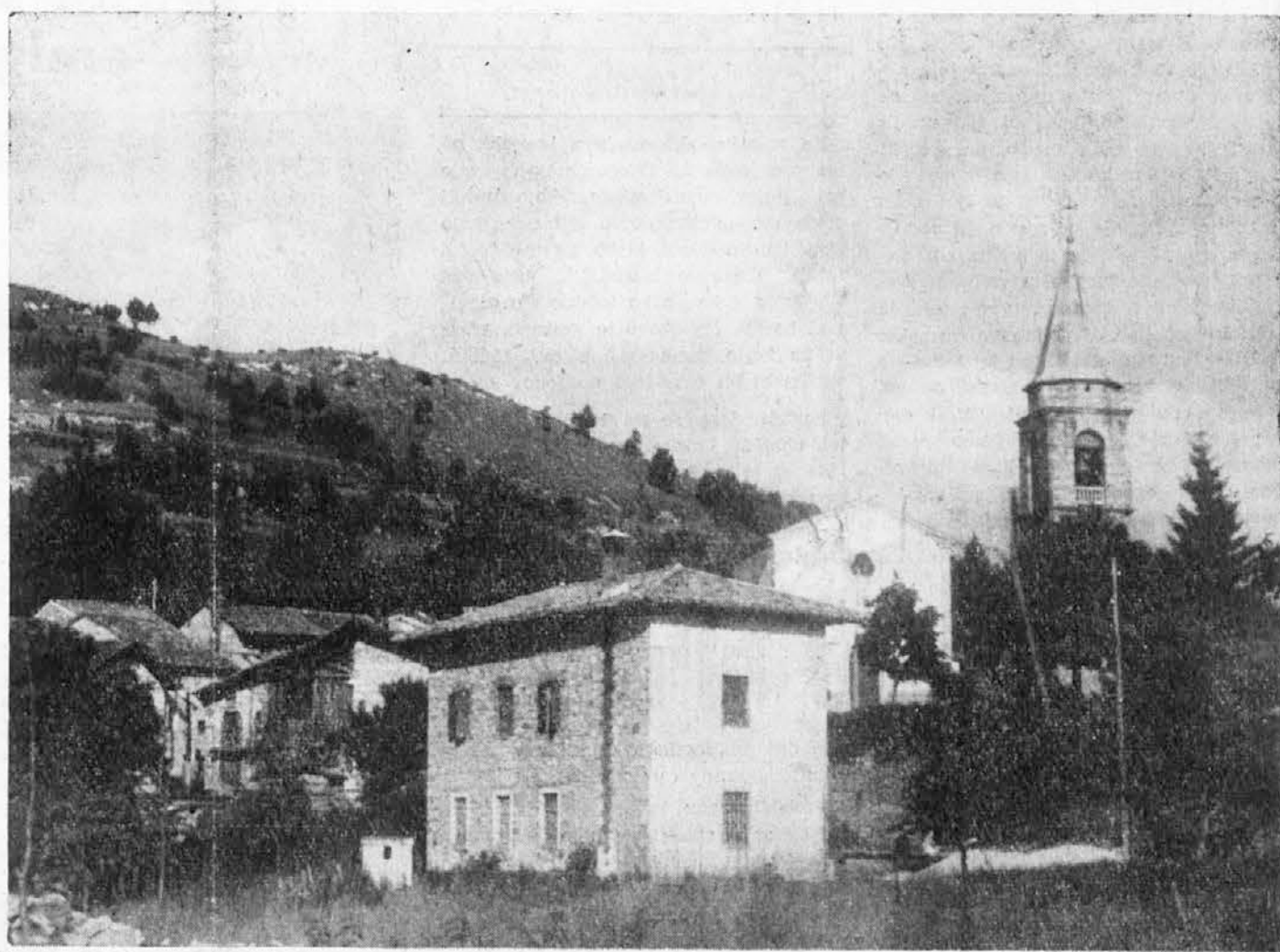
To je Porčinj, mala vas v zapadni Beneški Sloveniji, o kateri se zadnje čase zelo mnogo govori. Ljudje so v znak protesta zavrnil videmski prefekturi vse davčne pozive in jim priložili še spomenico, katero so podpisali vsi družinski poglavarji. Naveličani so prenašati vse tovare na hrbtu, ker so brez kolovozne poti, dasiravno jim jo obljublajo že 40 let. Porčinj je štel 1920. leta 300 prebivalcev, danes jih ima pa komaj 120. Od Ahtna, kjer je sedež komuna, je oddaljen le 5 km, od Vidma pa 20. Med zadnjo svetovno vojno je bil Porčinj pozorišče hudih bojev, kajti tu so imele svoj sedež razne partizanske komande in zato so jih Nemci stalno napadali.

stane torej zaenkrat pri starem in homo govorili o industrijah kot o sanjah. Oblasti pa nas bodo še kar naprej tolažile s svojimi plani o conah depresih, zelenem planu in o melioraciji montanje, kar so tudi le na pol realne stvari in na pol pa sanje.