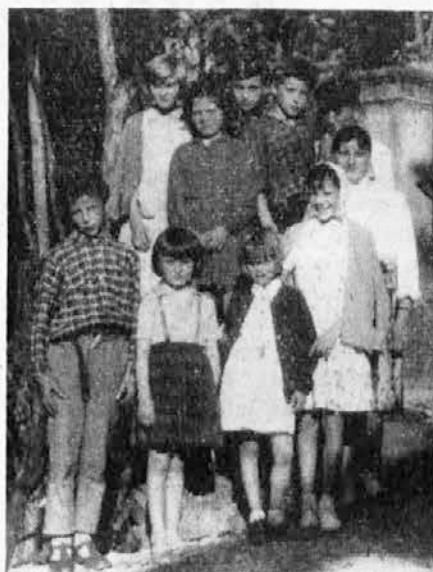
SKUPINA OTROK IZ UTANE, PRI SV. LENARTU.

»Prava, se je nasmeljal skopuh. »Dobite takoj, kar vam gre. He, žena, prinesi mi brž mojo mošnjo z denarjem!«