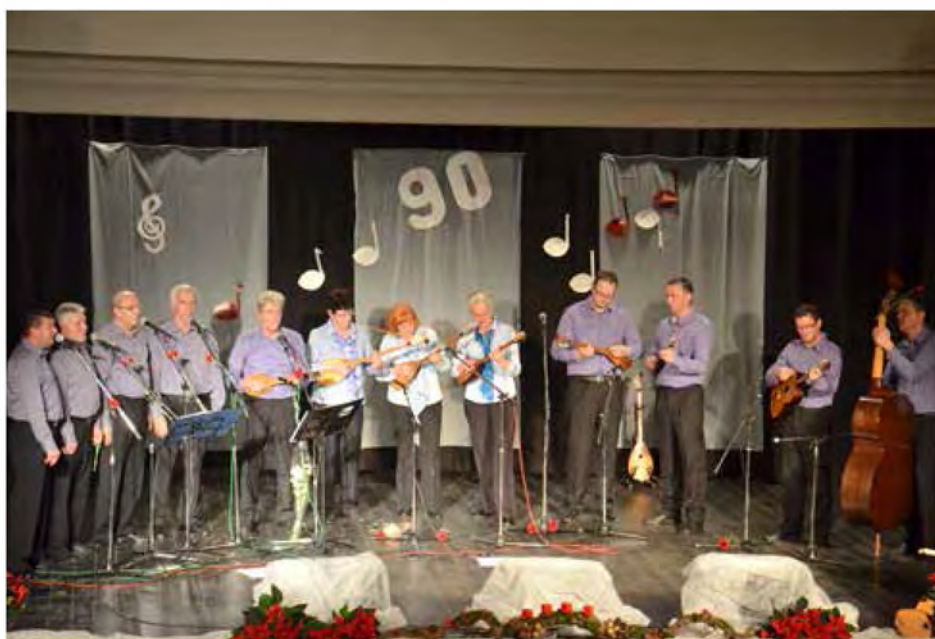
Ob 90-letnici delovanja taburaške skupine so strune naših taburašev zadonele še posebej svečano

Velika prepoznavnost naše tamburaške skupine je v tem, da igrajo na