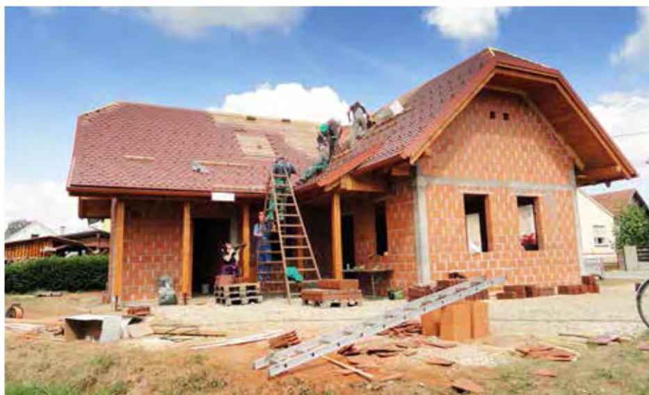
Bratonska hiša bo namenjena domačinom in turistom

TD hišo smo s sredstvi društva (cca 20.000), sredstvi KS Bratonci (parcela + cca 11.000) in s sredstvi Občine Beltinci (cca 20.000) postavili pod streho. Želimo si, da bi hišico dokončali, za kar potrebujemo še cca. 40.000 do 50.000 EUR. Vemo, da so nekatere KS v Občini Beltinci za podobne objekte, tudi na račun državnih ali evropskih razpisov, prejele iz proračuna več sredstev (po mojem ni pomembna lastnina – občina ali KS) in da se gradijo s sredstvi proračuna športni objekti, kar si je KS