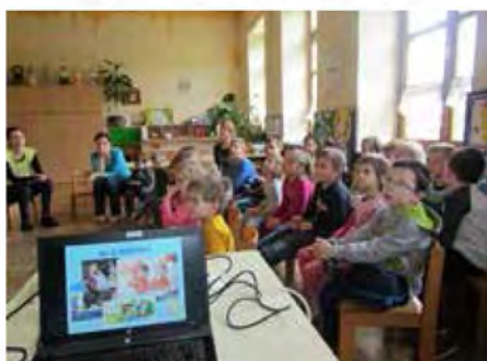
Vrtec Lendava, enota Hotiza, 22.1.2014