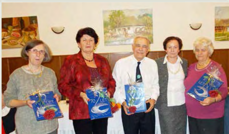
Skupinska fotografija 70. letnikov

»Zadovoljen človek ne pričakuje od življenja več, kot mu življenje da. Zadovoljen človek dela čudeže: mnoge težave, ki druge strejo, se mu umaknejo s poti.