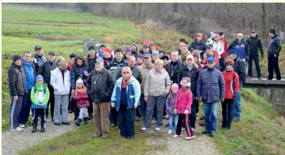
Skupinska fotografija pohodnikov pri "Krtači"

Prva sobota v novem letu je pri članih KK TIM MLIN in naših prijateljih že tradicionalno rezervirana za Novoletni pohod. Tokrat smo ga organizirali že sedmo leto zapovrstjo. V prijetnem sobotnem dopoldnevu smo