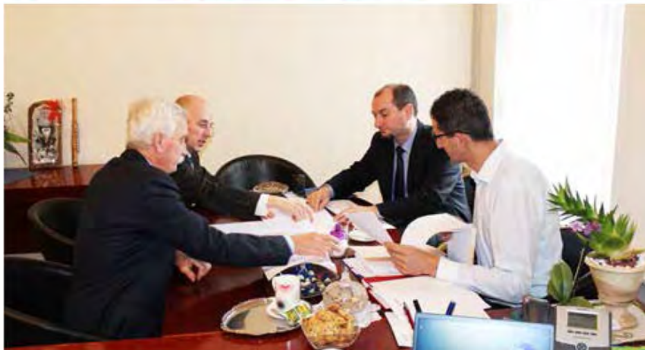
Premik iz mrtve točke industrijsko-logistične cone na pobudo Občine Beltinci

Dejavnost Luke Koper ima v sodelovanju z Občino Beltinci velik potencial za ustvarjanje novih delovnih mest v Beltincih.