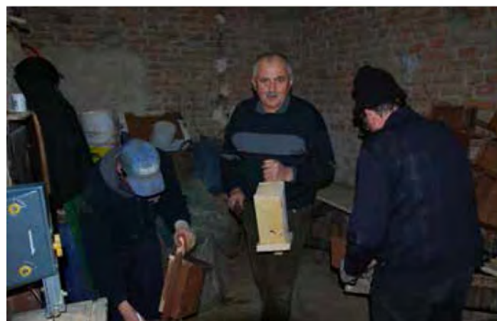
Ptički se bodo ženili 12. marca, na Gregorjevo, zato so skrbni občani izdelali in pobarvali 50 valilnic za siničke