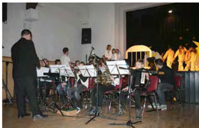
Združitev več vrsti umetnosti je bila velika želja številnih umetnikov, profesorjev Glasbene šole Beltinci