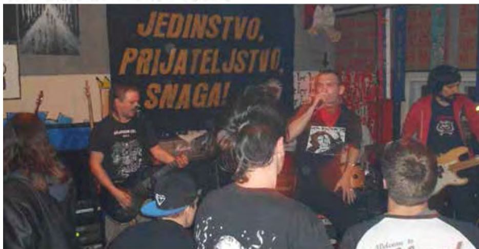
Aktivna propaganda, 29. 12. 2013

Isti organizatorji so 9. januarja, na »mali petek«, v goste povabili dva zagrebška benda. Ženski trio »Žen«, audio-vizualni bend, ki meša zvoke in barve v kraut-post-math-synth-elektro-sanjavo-psy-indie-rock izkušnjo, ter Seven Mouldy Figs (7MF), katerega glasbeni stil najlažje definiramo z oznako post-punk rock. Hrvati so se pri nas počutili precej domače, vsled čemer se je posledično druženje z obiskovalci in našimi