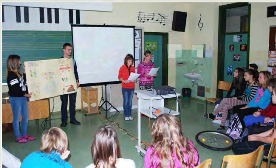
Na otroškem šolskem parlamentu smo razpravljali o razmerah v družbi

Zanimivo je, kako kulturno in z veliko pozitivne energije so predstavili čas, v katerem odraščajo. S svojih razmišljanjem in pobudami o boljši družbi in pravičnejšem jutri so presenetili zbrane odrasle. Opozorili so na pomen empatije in medgeneracijskega sodelovanja ter reševanja konfliktov na miren, odkrit in iskren način. Marsikateri odrasel parlamentarec bi se lahko od učencev veliko naučil, saj so v razpravi zelo iskreno, energično in vpljudno povedali, kaj si želijo v državi Sloveniji.