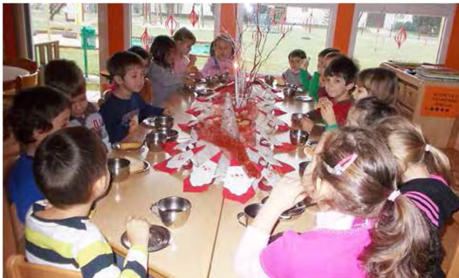
Praznično vzdušje smo si pričarali tudi pri mizi

December je čaroben, pravljичen in predvsem prazničen mesec. V vrtcu pa december prinaša vsako leto izzive za zaposlene. Le zakaj? Zato, ker si želimo, da otroci spoznajo in doživljajo praznike v pravi luči. Našim otrokom želimo pripraviti praznično vzdušje, kot je bilo nekoč. Skromno in pristno. Sedaj nas že v novembru dobesedno oblegajo Miklavži, dedki Mrazi, božički in drugi pravljичni liki iz vsake trgovine,