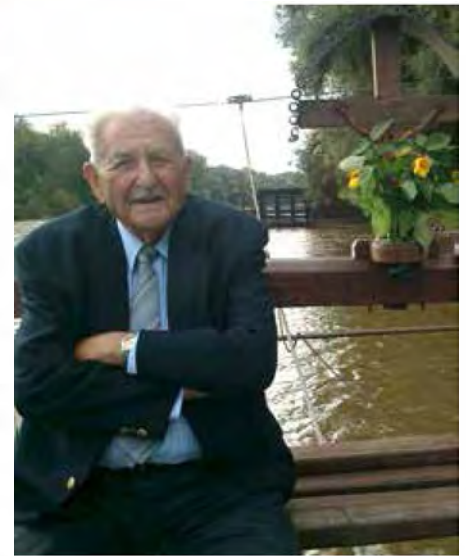
V spomin beltinskemu židu