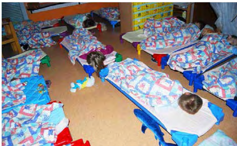
Ko sladko zaspimo

Posebej nestrpno pa smo čakali dan, ko bomo prespali v vrtcu. Z navdušenjem smo odštevali dneve, se pogovarjali, pisali sezname, kdo vse bo prespal, kaj bomo vzeli s sabo, kakšno pižamo