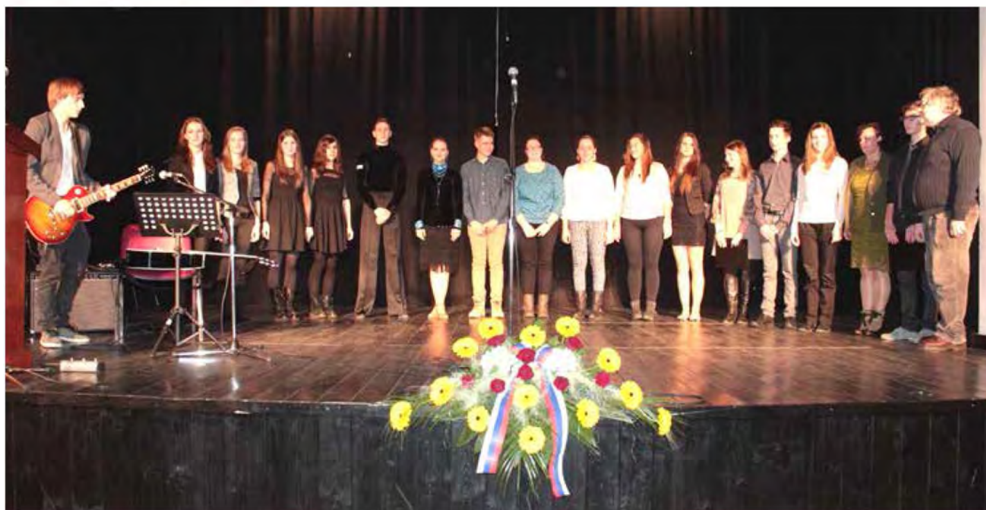
Ob kulturnem prazniku smo prisluhnili programu dijakinj in dijakov Gimnazije Murska Sobota

Kultura in umetnost sta si na predvečer slovenskega kulturnega praznika v Občini Beltinci podali roko.