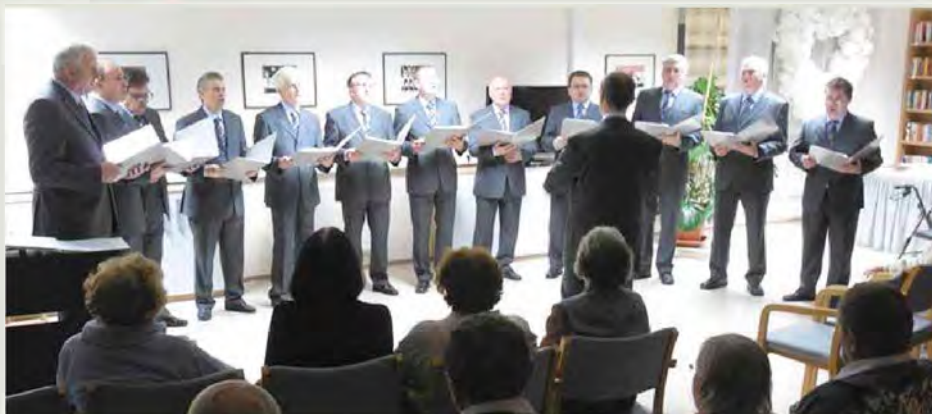
Člani MPZ Lipovci so v DOSOR-ju gostovali že tretjič