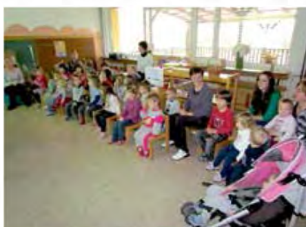
Vrtec Velika Polana, 23.1.2014

Likovna dela, ki so jih pripravili otroci: