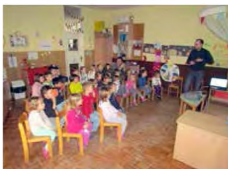
Vrtec Dobrovnik, 17.1.2014