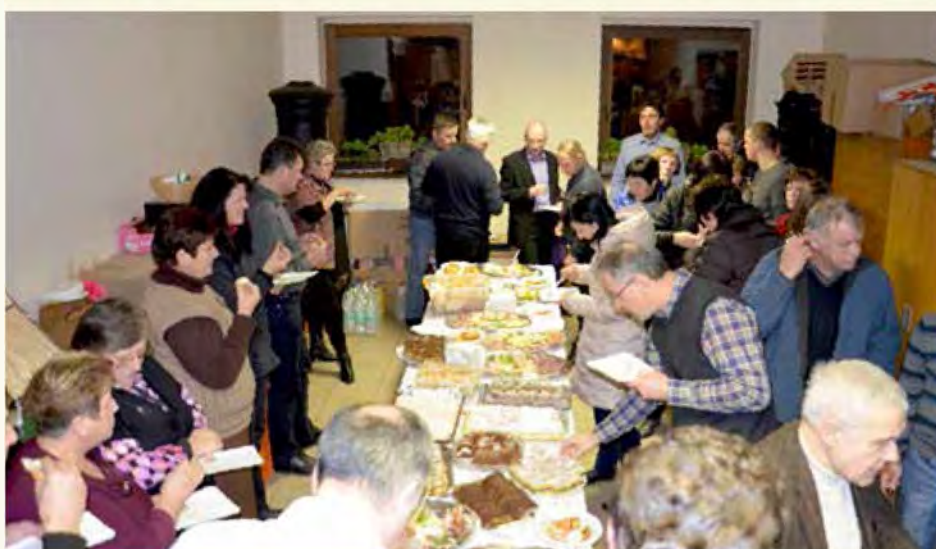
Po uspešno opravljenem zboru smo se pogostili