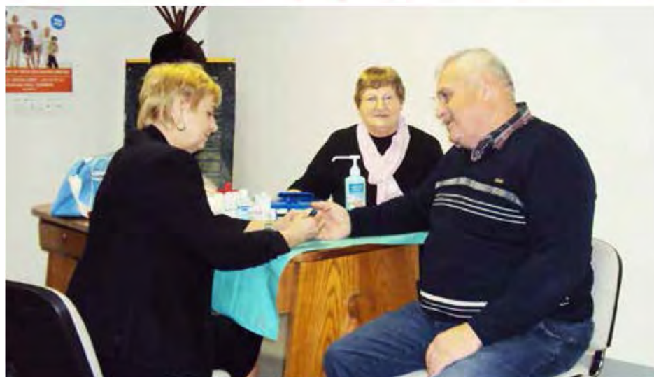
Na delavnici smo udeležencem izmerili krvni tlak, krvni sladkor, holesterol in trigliceride v krvi

Program dela DU Beltinci je v letu 2014 obogaten še z eno dejavnostjo: izvajanje meritev dejavnikov tveganja za nastanek in razvoj srčno žilnih bolezni in zdravstveno svetovanje. Omenjeno delavnico smo izvedli v prostorih društva upokojencev Beltinci januarja. Obsegala je meritev krvnega tlaka, krvnega sladkorja, holesterola in trigliceridov v krvi ter zdravstveno svetovanje. Namenjena je bila članom društva, izvedle pa smo jo upokojene medicinske sestre, članice društva. Meritev se je udeležilo 42 oseb. Z