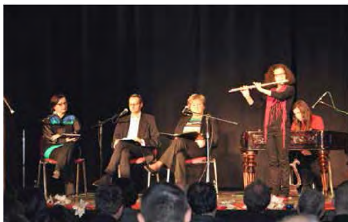
Kulturni program ob Dnevu samostojnosti in enotnosti je bil plod sodelovanja KUD-a Beltinci in Glasbene šole Beltinci