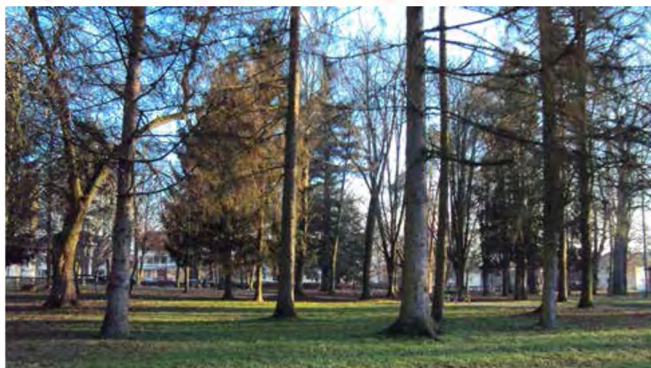
Beltinski park je bil od nekdaj navdih iskalcev lepote