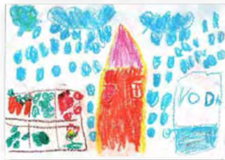
Teja Škafar, 5 let, Vrtec Beltinci, enota Bibe Beltinci »Zbiralnik vode – zalivanje vrta z deževnico.«

Likovna dela, ki so jih pripravili otroci: