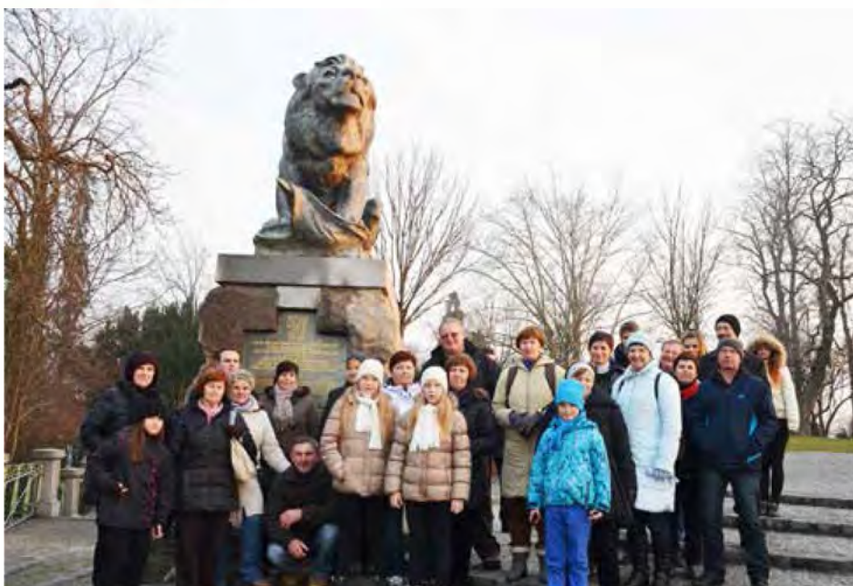
Spominska fotografija s čudovitega prazničnega Gradca

Leto se je obrnilo, kot da bi bilo na vrtiljaku. Proti koncu leta vsak človek hiti po svojih opravkih z namenom, da se bo čim lepše pripravil na božično-novoletne praznike, ki so polni skrivnosti in svetlobe. O tem, kakšno je praznično dogajanje v mestih, smo se pogovarjali člani Turističnega društva Lipa in padla je odločitev, da obiščemo praznični Gradec. Tako smo se proti koncu decembra odpeljali v Avstrijo. Avtobus je bil poln potnikov, ki so želeli doživeti predpraznični utrip tega mesta. Pot nas je vodila v nakupovalno središče Seiersberg, ki se nahaja na obrobju samega mesta. Tam smo imeli daljši postanek in priložnost za nakupe. Popoldan smo se sprehodili po mestnem središču. Ogledali smo si deželno hišo, katedralo, kapelo sv. Katarine s prečudovitimi freskami, z vzpenjačo pa smo se odpeljali na grajski hrib, kjer smo se proti večeru pridružili množici na božičnem sejmu.