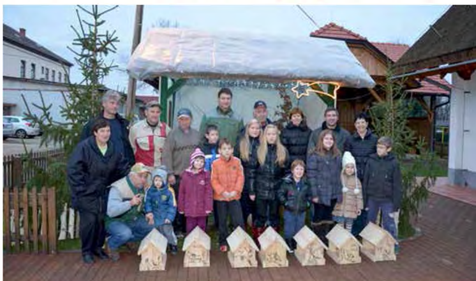
Vsaka krmilnica je dobila tudi unikatni motiv

Liplanski dedki so se v okviru Turističnega društva Lipa dogovorili, da bodo s svojimi vnuki mojstrovali ptičje krmilnice.