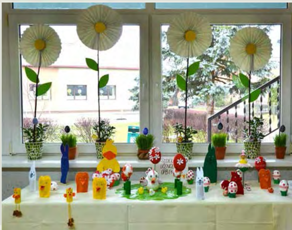
Razstavljeni velikonočni izdelki učencev podaljšanega bivanja POŠ Dokležovje od 1. do 4. razreda

Tudi letos bomo ustvarjali v delavnicah. V šoli in DPM bomo pod vodstvom mentorjev izdelovali izdelke iz odpadnega materiala: zajčke, piščančke, rožice. Krasili in barvali bomo jajčka. Vse to bomo skupaj z odraslimi člani razstavili na velikonočni razstavi. Tega se že zelo veselimo!