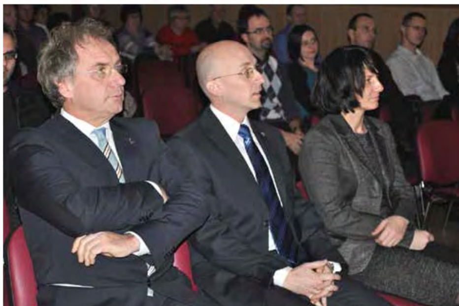
Slavnostni govornik, predsednik Združenja za vrednote slovenske osamosvojitve, gospod Aleš Hojs v družbi župana občine Beltinci s soprogo

Slavnostni govornik, predsednik Združenja za vrednote slovenske osamosvojitve, gospod Aleš Hojs, je v svojem nagovoru poudaril pomen naše osamosvojitve ter cenjenje vrednot, ki so povezane s tem za vse nas izjemnim dogodkom v zgodovini. Ko so ljudje usodo svojega naroda prevzeli v svoje roke in se