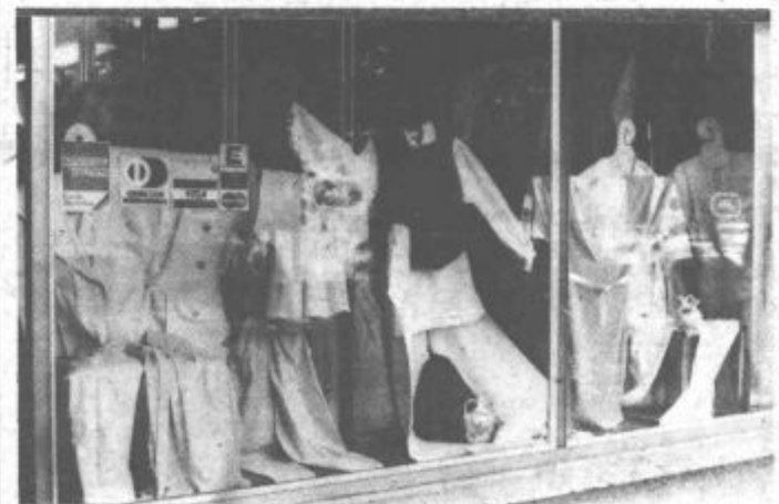
Izložba Utoka. Ne samo, da je vedno lepa, pogosto tudi spreminja svojo podobo.