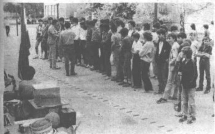
Takole je bilo pred odhodom. V teh dneh pa so mladi brigadirji morali že pošteno zavihat rokave.

Razen na mladinsko delovno akcijo, pa je okoli 40 mladih danes odšlo na usposabljanje mladincev prostovoljcev za enote TO, ki je že tradicionalno organizirano na Slemenu. Tokrat bo to usposabljanje še posebej zanimivo, saj so ga popestrili z vrsto novih aktivnosti.