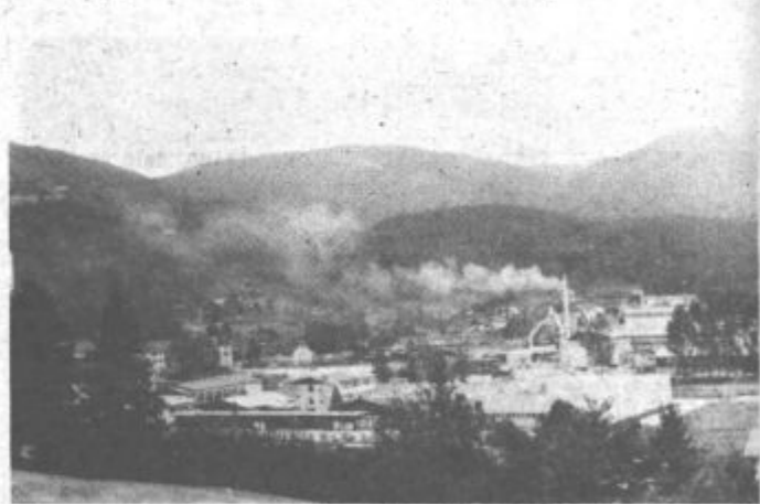
Industrijsko središče Gornje Savinjske doline se vse bolj širi

V slavje se bodo vključili tudi košarkarji. Športno društvo Vrbovec bo namreč v soboto pripravilo turnir, na katerem bodo poleg domačih nastopili še igralci iz Mute in Mislinje. Slavnostna seja skupščine krajevne skupnosti bo v soboto popoldne v delavskem domu. Po proslavi in bogatem kulturnem spredu bo na športnem igrišču na vrsti tovariški večer za prebivalce te krajevne skupnosti.