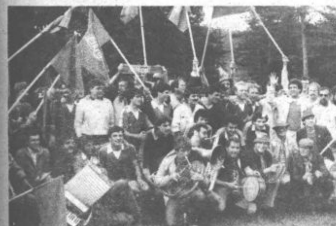
NAJVEČJI USPEH DOSLEJ — Nedeljski razplet dogodkov v območni nogometni ligi — vzhod je bil ugoden za nogometaše mariborskega Elkraja. Osvojili so prvo mesto in se pripravili nastopanje v slovenski nogometni ligi, kar jedeslej največji uspeh kluba in nogometa na tem področju sploh. Slavje je bilo zato še boljko večje.

Še enkrat vas vabimo, da pridete jutri v Dom kulture. Slišali boste tudi novi avizo, s katerim se bo odslej oglašal Radio Velenje ob ponedeljkih, sredah, petkih in nedeljah.