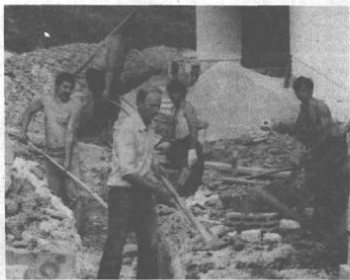
Z udarniškim delom hitreje do ceste, vode, elektrike in ogrevanja