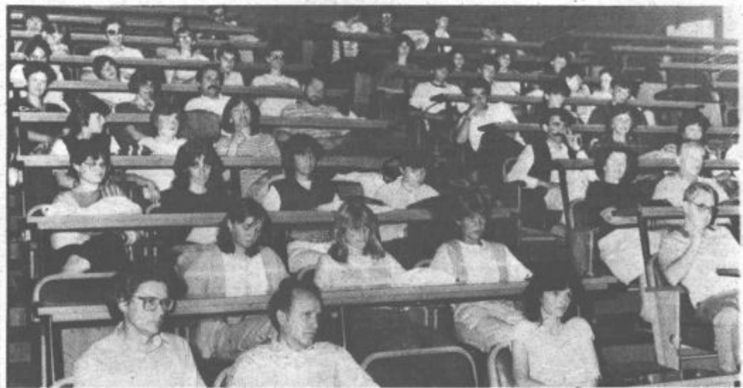
V njihove raziskovalne naloge je bilo vložena veliko truda in znanja

Nekatere naloge so, kot so poudarili ob podelitvi priznanj, izjemno kakovostne in daleč presegajo zgolj v šoli pridobljeno znanje mladih ustvarjalcev. V prihodnjih letih bodo prav kakovosti raziskovalnih nalog skušali dati še poseben poudarek.