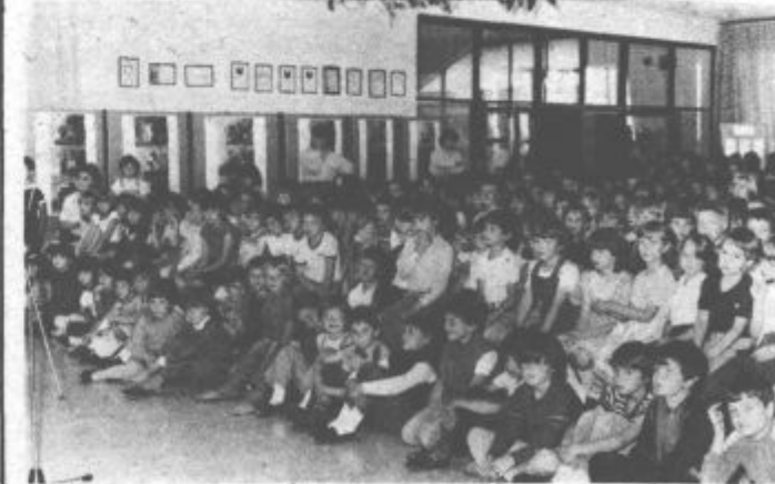
Najbolj prizadevnim so podelili priznanja

Omenili smo, da se je v občini Velenje na tekmovanju Storimo vse za zdrave zobe najbolj izkazala osnovna šola Veljka Vlahoviča, na tej šoli pa so svoje zobe najbolj negovali učenci 4. b razreda.