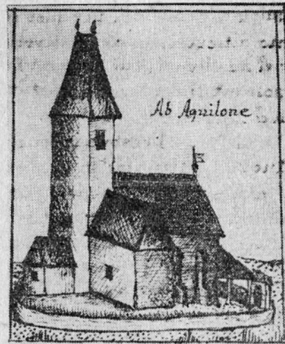
CERKEV V ZIDANEM MOSTU — (RISAL ZUPNIK GAJSNIK OKROG 1750)

ljevanju je bila objavljena slika kartuzije Pleterje in s pomočjo te slike lahko ugotovimo tudi položaj velikega hodnika in pokopališke kapele v Jurkloštru. Pokopališka kapela v Jurkloštru je bila verjetno na se-