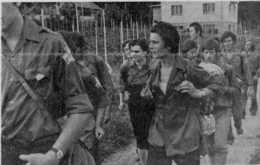
S POHODA PO POTEH OSVOBODITVE