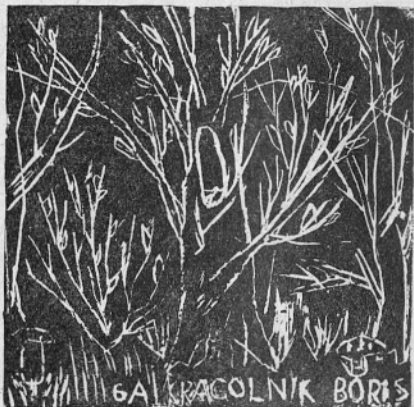
LINOREZ BORISA KRAGOLNIKA 6.a RAZRED OSNOVNE ŠOLE ANTONA AŠKERCA RIMSKE TOPLICE

Prav sredi vasi stoji moj dom. To je skromna vaška hiša z malimi ok-