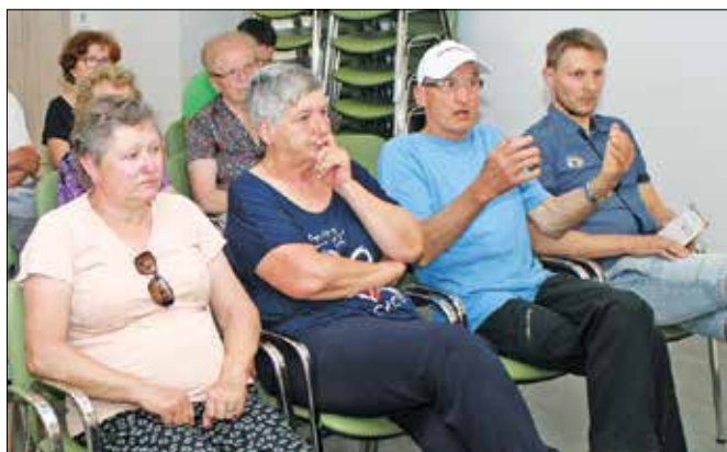
Prisotni so izražali nezadovoljstvo, da s pošto izgubljajo še eno od pomembnih storitev v občini.

Kot je povedala županja, je na sestanku povabila predstavnika pošte, da bi občanom pojasnila razloge za omenjeno odločitev. Povedala je, da je namera o ukinitvi poslovalnice znana že od leta 2015. Sama si je že pred izvolitvijo za žu-