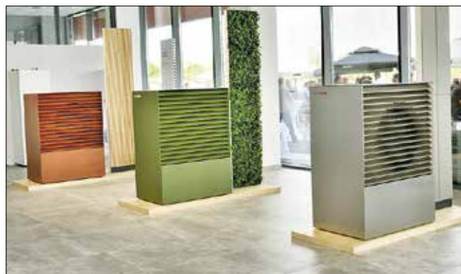
Barve in videz Kronotermovih toplotnih črpalke Adapt so prilagojeni različnim tipom gradnje in se zlijejo z okolico. (Fotodokumentacija Kronoterm)

Ustanovitelj družinskega podjetja Rudi Kronovšek je leta 1976 razvil prvo toplotno črpalko za segrevanje