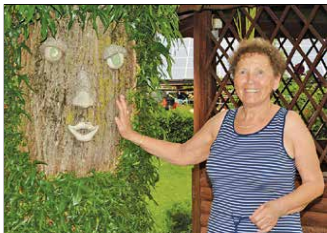
Lipa z obrazom je na Bulkovi kmetiji nekaj posebnega.