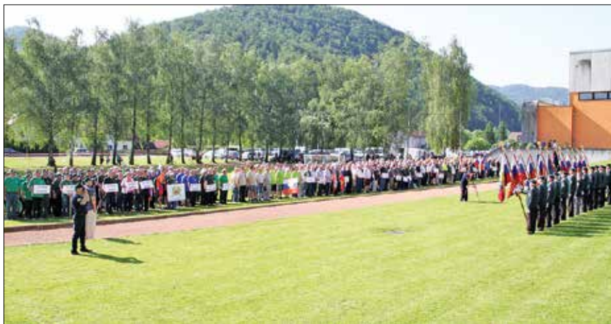
Otvoritveni ceremonial 18. veteranskih športnih iger pri športni dvorani v Mozirju.