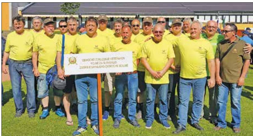
Del ekipe OZ VVS Zgornjesavinjsko-Zadrečke doline, ki je prvič sodelovala na veteranskih športnih igrah.