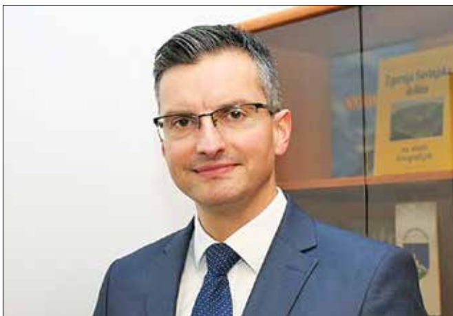
Predsednik slovenske vlade Marjan Šarec je javnosti sporočil, se nekdo lažno predstavlja z njegovim imenom in fotografijo na Facebook Messengerju ter ljudem ponuja nekakšne finančne storitve.

ne skrita v pogojih sodelovanja, podana za specifično določen namen, o katerem smo bili seznanjeni na razumljiv način.