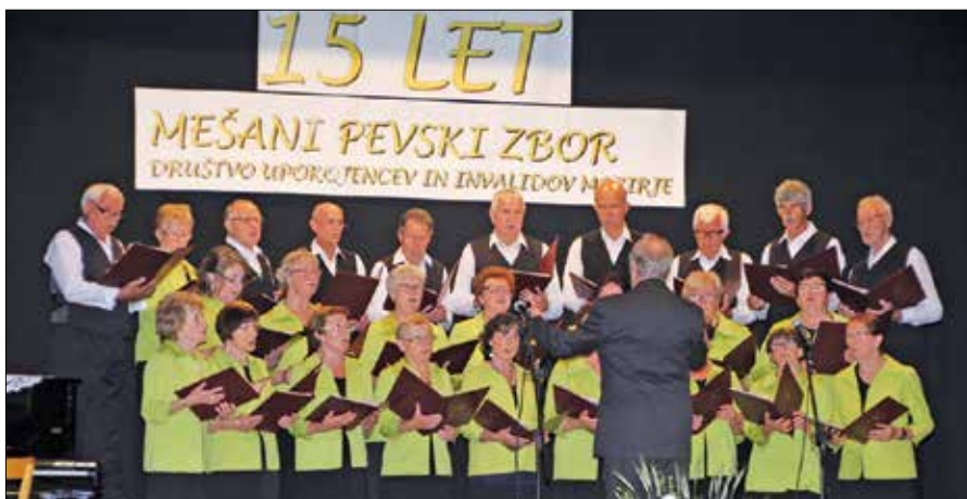
Od ustanovitve zbora pred 15 leti se je zamenjala vrsta pevk in pevcev, ves čas pa vztrajajo še trije.