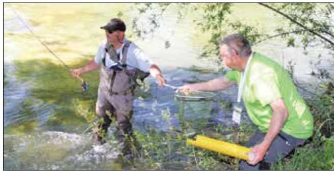
Tekmovalci so lovili zelo dobro in skupno ujeli skoraj 1.200 rib.

V Mozirskem gaju so se 7. junija zbrali člani ekip, organizatorji in predsedniki slovenske, hr-