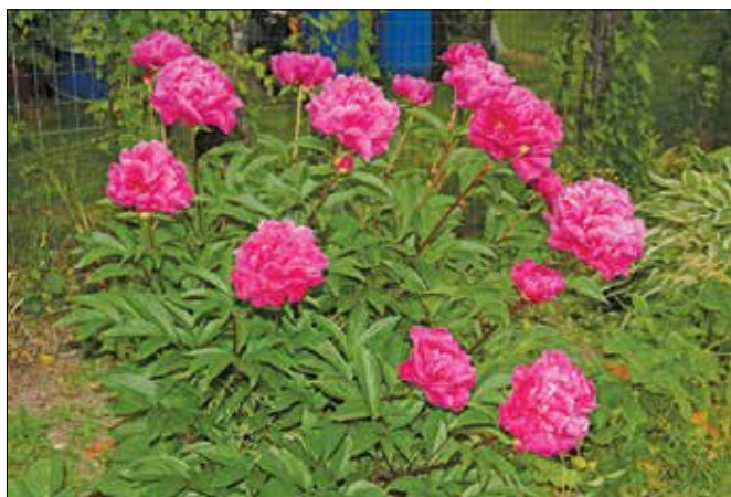
Hoste, stare potonike in slastne jagode si delijo prostor za hišo.