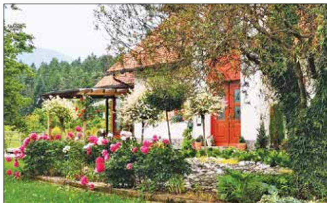
Okolica hiše je obogatena z rožami, grmički in raznim drevjem.

snimi sadeži. Tudi na murvi so se že kazali prvi sadeži.