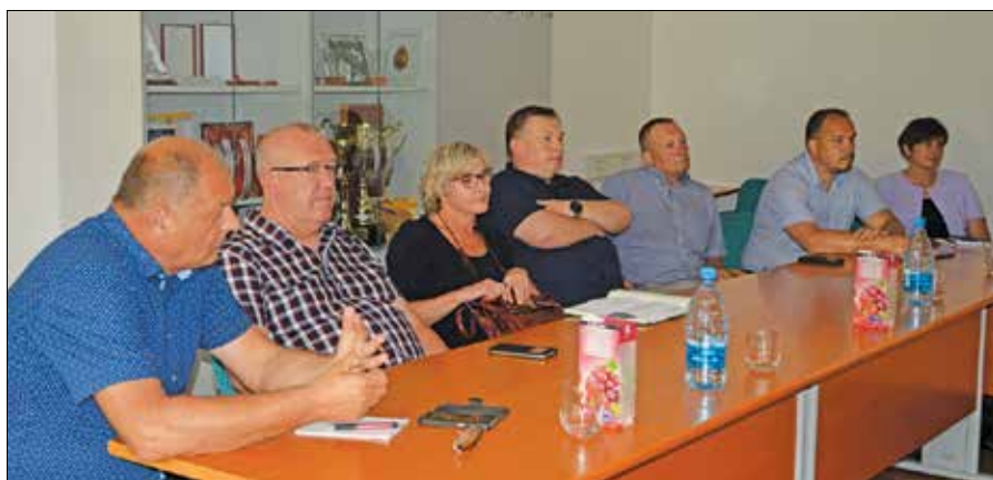
Županji in župani so si bili enotni, da bo treba podobna srečanja organizirati večkrat letno.

co. Glede odnosov v nazarski zdravstveni postaji je dejala, da niso tako slabi, kot se govori. Sama se v Nazarjah počuti zelo dobro.