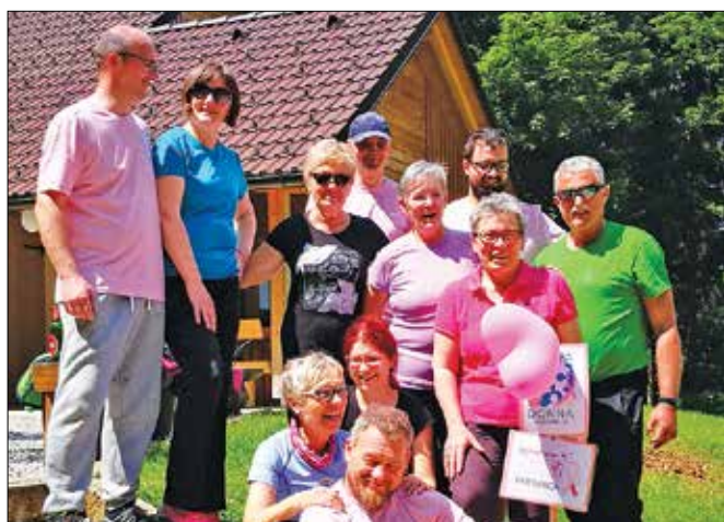
Pohodniki so obiskali tudi Farbanco, kjer so jih pričakali prijazni dežurni oskrbniki.