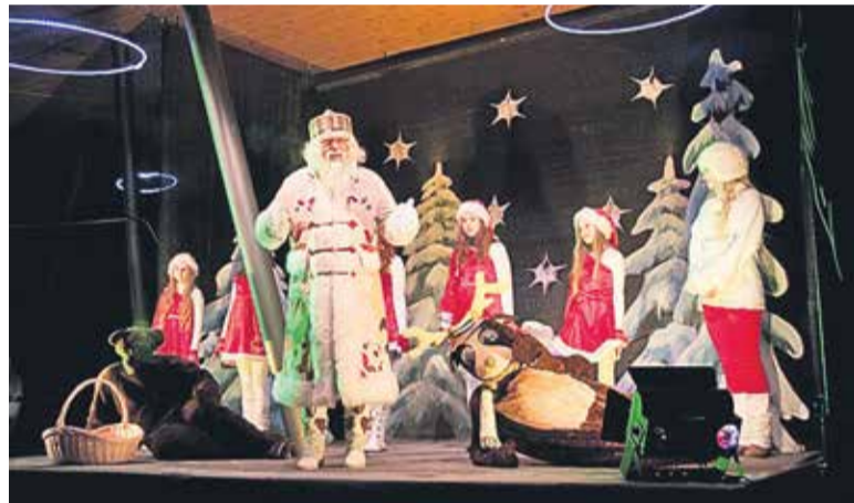
Obisk Dedka Mraza