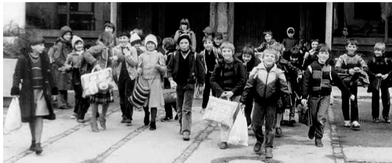
S petero samoprispevki so ljudje poskrbeli za normalne prostorske pogoje otrok v domžalskem šolstvu.

Zgrajena je bila kompletna šola za 900 otrok v eni izmeni. Po programu prispevka je bila predvidena bruto zidalna površina 8.000 m 2 , dejansko izvedene bruto površine pa je 8.106 m 2 . Po programu je bila ocenjena vrednost objekta 70.000,00 din, dejanska vrednost objekta pa je znašala 2.126.228.000 din. Dokončno bo potrebno urediti še igrišče, česar ni bilo mogoče izvesti zaradi zemljiških problemov. Izvajalec del je bilo podjetje GIP Obnova Ljubljana, projektanti pa Slovenijaprojekt Ljubljana. Objekt je bil predan svojemu namenu 1981. leta.