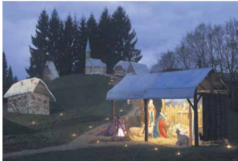
Zimska vasica s slovenskimi jaslucami

s svojimi pomočniki, angeli in parklji, v Športni dvorani v središču Domžal obdaril otroke. Drugi je bil Božiček, ki je skupaj s Kulturnim društvom Miran Jarc iz Škocjana otrokom v Češminovem parku pripravil presenečenje – pravljico o Sneguljčici in skromnem darilcu ob odhodu. Na vrhu češminovega hribočka je čez noč zrasla cerkvičica, pod njo pa je KD Miran Jarc iz Škocjana postavilo prijetno zimsko vasico s slovenskimi jaslucami z zvočnimi in svetlobnimi učinki. Tudi zadnji od treh dobrih mož, dedek Mraz, je imel v prazničnem decembru polno dela, saj so ga vsepovsod čakali pridni otroci. Tudi tokrat se je, tako kot vsako leto, na prizorišče pripeljal s konjsko vprego; spremljali so ga domžalski godbeniki. Letos s seboj ni pripeljal palčkov, saj so bili na prednovoletnem praznovanju pri Sneguljčici. Tokrat sta ga spremljala jelenček in medved s polnima košarama dobrot.