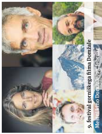
9. festival gorniškega filma Domžale Mestni kino Domžale, 27. februar