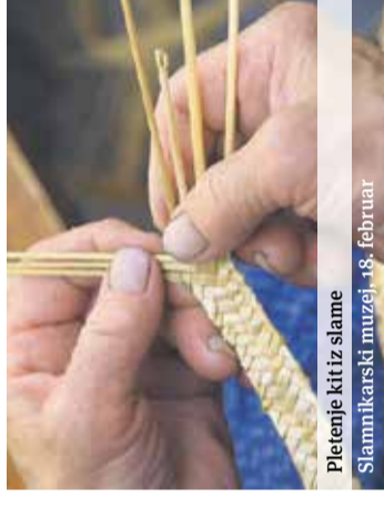
Pletenje kit iz slame Slamnikarski muzej, 18. februar