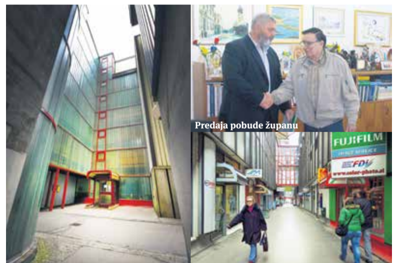
Prejema pobude županu

V tistem času so se predstavniki etažnih lastnikov srečali tudi s preostalimi županskimi kandidati, ki so v veliki meri izkazali podporo projektu revizije