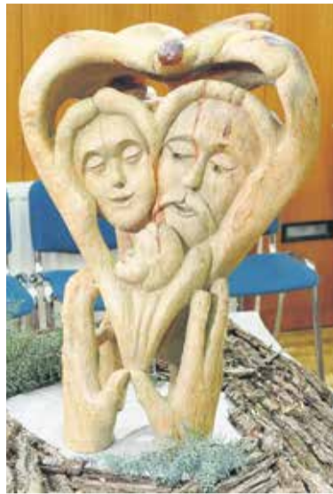
Srce je simbol ljubezni.