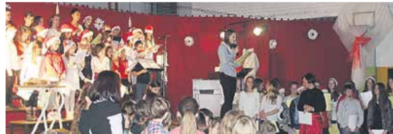
Glorija Ema bere skupno voščilo, nato še Sončna pesem.

Mestni bobnar je zabobnal in 17. decembra 2014 so se ob 18. uri prižgale odrske luči v praznično okrašeni telovadnici OŠ Dob.