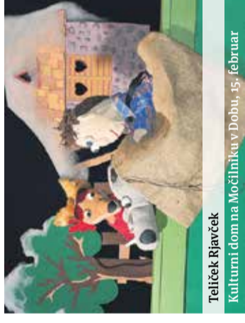
Teliček Rjavček Kulturni dom na Močljimku v Dobru, 15. februar