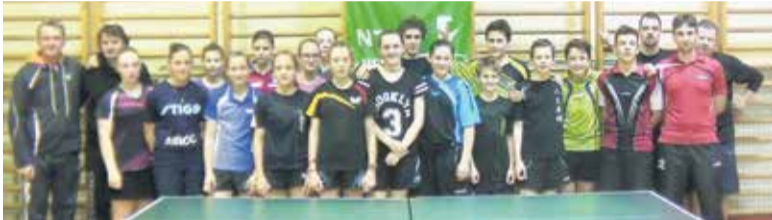
Udeleženci novoletnih priprav, ki so potekale v Mengšu.

V organizaciji NTS Mengeš je bil v januarju izveden eden od ekipnih kvalifikacijskih turnirjev za kadete in kadetinje – kadetska ekipa NTS Mengeš je osvojila prvo mesto (premagali