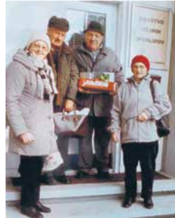
Člani izvršnega odbora DVI na zadnji seji v letu 2014

V letih, ko telo začne pešati in je moči čedalje manj, se marsikomu domača hiša spremeni v sobico doma za ostarele. Misli stanovalec se vračajo v kraje, od koder so prišli, v svojih čustvih iščejo slike dogodkov in doživetij kot naplavinno neke reke, ki ji pravimo življenje. Domači zvonik, pot na delo, skrb za otroke, prihod vnukov, čas,