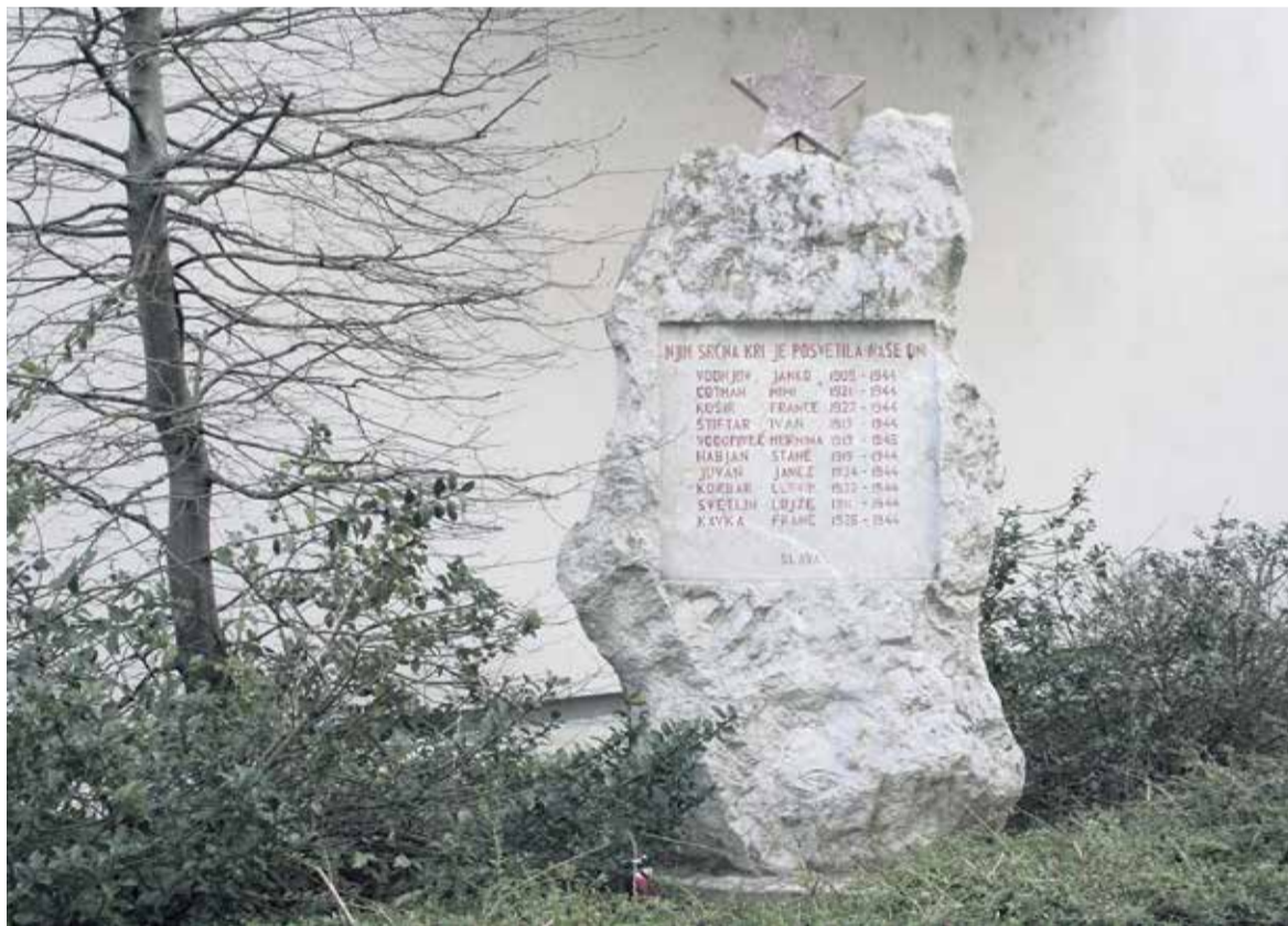
Spomenik NOB pri nekdanjem Toku

Ani Smolnik, ki je dopolnila enaindevetdeset let, se še zdaj živo spominja podrobnosti iz obdobja NOB, ko se je pogosto izpostavljala nevarnostim in je morala biti zelo iznajdljiva, predvsem pa pogumna. □