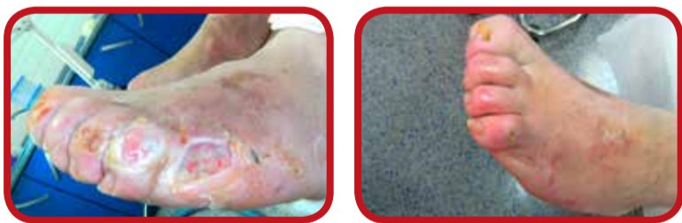
Primer zdravljenja diabetične razjede s PVR terapijo

Sindrom diabetičnega stopala je eden najbolj resnih zapletov sladkorne bolezni. Opredeljen je kot razjeda v področju gležnja ali noge, ki nastane zaradi okvare ožilja (periferna arterijska okluzivna bolezen), živčevja (diabetična polinevropatija) in kot posledica okužbe. Nepravočasno in neuspešno zdravljenje sladkorne bolezni in njenih zapletov se še vedno pogosto konča z amputacijo.