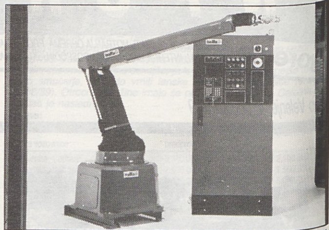
Rezultat sodelovanja Gorenja Procesna oprema in firme ABB je robot Trallfa TR - 4006 za površinsko zaščito.

V 10 letih so v okviru razvojno-konstrukcijskega oddelka elektronika v gospodinskih aparatih razvili več naprav s področja merilnikov temperature, časa in pritiska, nadalje časovna krmila, pomožne elektronske naprave,