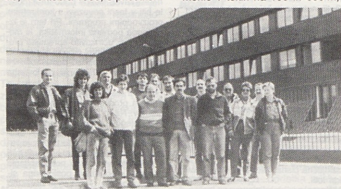
Člani tekaške sekcije Gorenja, ki so se letos udeležili 9. plitvičkega maratona, so se med potjo ustavili v Bihaču. Tam so si ogledali proizvodnjo v Gorenju Bira (na sliki), muzej I. zasedanja Avnoja in razstavo likovnikov Gorenja v tamkajšnji galeriji.

skoku v daljino, suvanju krogle in štafetnem teku 4 x 100 m. Moški bodo tekli na 100 in 1000 m ter štafeti 4 x 100 m, prav tako pa bodo svoje moči merili v suvanju krogle in se potegovali za najdaljši skok. Prijave bodo sprejemali 15 minut pred pričetkom tekmovanja.