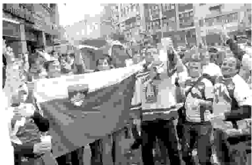
Navdušeni slovenski navijači v Beogradu

OPORTUNIDAD DE INGRESOS EXTRA Para eslovenos en la Argentina Empresa internacional con pronto inicio de actividades en la República de Eslovenia selecciona socios comerciales con contactos profesionales, comerciales o personales en Eslovenia y la Argentina. Solicite información adicional a: poslovpartner@yahoo.com.ar