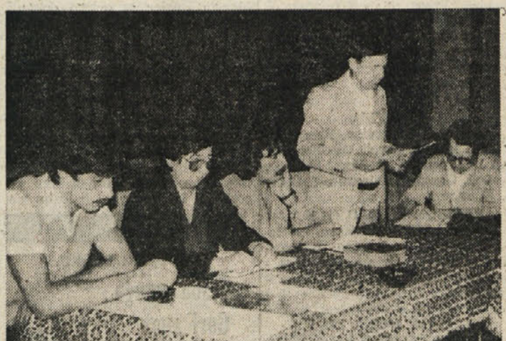
Predsedstvo občnega zbora

V dvorani Kulturnega doma v Sovodnjah so v soboto zvečer na občnem zboru prosvetnega društva pregledali opravljeno delo. Ta občni zbor je bil četrti od izgradnje Kulturnega doma v letu 1972 in prvi v obnovljenem in razširjenem domu.