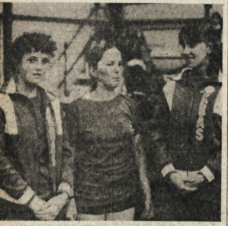
Krasove namiznoteniške igralke so v prvi ženski italijanski ligi odlično startale...