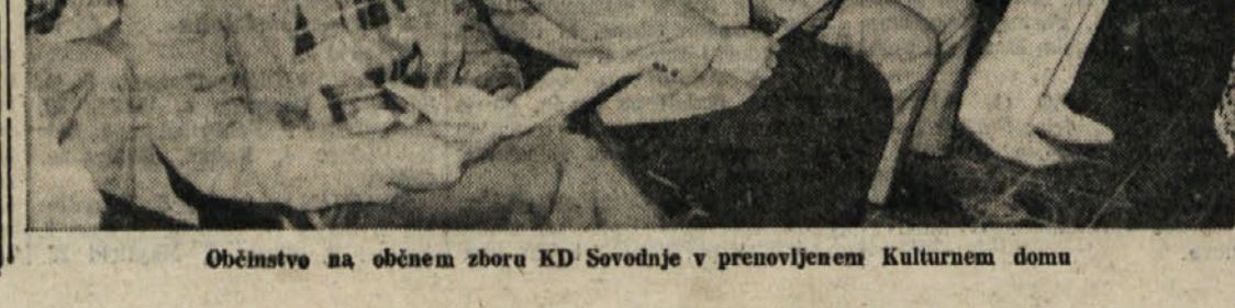
Občinstvo na občnem zboru KD Sovodnje v obnovljenem Kulturnem domu