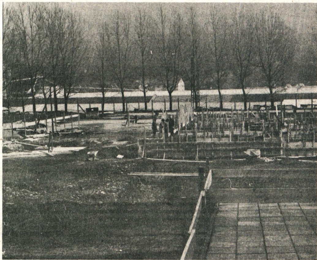
Gradnja prizidka k osnovni šoli Borovnica teče po predvidenem rokavem planu. Vsa nesoglasja okrog samega projekta so razjasnjena in delavci SGP Grosuplje — TOZD Igrad iz Vrhnice so že zgradili temelje.