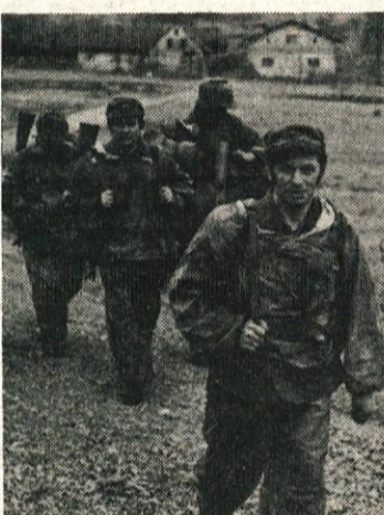
Najtežjo vlogo v tej vaji so imeli pripadniki teritorialne obrambe, ki so bili v vlogi diverzantov. Ljudje jih niso sprejeli za svoje in so jim odklanjali vsako pomoč. Bili so izpostavljeni tako, kot bi bili v resnici sovražnik.

V začetku meseca marca na področju KS Borovnica vaja enot teritorialne obrambe, v kateri so sodelovali tudi vsi pripadniki KS Borovnica. Namen vaje je bil, da se pripravijo na odpravo izrednih nalog sodelovanje med enoto za teritorialno obrambo in civilno zaščito. Načrt za odpravo izrednih nalog sodelovanje med enoto za teritorialno obrambo in civilno zaščito Občinskega štaba za teritorialno obrambo. Načrt je bil prilagojen tako, da je predvsem vse možne taktične variante lahko nastopile v podobnih okoliščinah. Pri tem je potrebno poudariti, da se vsi sodelujoči odlično pripravijo na svojo vlogo, ki so jo igrali v vaji. Zelo se je, da smo dobro pripravili in izurjeni, da nas tudi v izrednih okoliščinah ne morejo presenetiti.