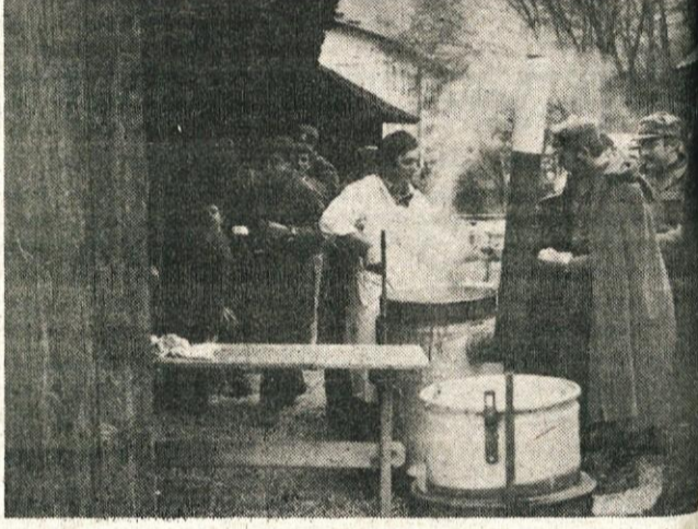
Za zaključek vaje je KS Borovnica pripravila majhno predstavo, v kateri je vse udeležence vaje pogostila z dobrim vojaškim mletjem.

Z odlokom tovariša Tita je bil 20. januarja 1950. leta 15. april proglašeno za dan železničarjev Jugoslavije. V njem je med drugim zapisano: Čeprav je bil veliki štrajk zažuden v krvi in čeprav ga je vladajoča buržoazna klika zlomila, je vendarle važen zgodovinski dogodek našega delavskega gibanja zato, ker je v njem prišla do izraza popolna enotnost, organiziranost in odločnost železničarjev, enotnost in solidarnost delavskega razreda Jugoslavije in ker je v tem krvavem obračunu vladajoča buržoazija pokazala svoj pravi obraz pred narodi Jugoslavije. Da bi podčrtali značaj revolucionarne borbe železničarjev, da bi dali priznanje železničarjem Jugoslavije za njihovo udeležbo v osvobodilni borbi narodov Jugoslavije, da bi se zlasti poudarili značaj samopožrtvalnega in herojskega dela železničarjev pri izgradnji nove socialistične Jugoslavije, odločam, da se 15. april proglašuje za dan železničarjev Jugoslavije in ga bodo v prihodnje praznovali v vseh enotah in ustanovah jugoslovanskih železnic.