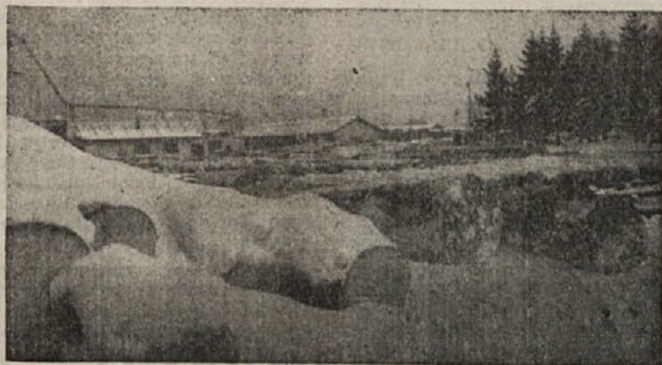
Zasneženo skladišče hlodovine na obratu v Ribnici

Delavski svet Kombinata lesne industrije v Ribnici je imenoval komisijo, katere naloga je, pripraviti statut podjetja. V prvem četrletju letos bodo pričeli obravnavati statut po vseh obratih.