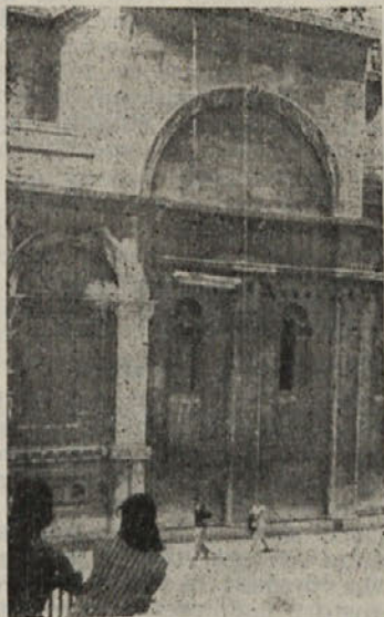
Pročelje šibeniške katedrale

Z Žanom sva takrat prespala nedaleč od Šibenika. Po klancu sva se spuščala proti večji vasi in ko sva došla žensko, ki je vlekla ročni voziček, sva jo pobarala, če ve za kakšno prenočišče. Prespala sva kar pri njih, v novi, lepi hiši, okrog nje in v njej pa je čudovito dišalo po vinu, da sva bila ves čas kar malo omočična.