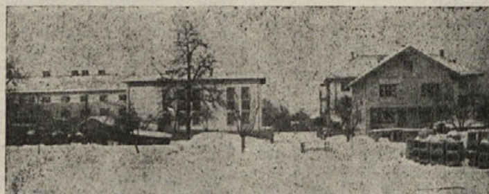
Ribnica. V sredini nova pošta

Zdravstveni dom Kočevje je imel prejšnja leta organizirane v Fari, Osilnici, Predgradu in Strugah posvetovalnice za noseče žene in dojenčke, ki pa jih je bil prisiljen ukiniti, ker ni dobil sredstev za vzdrževanje niti od zavoda za socialno zavarovanje niti od občinskega ljudskega odbora (ki je po zakonu o financiranju zdravstvene službe dolžan plačevati). V že naštetih krajih je zdravstveni dom nameraval tudi letos uvesti posvetovalnice, pa spet ni dobil odobrenih sredstev. Podobno je tudi z zobozdravstveno službo na terenu. Zdravstveni dom namerava odpreti letos zobno ambulanto v Fari, a prizna zavod za socialno zavarovanje zdravstvenemu domu le iste stroške na pacienta, kot za zobno ambulanto v Kočevju. Zdravstveni dom namerava zobno zdravljenje v Fari kljub temu uvesti, kasneje pa tudi (če bodo preveliki stroški oziroma prevelika izguba) — ukiniti.