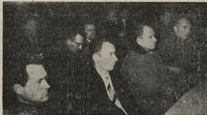
Z letne konference ZROP Kočevje

Letna konferenca ZROP v Kočevju, ki je bila 1. februarja, je za člane organizacije odprla vrsto vprašanj in problemov, katere bo potrebno rešiti v tem letu.