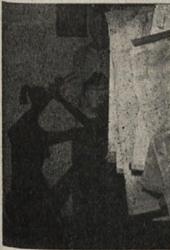
Dekle sameva v prirodoslovnem kabinetu

Slišal sem tudi, da so se nekateri spotaknili ob golo telo »Dekleta s piščalko«, vendar ne kakšne pobožne ženice. Koliko kipov golih ljudi je po vsem svetu ali pa samo v bližnji Ljubljani, pa se nad njihovo goloto nihče ne spotika. Človeško telo je vendar nekaj najlepšega in nudi likovnim umetnikom obilo izraznih možnosti.