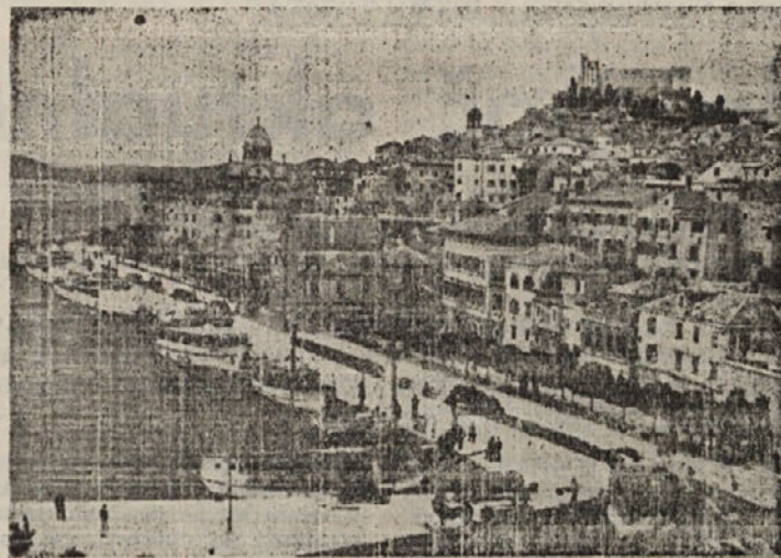
Šibenik — pristanišče, mesto in Šubičevac

Zvečer smo sedeli pred hišo in klepetali, držeč v rokah velike kozarce gostega črnega vina, od katerega se je širil sladek, prijeten vonj. Ko se je znočilo, smo še nekaj časa klepetali, po večerji pa so naju spravili v lepo sobo z dvema mehkim posteljami. Ob odhodu sem še kupil steklenico vina; kolikokrat me je potem mučila misel nanjo, toda vzdržal sem in jo doma slavnostno izročil očetu. »Kdaj pojdeš spet v Dalmacijo?« me je vpra-