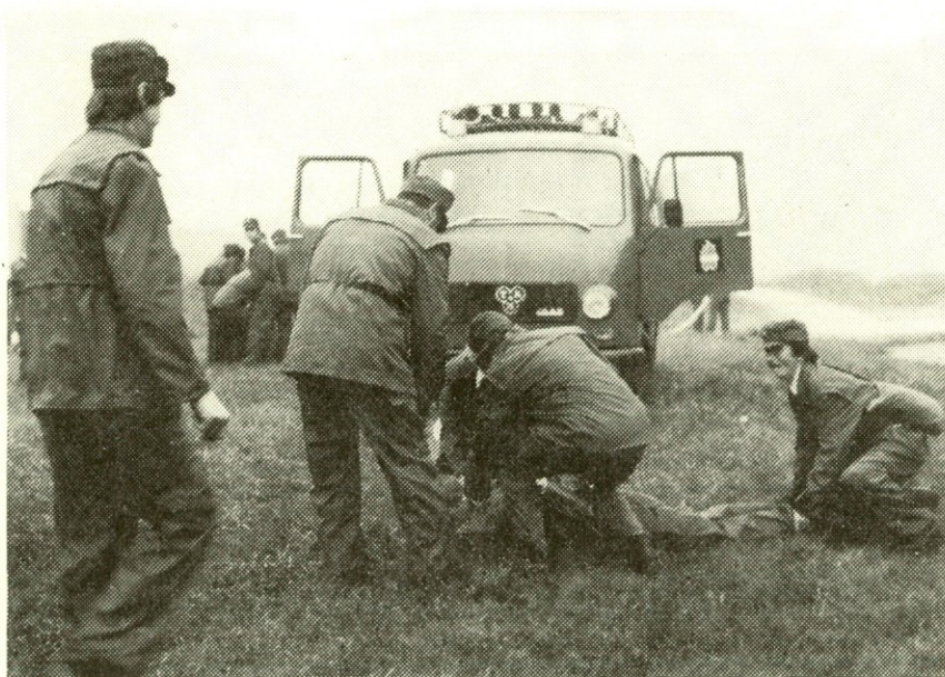
Pravočasna pomoč — rešitev življenja.

je odpravljala na „delo“ v Gorenje. Tako je Gorenje v pogledu zavarovanja proti diverzantom poželo stodontni uspeh. Res je bila to samo vaja, a diverzanti si vendarle tudi za vajo niso upali mimo našega zavarovanja.