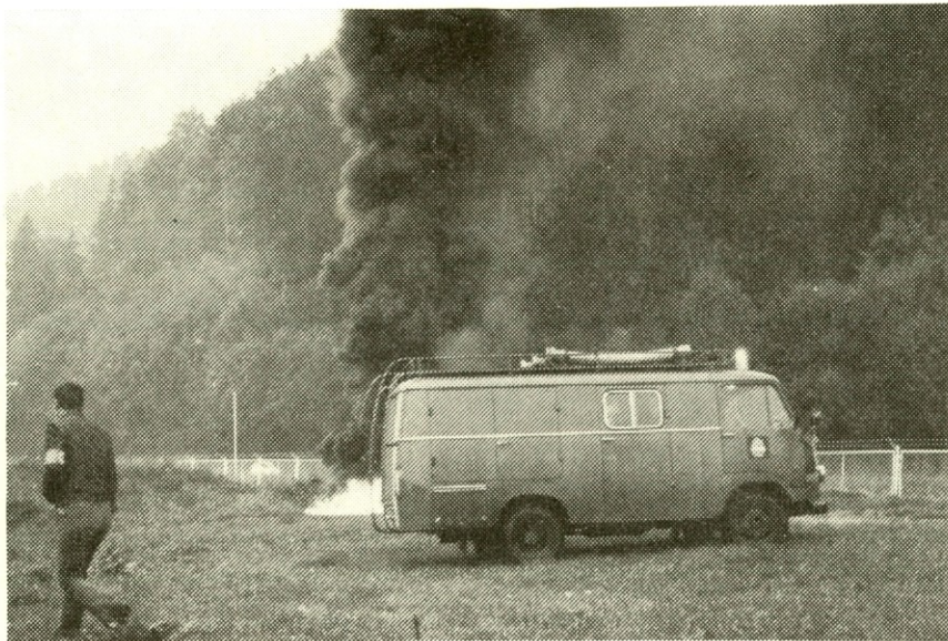
Sirene, ki so oznanile požar, še niso potihnile, že je bila specialna enota tu.