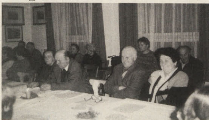
Zadovoljstvo, pa tudi nekoliko disharmonije na občnem zboru