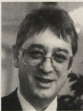
Piše dr. Franci Zwitter

ustrezno, toda inflacija, ki je napovedana, bi lahko že v doglednem času zvišala povprečni dohodek deloje-