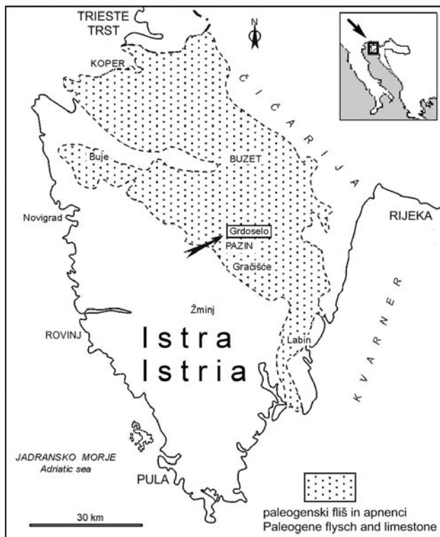
Sl. 1. Geografski položaj Grdosela v osrednji Istri Fig. 1. Geographic position of Grdoselo in Central Istria

Pri večkratnem pregledovanju najdišča smo samo enkrat naleteli tudi na ostanke eocenskih glavonožcev. Našli smo tri dele kamene jedra frogmokona, ki pripadajo rodu Aturia . Aturijini segmenti so medsebojno povezljivi in so zanesljivo od istega osebka.