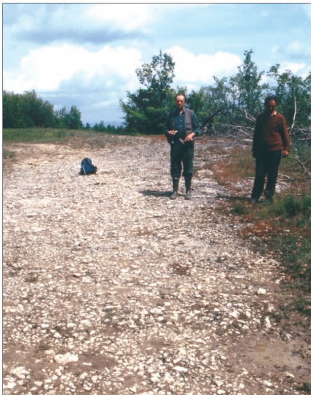
Sl. 3. Horizont srednjeeocenskih peščenih apnencev v Grdoselu s številnimi makrofosili