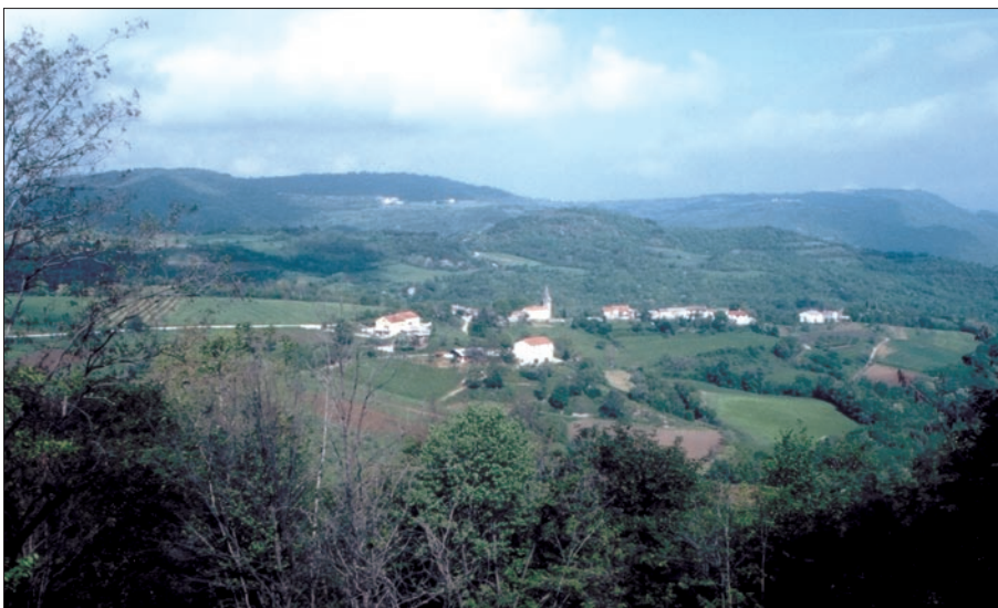
Sl. 2. Zaselek Grdoselo z jugovzhodne smeri Fig. 2. Small village Grdoselo from southeast direction

V marcu leta 2007 smo si ogledali eocenske fosilne ostanke iz Istre, ki so shranjeni v depojih Prirodoslovnega muzeja v Trstu (Museo di Sto-