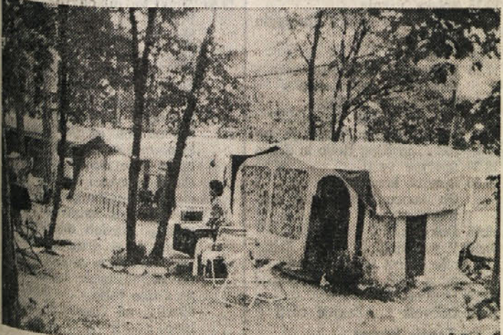
V kampingu pri Opčinah

Ko se voziš po glavni cesti iz Gorice preko pevškega mosta v smeri Pevme, Oslavja in še daleč proti Števerjanu, lahko opaziš, da sta na cesti dva gospodarja. Od pevškega mosta do kostnice na Oslavju je za cesto odgovorna goriska občina, od kostnice dalje pa skrbi za vzdrževanje ceste pokrajinska uprava.