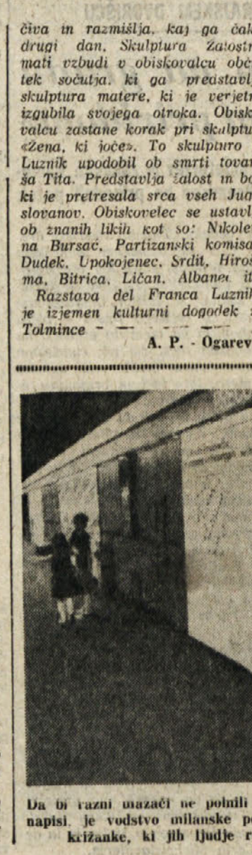
Da bi razni označili ne polnili zidov s svojimi po navadi vulgarnimi napisi, je vodstvo toliminske podzemse železnice napolnilo na zidove knjižnice, ki jih ljudje radi rešujejo, ko čakajo na vlak

da bi razni označili ne polnili zidov s svojimi po navadi vulgarnimi napisi, je vodstvo toliminske podzemse železnice napolnilo na zidove knjižnice, ki jih ljudje radi rešujejo, ko čakajo na vlak Pr.: «Čeprav sem za preselja 55 let, sem se odločila, da de am do konca letošnjega leta. Vsega skupaj bom imela 28 let dela in me seveda zelo zanima, kakšna bo moja pokojnina. Slisala sem, da je sedaj stopil v veljavo nov zakon, ki daje pravico do boljše pokojnine. V kakšni meri? Mi približno izračunajte, koliko bom dobila, če vam navedem svojo plačo v zadnjih petih letih: leta 1973 7,2 milijona, leta 1979 8,5 milijona, leta 1980 10 milijonov, leta 1981 12 milijonov in leta 1982 predvidevam 14 milijonov.» S. J. Vaša radovednost, kolikšna bo vaša pokojnina, je povsem upravičena, saj bo v bližnji bodočnosti to prav osnovni življenjski dohodek. Prav zaradi tega je treba izbrati tisto pot, ki vam zagotavlja najvišjo možno pokojnino. No, prav zato vam takoj svetujemo, da vložite prošnjo za starostno upokojitve v novemburu in ne decembra meseca, ker boste tako deležni s 1. januarjem 1983 fiksnega povška draginske dodele (nad 50.000 lir), ki bi je sicer ne dobili, čeprav morate ostati na delovnem mestu še decembra, lahko vložite prošnjo za pokojnino novembra in tako vam bodo za december zadržali odtegljane na pokojnino. Kar se pa višine pokojninskega zneska tiče, res sčakov o likvidaciji, ki je prepričljiv referendium, med drugim tudi dočla, da se od 1. julija letos upoštevajo