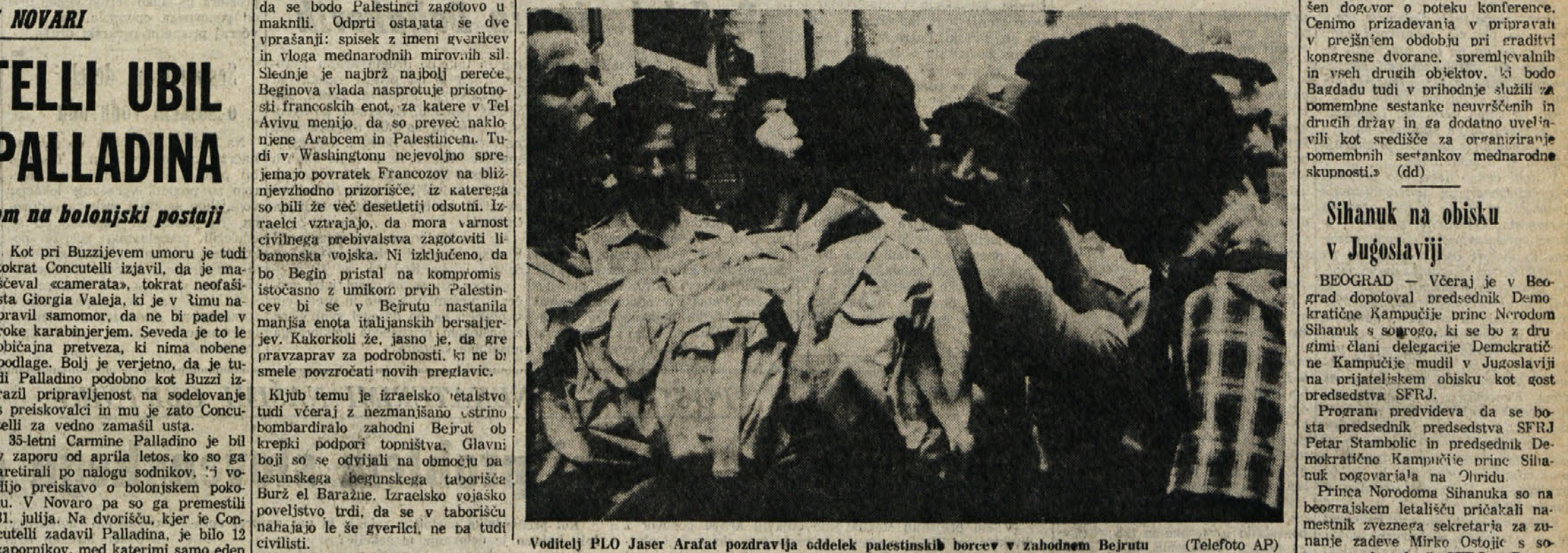
Voditelj PLO Jaser Arafat pozdravlja oddelek palestinskih borcev v zahodnem Bejrutu