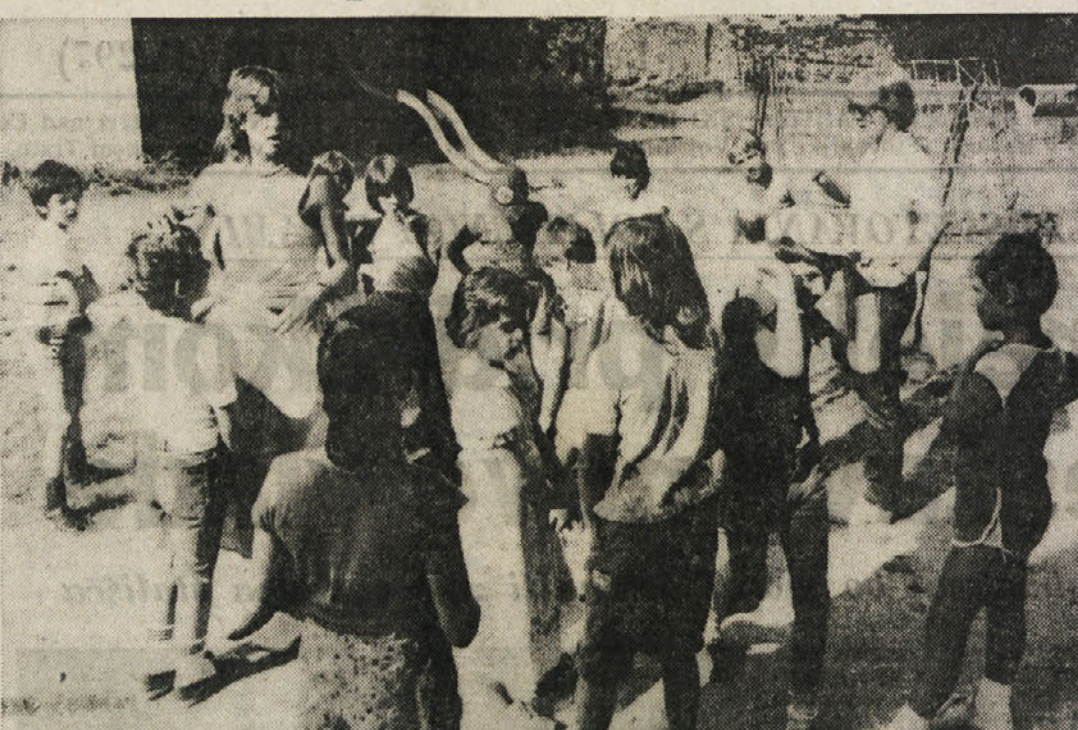
Skupina 50 naših otrok preživlja te dni brezskrbne počitnice v poletnem centru na Proseku v družbi vzgojiteljic in varuš