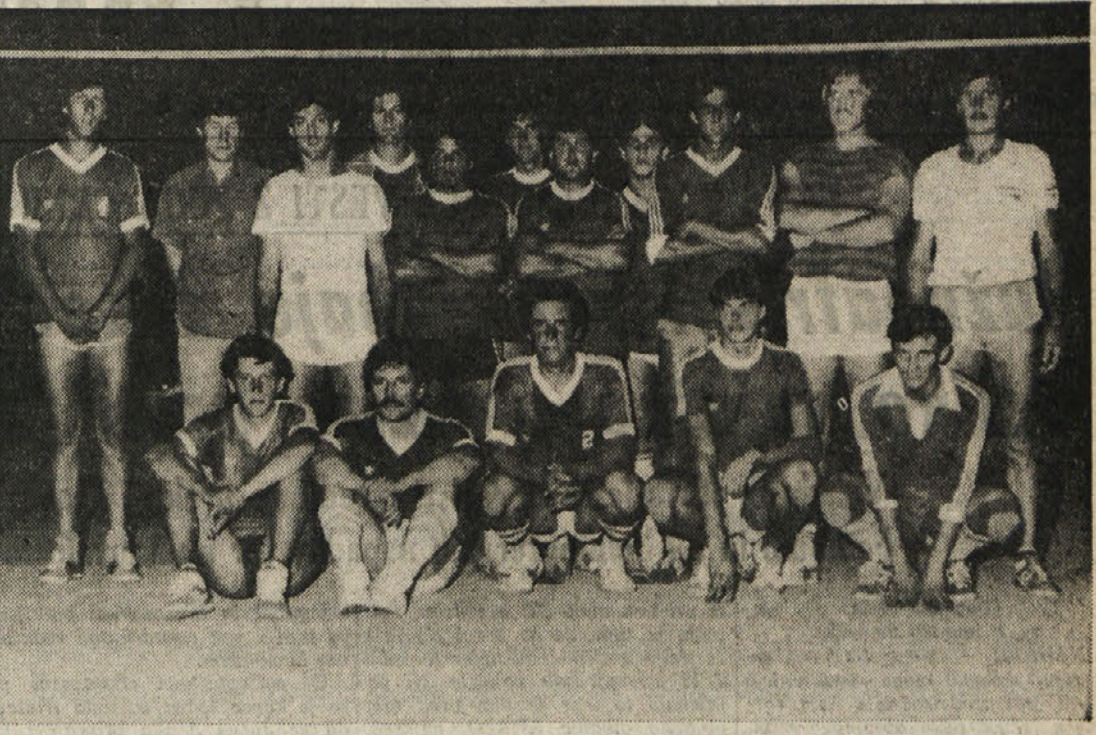
Ekipo iz Doberdoba in Jamelj, ki sta se pomerili v moškem finalu odbojarskega turnirja za 3. memorial Bernard Frandolčić, ki ga je pred kratkim organiziralo KD Kras (Dol - Poljane)

Košarkarski odsek - SZ Bor obvešča vse zainteresirane, da so prijavnice za košarkarski kamp v Seči na razpolago pri čuvaju stadiona "1. maja". Prijavnice vrnite čuvaju najkasneje do 16. Lm.