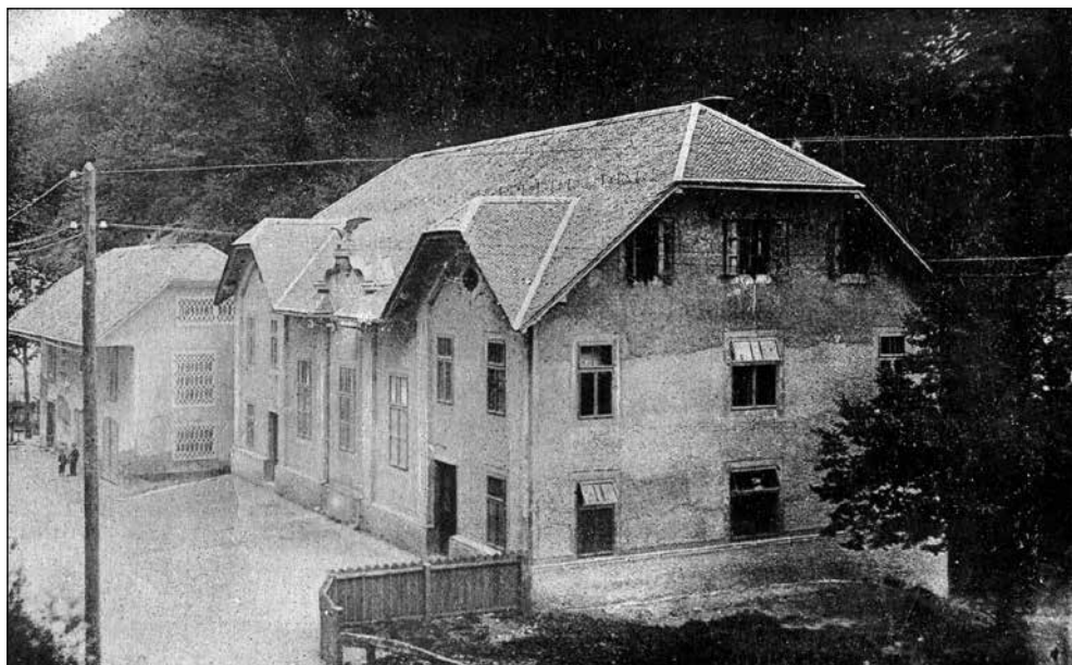
Novozgrajeni sokolski dom v Železnikih. V stavbi so bili oder in društveni prostori.