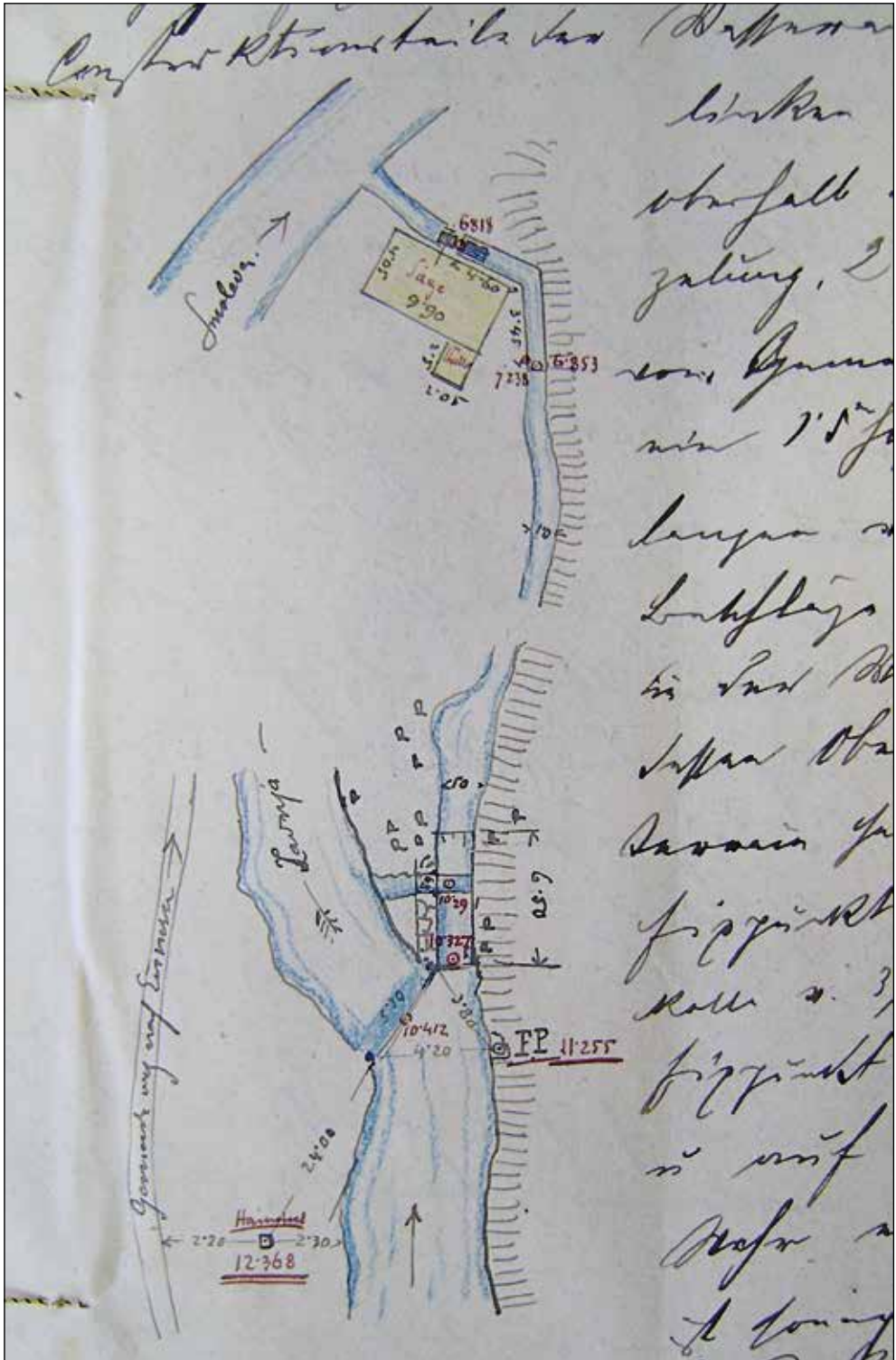
Skica vodne naprave v kolovdacijskem zapisniku.