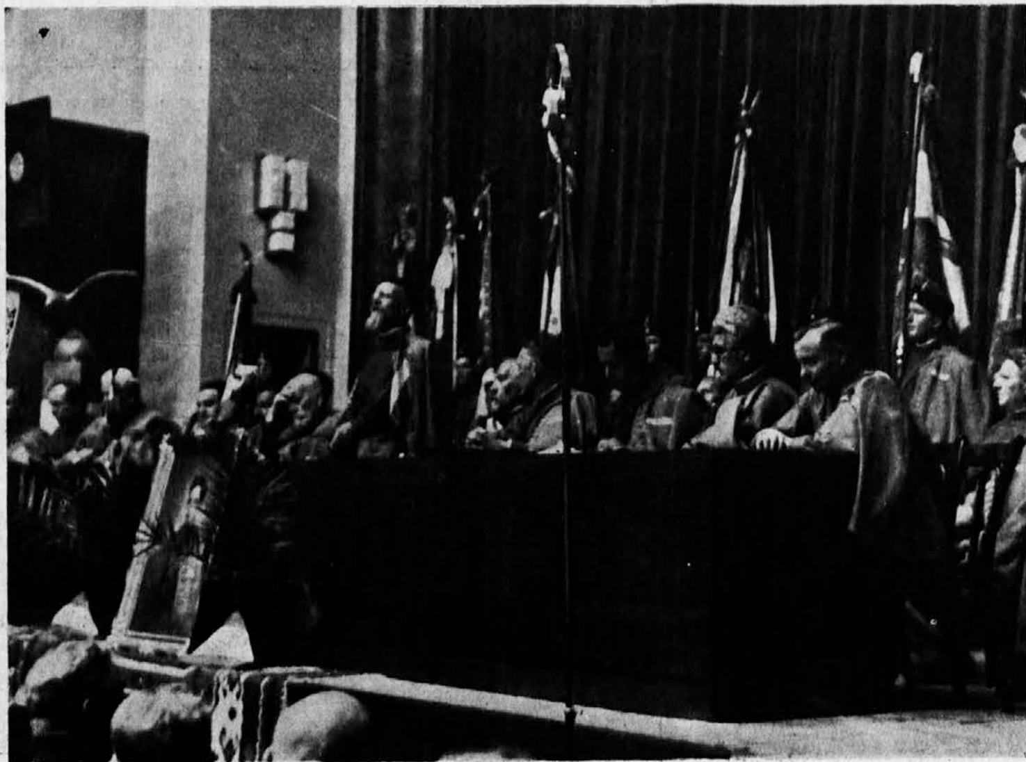
Sa sokolske proslave Kraljevog rođendana na Kolarčevom univerzitetu u Beogradu

Savez Sokola Kraljevine Jugoslavije slavi danas sa svim svojim jedinicama po čitavoj domovini 15 rođendan svog Mladog Kralja i prvu godišnjicu Sokolske Petrove petoletnice. Na ovoj proslavi sećamo se Velikog Oca našeg ljubljenog Starešine, na ovaj praznik pridružujemo se radosti uzorne Majke Kraljice Marije, pridružujemo se radosti obojice Kraljeve Braće i sve Kraljevske Porodice, pridružujemo se radosti čitavog jugoslovenskog naroda, kojeg projevavaju vruće želje za zdrav i dug život i srećnu vladavinu svog Kralja. Ljubav, vernost i odanost mladome potomku velikog Oca i slavnih Njegovih Dedova, koji je simbol jugoslovenske misli, jedinstva naroda i države, biće u buduće kao što su i do sada bile posvećene misli vodilje nesebičnog rada jugoslovenskog Sokolstva za blagodat naroda i domovine.