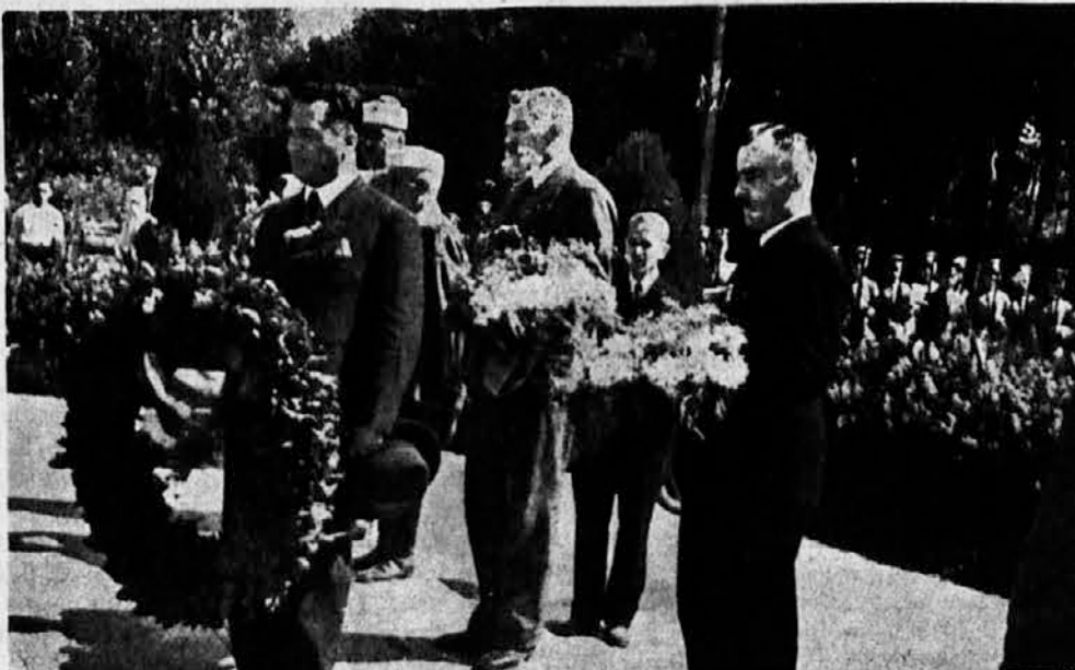
Gore: U Kazanliku: Osvećenje spomenika palim ratnicima. — Dole: Pretstavnici Sokolstva polažu na spomenik vence