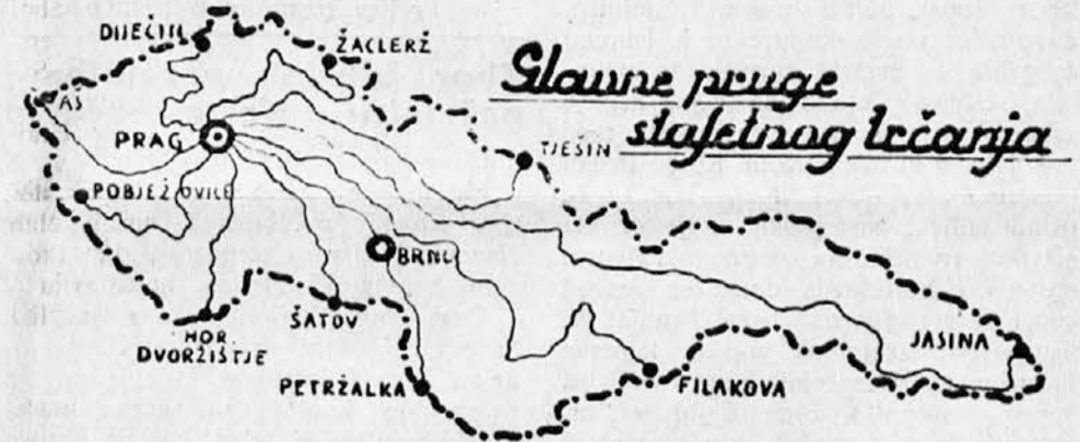
Glavne pruge sokolske stafete

Kao što smo već izvestili, dne 17 o. m., na dan rođenja osnivača Sokolstva, dr. Miroslava Tirša, prema predviđenom programu, grandiozna sokolska stafeta otvoriće svečanosti X svesokolskog sleta u Pragu. Iz dana u dan ova priredba zauzima sve veći opseg i biće nesumnjivo najveća svoje vrste koje poznaje istorija.