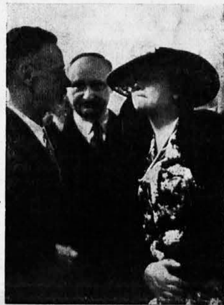
Nj. Vel. Kraljica Marija na izložbi sokolske štampe s naročitom pažnjom prati razlaganje brata Gangla

Nj. Vel. Kraljica je s naročitim vidnim zanimanjem pratila tumačenje brata Gangla i razgledala izložbu, te se zatim srdačno oprostila i s osobito vedrim raspoloženjem udaljila se sa svojom pratnjom, oduševljeno pozdravljena od svih prisutnih.