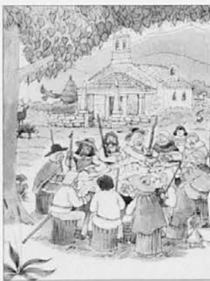
Iz knjige Slavica, KD Studenci 1997

V prejšnjih letih smo večkrat poročali o zelo zanimivi manifestaciji, ki jo prirejajo običajno konec meseca junija v Špetru in ima namen obuditi spomin na tisto obdobje beneške zgodovine, ko je dano območje uživalo dejansko avtonomijo za časa republike Serenissime. Obujanje zgodovinskega spomina pomeni v tem kontekstu tudi potrditev ponosa človeka, ki živi na tej zemlji, saj ima za sabo bogato in posebno zgodovinsko tradicijo, ki jo velja spoznati in vrednotiti. Udeležba na manifestaciji, ki neposredno prikaže v vseh svojih elementih dan dogodek pa je najlepši način za učinkovito dojetje preteklih dogodkov in obdobja, predvsem pri mlajših generacijah. Gorska skupnost Nadiških dolin prireja četrto obnovev zgodovinskega Arenga Beneške Slovenije, ki bo v nedeljo, 7. julija, v Špetru, ko bodo počastili tudi domačega patrona sv. Petra. V petek zvečer ob 20.30 bo sv. maša, sledile bodo ljudske igre in rok koncert. V soboto ob 20.30 bo v špetrski občinski dvorani koncert Godalnega kvarteta Glasbene matice. Med koncertom bo podelitev nagrad Srebrna lastra beneškega Arenga, ki jih GS podeljuje osebnostim, ki so se posebej odlikovale v družbenem in kulturnem življenju Nadiških dolin. V nedeljo se bo ponovil velik arengo landarske in mierske