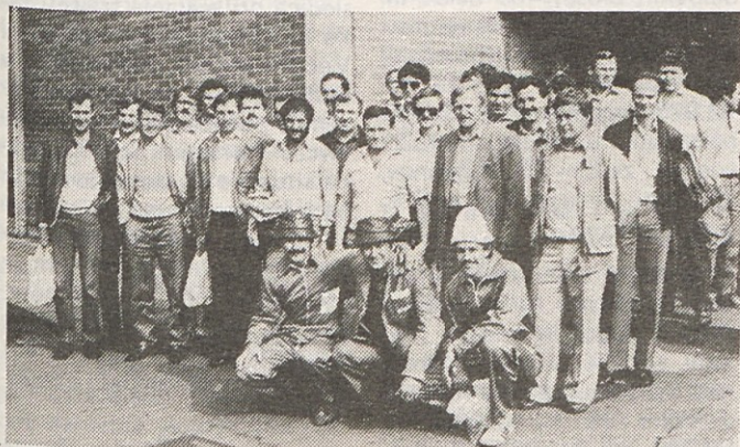
Slovenski kovinarji v Gorenju, preden so odšli na udarniško delo v tozde