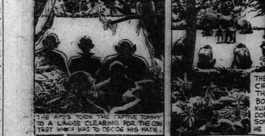
Tedaj so opice vzele Tommy-ja na obsirno planjavo, kjer bi preiskusile njegovo moč.