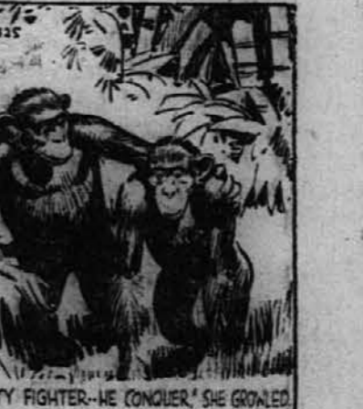
svojeгаа mladico-opico, katero so klicali "Moj sin — močan borec — bo zmagal," je godrnjala.