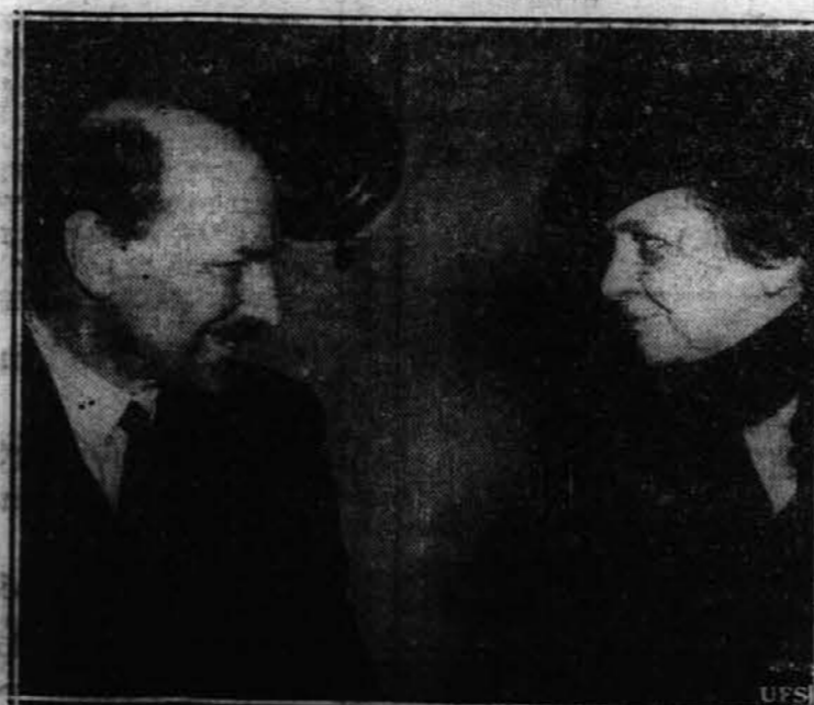
Vodilni angleški laborit in zdej član vlade C. R. Attlee, ko je prišel nedavno v New York na mednarodno delavsko konferenco. Na desni je delavska tajnica Perkins, ki je prišla posetnica pozdravit.