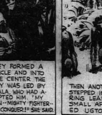
Tukaj se postavijo v krog na sredo katerega je Kuala vodila dečka, katerega si je prisvojila. "Moj sin—močan borec—bo zmagal!" je govorela.