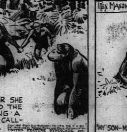
Nato je druga opica vodila na sredocali z imenom Ugtoo.