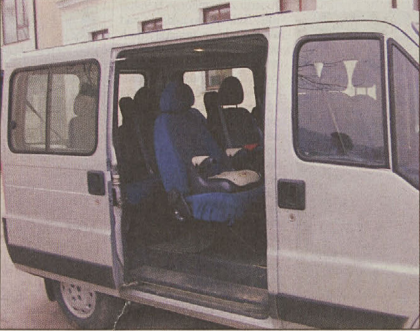
...na strani 3 So vsi šolski kombiji opremljeni v skladu z zakonodajo?

Posavje – Nedavna tragična nesreča v Pišecah, v kateri je skoraj pred domačim pragom izgubil življenje šestletni šolar, je odprla nešteto vprašanj o varnosti otrok, ki se v šolo in iz nje vozi s kombiji ali avtobusi. Začele so se razprave o tem, kdo prevažata otroke, kakšna so vozila, s katerimi se prevažajo otroci, in tudi o tem, ali lahko šolski kombi razvažata tudi malčke, ki obiskujejo vrtec. Večina osnovnošolskih otrok je vozačev. O tem, kdo je upravičen do prevoza, govori Zakon o osnovni šoli, o tem, kdo sme prevažati to občutljivo populacijo in kakšna so pravila, govori Zakon o varnosti v cestnem prometu. Zakonodaja obstaja, vprašanje pa je, če se izvaja tudi v praksi.