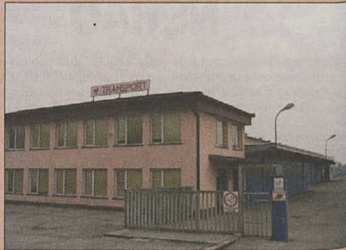
Hofer namesto Transporta

privedel do tega, da bo imetje propadlo in bo vse eno samo pogorišče. Odškodnino