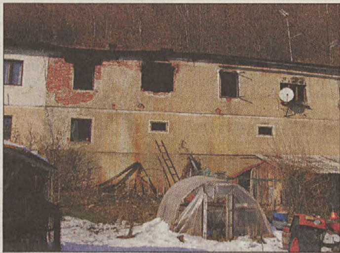
Stanovanjska hiša, v kateri je izbruhnil požar.

Z ognjem, ki je izbruhnil v stanovanjski hiši v Reštanju, so se zaradi nenormalnih pogojev in okoliščin gasilci borili 15 ur. Pri tem sta se dva poklicna gasilca lažje poškodovala; eden je dobil opekline po obrazu, drugi uparnine,