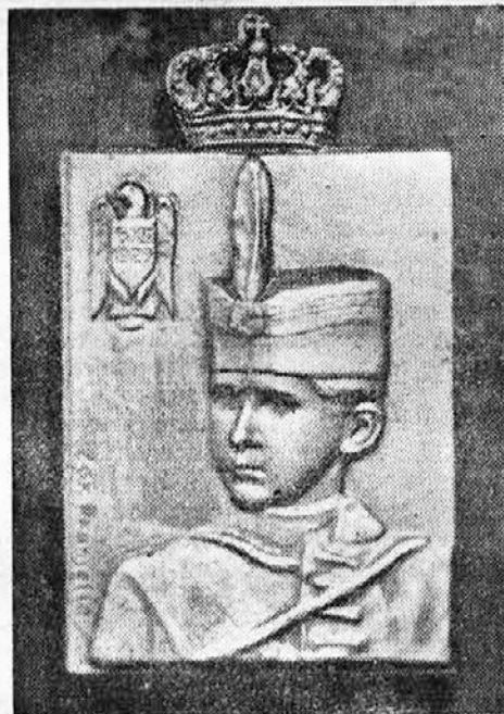
Plakete sa poprsjem Nj. Vis. Prestolonaslednika

kasnije sa svim ovim originalnim potpisima biti predana Savezu Sokola kraljevine Jugoslavije.