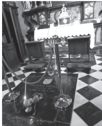
Škofov grob v ljubljanski stolnici

Zbori iz iste dekanije imajo občasno svoja srečanja, najsi bo v obliki pevskih revij, izletov ali romanj. Tako se je naš župnijski zbor pridružil svojim kolegom in za jubilejno leto usmiljenja poromal na sedež škofije, v ljubljansko stolnico. Po verski pobožnosti so si ogledali tri ljubljanske cerkve: omenjeno stolnico, frančiškansko na Prešernovem trgu in sv. Jakoba na Levstikovem trgu.