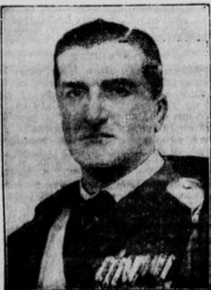
Vrhovni gospod Madjarske Horthy praznuje 48. junija šestdesetletnico.