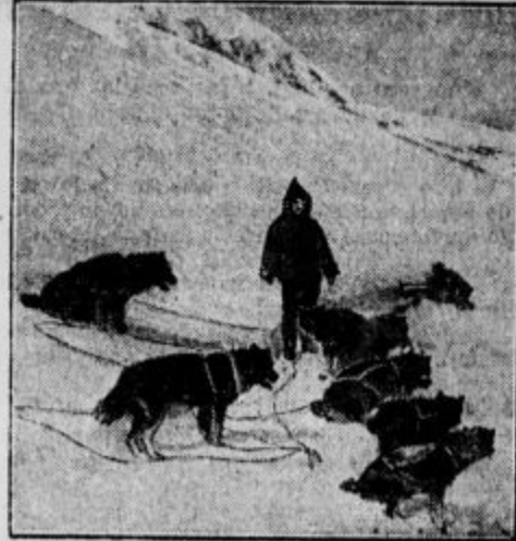
Psi, ki jih ima s seboj zrakoplov »Hobby«, da pomagajo reševati Nobilea.

zrakoplov »Los Angeles«, ki ima 70.000 kubičnih metrov plinske vsebine in izredno močne stroje. Toda ameriški krogi se obotavljajo, ker se boje, da bi zrakoplov pri poletu preko Atlantika izgubil toliko plina, da bi bil nesposoben za nadaljni polet; razen tega preti ista nevarnost, da se okoli ovoja napravi ledena skorja. Proti tem pomislekom opozarjajo strokovnjaki, da bi se mogel zrakoplov na Angleškem