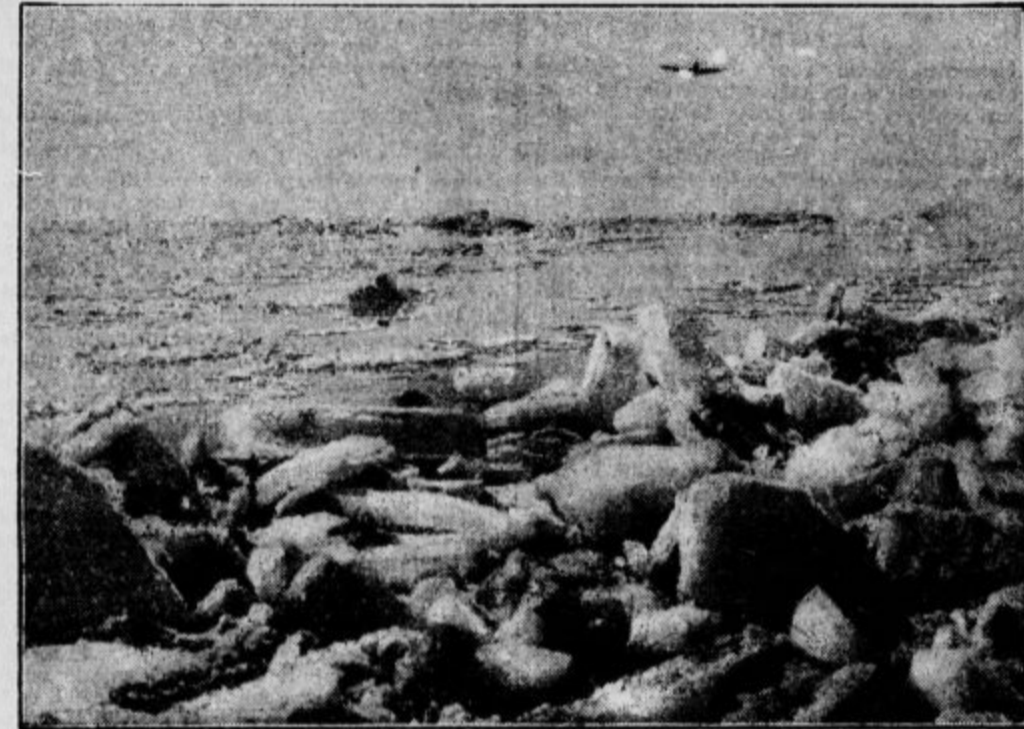
Nad ledeno puščavo severa plove zrakoplov »Hobby«, ki preizkuša, kako bi se dalo rešiti Nobilea.

Red v domovih je zelo strog; načelujejo zdravniki. Za oddih določene delavce najprej temeljito preiščejo in razdele v štiri oddelke: popolnoma zdrave, nevrastenike, slabotne in okrevajoče. Vsak oddelek ima svoj poseben načrt, po katerem se ureja vsakdanje življenje v domovih. Osebe 2., 3. in 4. oddelka imajo določene le malo telovadbe in sporta, deloma pa jim je to popolnoma zabranjeno. Učinek sporta in telovadbe na telo se stalno preiskuje in vpisuje. Na ta način doženejo najboljša pravila za vse domove. Tudi spanje in njegove pritve kontrolirajo s posebnimi aparati. Splošni dnevni red je ta: