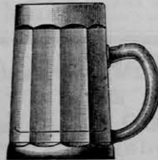
Vzorec št. 5.