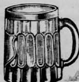
Vzorec št. 2.

Posiljvatve na deželo se izvrše z največjo točnostjo in natančnostjo.