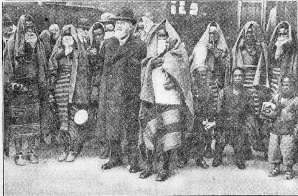
Zanimivi Afrikanci v Berlinu

V plači »Evropa« bo skupno prostora za 30 tisoč oseb. Vsako uro pa prepeljejo lahko na dvigalih do 3000 oseb od nadstropja do nadstropja.