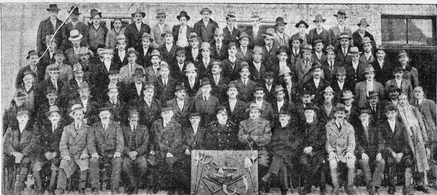
Udeleženci na 7-tedenskem kmetijskem tečaju v Cerkljah pri Kranju, ki ga je priredilo kranjsko sresko načelstvo (kmet referat) v smislu zakona o pospeševanju kmetijstva. Povprečna udeležba je znašala po 132 oseb.

Praga, sobota, 25. aprila. 11.15 Plošče. 12.25 Bratislava. 16.30 Radio orkester v Brnu. 19.35 Koncert. 20.00 Bratislava. 22.25 Moravska Ostrava.