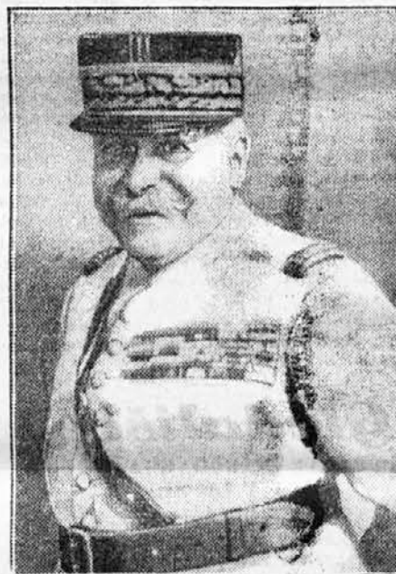
General Guillaumat — odpeljan?

biti oče v njegovo krvno skupino spadajočega dvojčka le mož, oče drugega otroka pa je »neznan«. Švedski biolog Bromann pa je potrdil, da je čisto mogoče, da je vsak dvojček potomec drugega očeta.