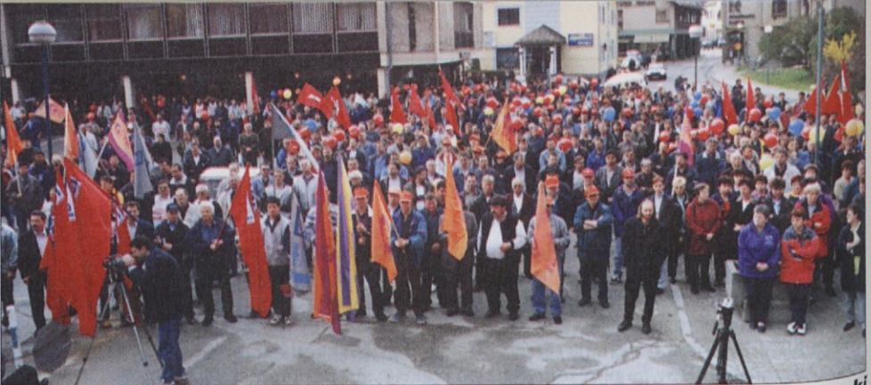
Na ploščadi pred Namo na Ravnah se je zbralo več kot 2000 kovinarjev, ki so navdušeno ploskali govornikom.