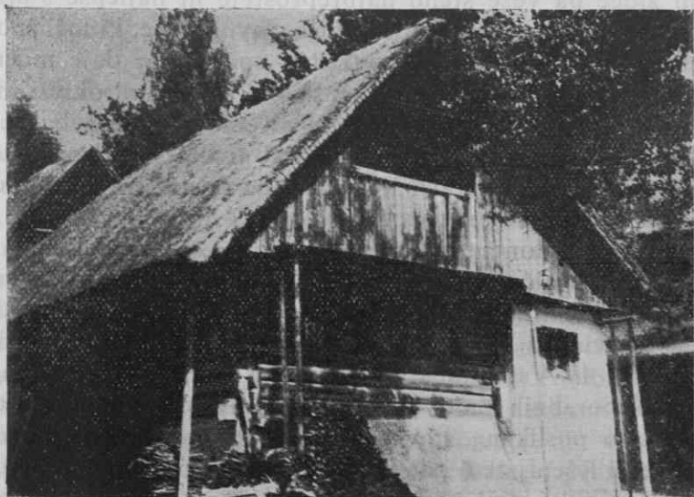
Sl. 3 Hiša v Homcu pri Kamniku