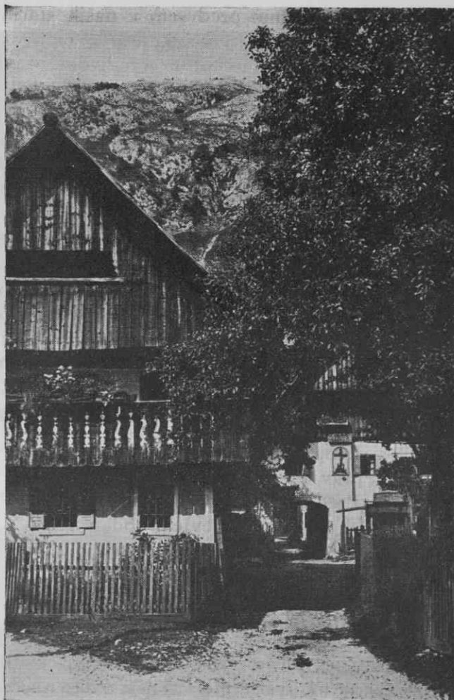
Sl. 1. Gorenjska hiša