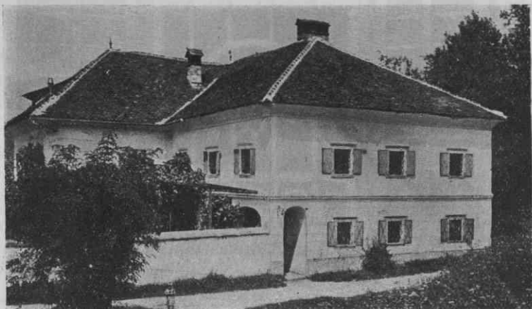
Sl. 5. Hiša pri Kamniku

Kolikor je konstruktivno lesovje, kakor špirovci, lege, stropniki itd., pri napuščih vidno, ni okrašeno, temveč tvori že samo po sebi za nas dovolj ukrasno členovitost s svojim naravnim ogrodjem. Leseni hodniki, ki so pri hišah bodisi lepotnega, bodisi porabnega pomena, so polepšani na nekaterih posebno vidnih mestih z izrezljanimi deščicami. Sl. 1. Toda le-té niso reliefno ali pa vedno tako izrezane, da bi bila deščica potem okrasni motiv v